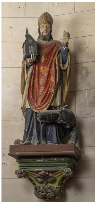
Statue de saint Vaast ou saint Amand, bois polychrome, 2e moitié 18e siècle (?). IVR32_20216000707NUCA