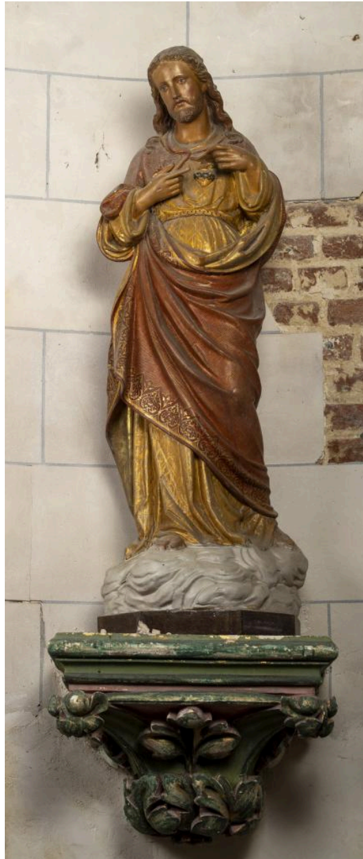
Statue du Christ au Sacré Cœur, plâtre polychrome, 2e moitié 19e siècle.