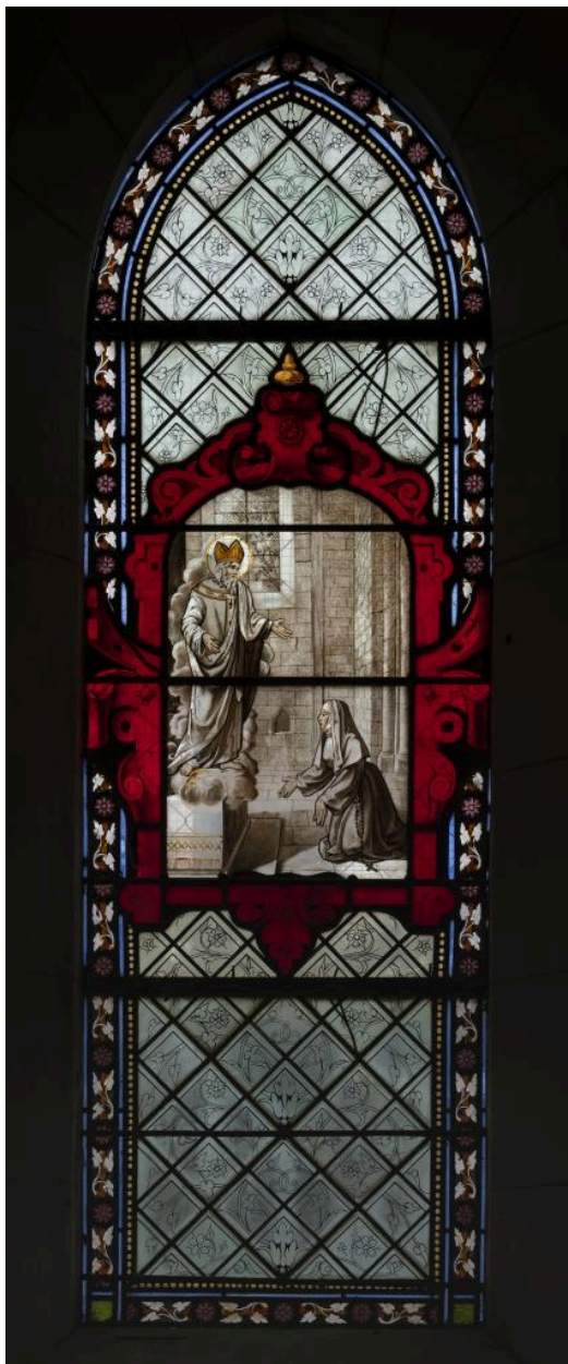
Verrière (baie 1): saint Amand apparaît à sainte Aldegonde, signée "Roussel à Beauvais 1877".