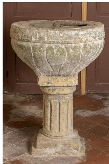
Fonts baptismaux, pierre, 17e siècle (?). IVR32_20216000722NUCA