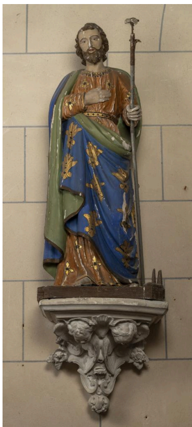
Statue de saint Joseph, plâtre polychrome, 2e moitié du 19e siècle (?). IVR32_20216000704NUCA