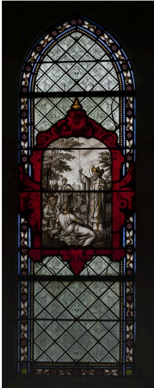
Verrière (baie 2): saint Amand prêche, signée "Roussel à Beauvais 1877".