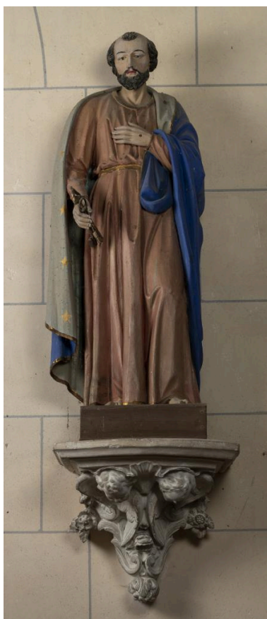
Statue de saint Pierre, bois polychrome, 1er quart 19e siècle (?).