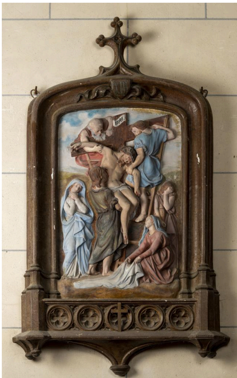
Station n°13 du chemin de croix: Jésus est descendu de la croix et remis à sa mère, bas-relief en plâtre polychrome, 2e moitié 19e siècle.