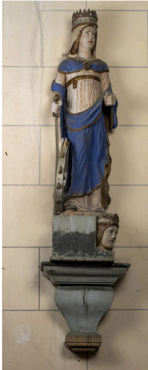
Statue de sainte Catherine, bois polychrome, limite des 17e et 18e siècles (?).