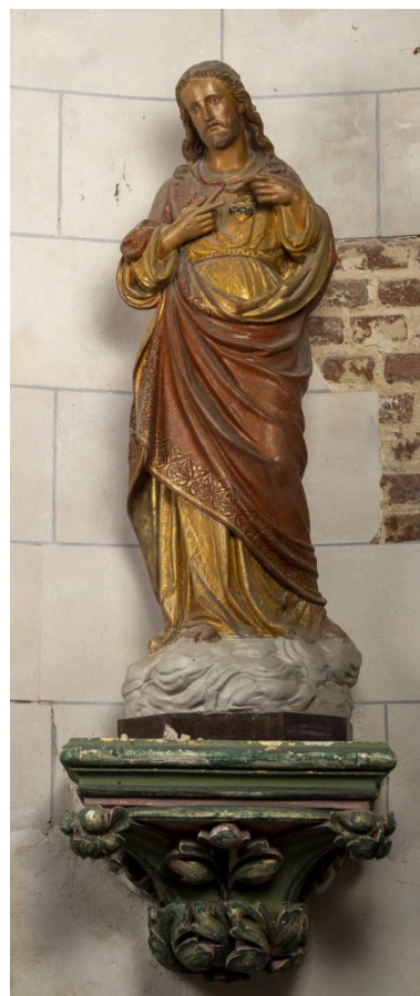
Statue du Christ au Sacré Cœur, plâtre polychrome, 2e moitié 19e siècle.