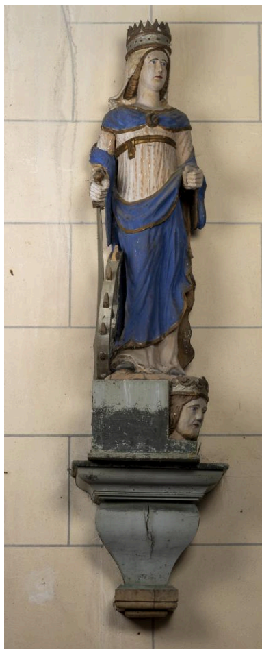
Statue de sainte Catherine, bois polychrome, limite des 17e et 18e siècles (?). IVR32_20216000703NUCA