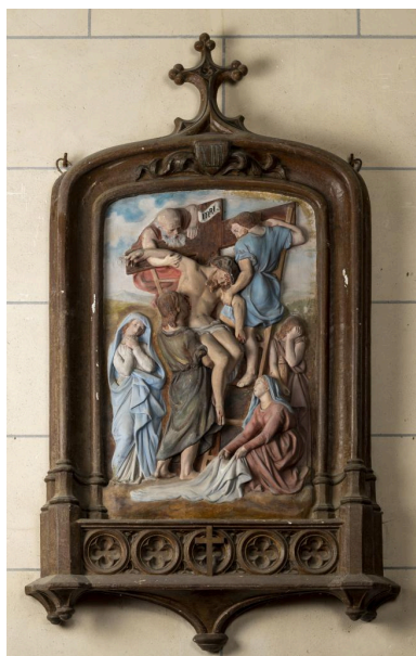
Station n°13 du chemin de croix: Jésus est descendu de la croix et remis à sa mère, bas-relief en plâtre polychrome, 2e moitié 19e siècle. IVR32_20216000713NUCA