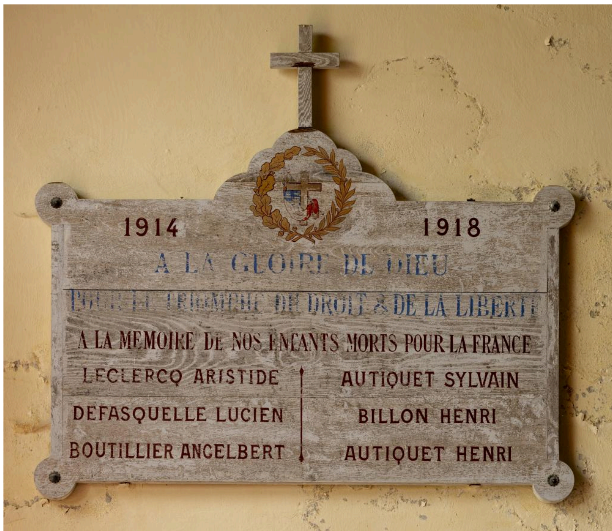
Plaque commémorative des paroissiens morts pendant la guerre 1914-1918, bois, vers 1920.