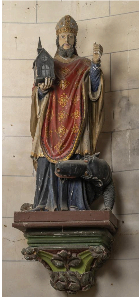
Statue de saint Vaast ou saint Amand, bois polychrome, 2e moitié 18e siècle (?).