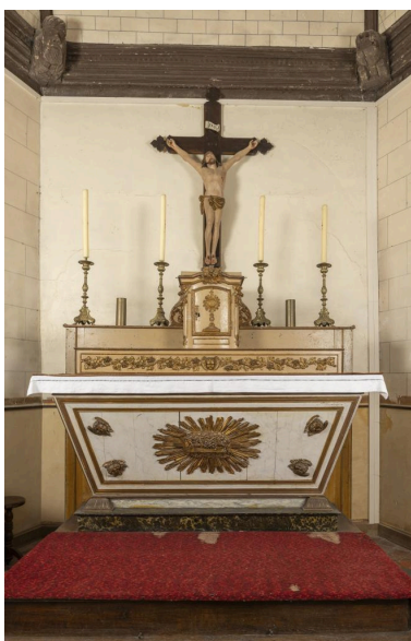
Vue générale de l'autel avec son tabernacle et du Christ en Croix.

IVR32_20216000723NUCA