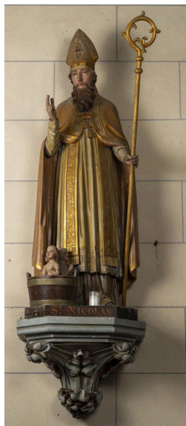
Statue de saint Nicolas, bois polychrome, 1er quart 19e siècle (?).