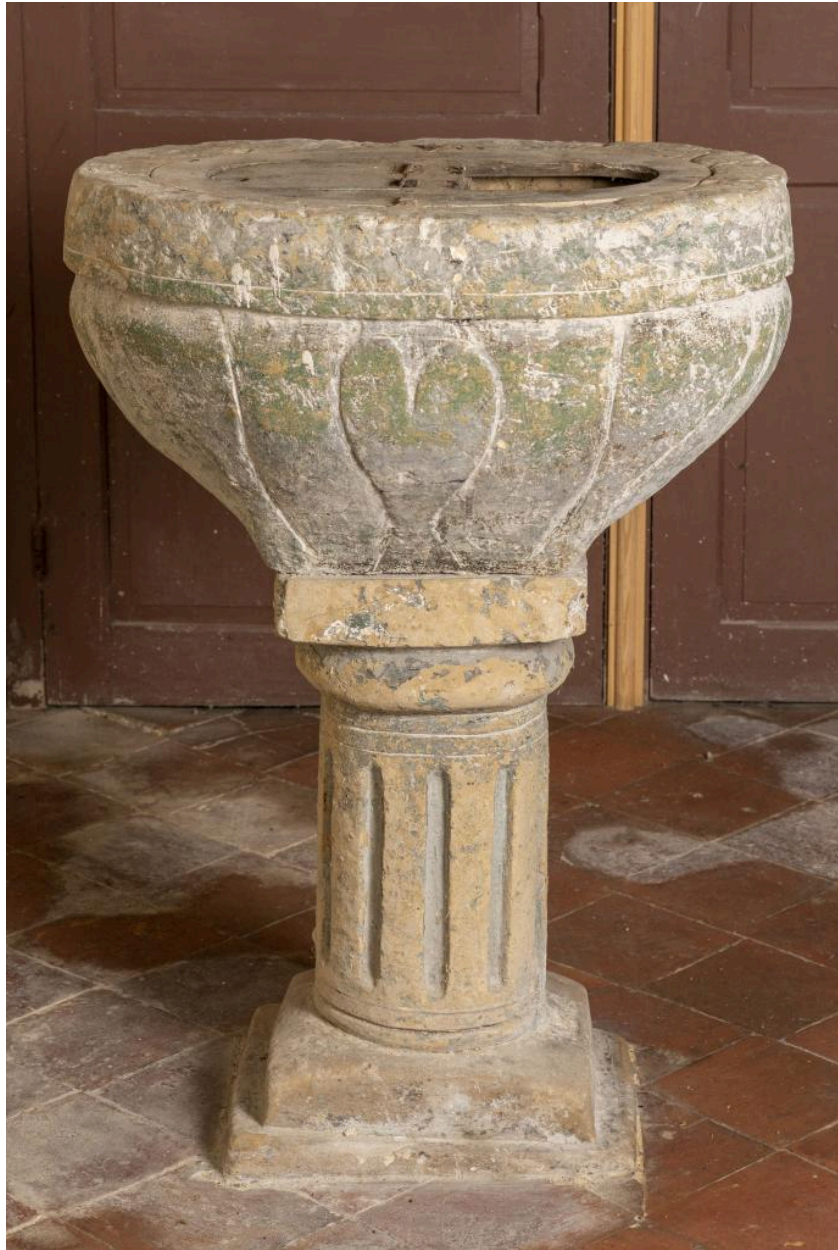
Fonts baptismaux, pierre, 17e siècle (?).