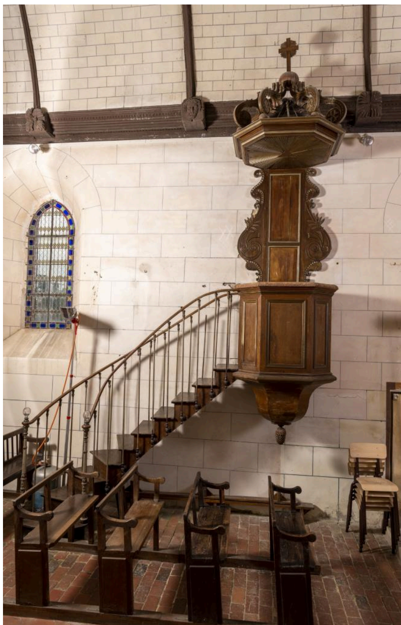
Chaire à prêcher, chêne, dernier quart 18e siècle (?), escalier 19e siècle.