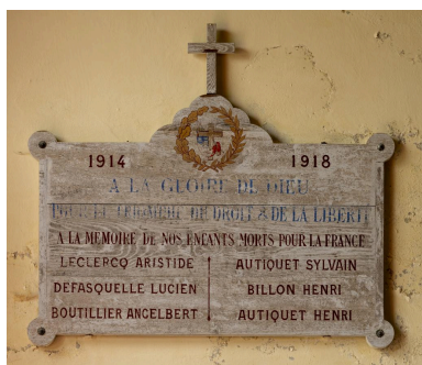
Plaque commémorative des paroissiens morts pendant la guerre 1914-1918, bois, vers 1920.