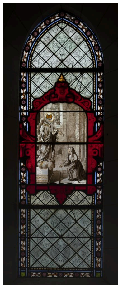
Verrière (baie 1): saint Amand apparaît à sainte Aldegonde, signée "Roussel à Beauvais 1877".

IVR32_20216000709NUCA