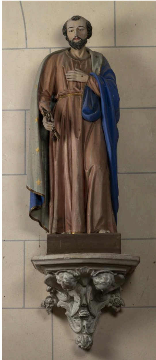
Statue de saint Pierre, bois polychrome, 1er quart 19e siècle (?).