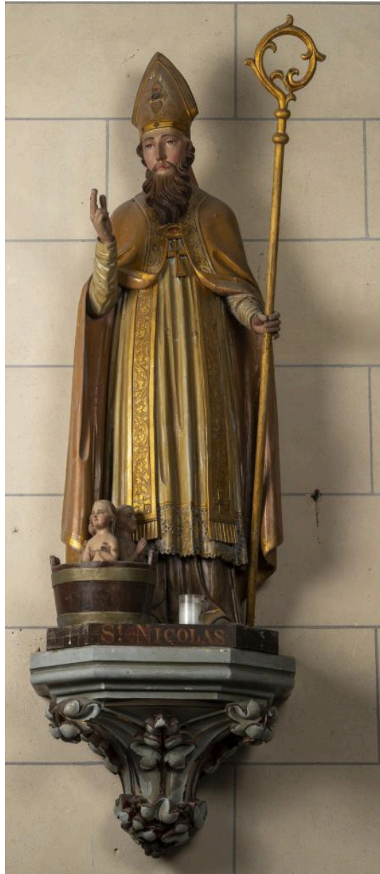
Statue de saint Nicolas, bois polychrome, 1er quart 19e siècle (?).