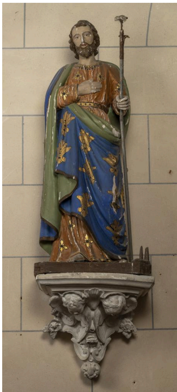
Statue de saint Joseph, plâtre polychrome, 2e moitié du 19e siècle (?).