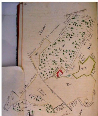
Plan d'arpentage de la ferme à la fin du 18e siècle (AD Aisne : H 1775).