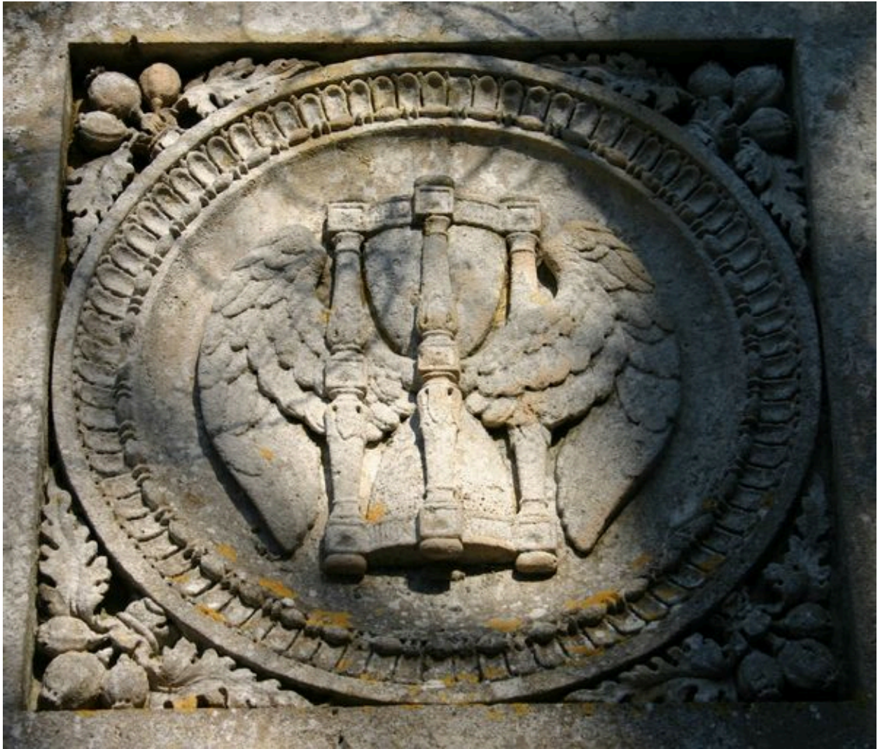
Monument sépulcral de Morgan de Belloy. Vue de détail sur le décor sculpté, ornant les faces latérales de l'élévation supérieure.