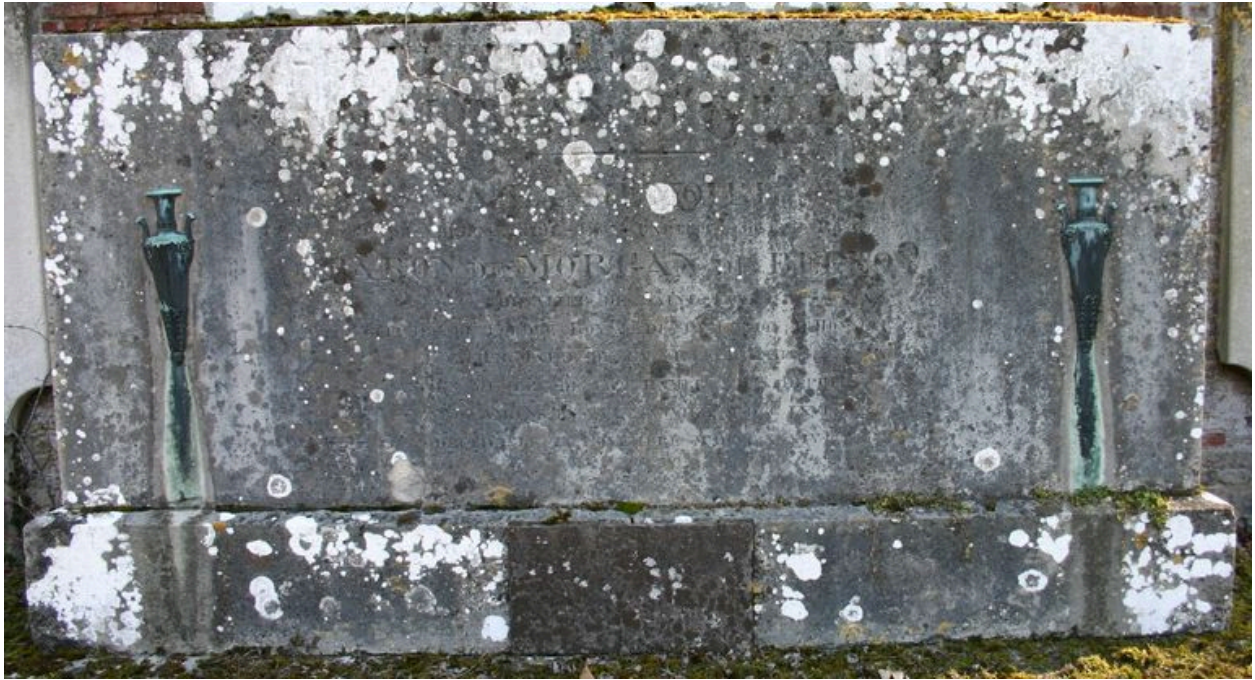
Monument sépulcral de Morgan de Belloy. Partie inférieure.