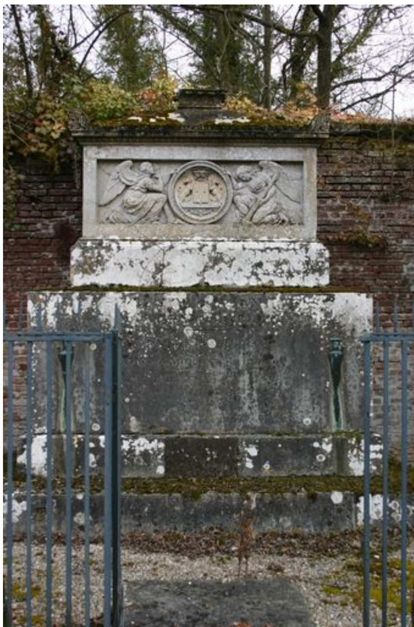
Monument sépulcral de Morgan de Belloy. Vue générale.