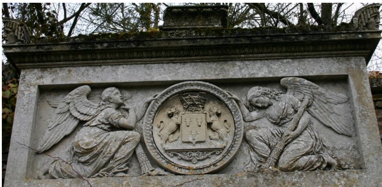
Monument sépulcral de Morgan de Belloy. Vue de détail sur le bas-relief ornant la partie supérieure.