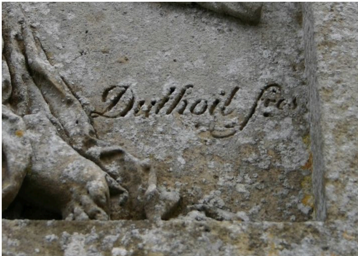
Monument sépulcral de Morgan de Belloy. Vue de détail sur la signature.