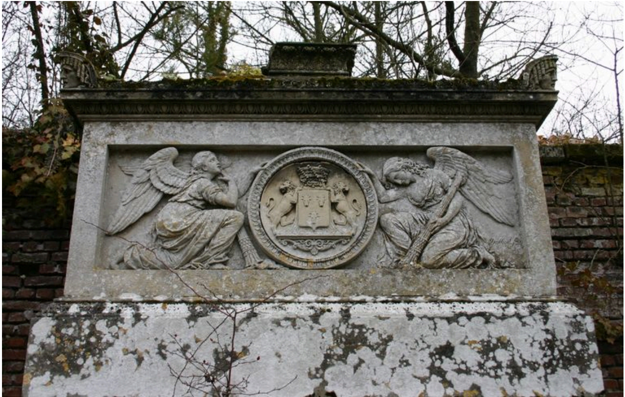
Monument sépulcral de Morgan de Belloy. Partie supérieure.