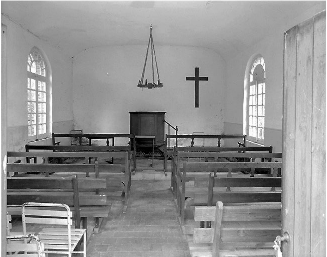
Vue intérieure du temple.