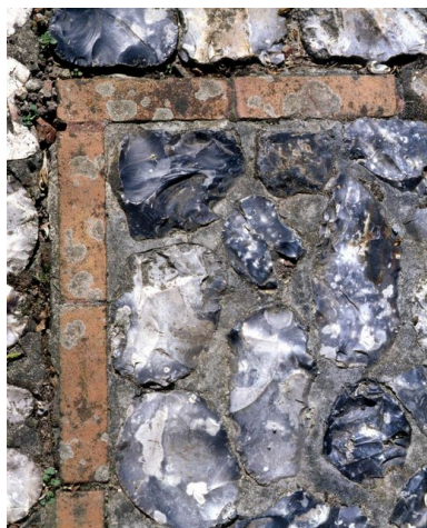
Détail du décor sculpté.