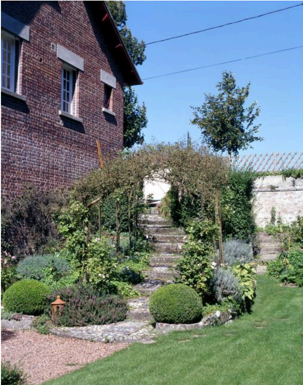
Escalier d'accès au jardin.