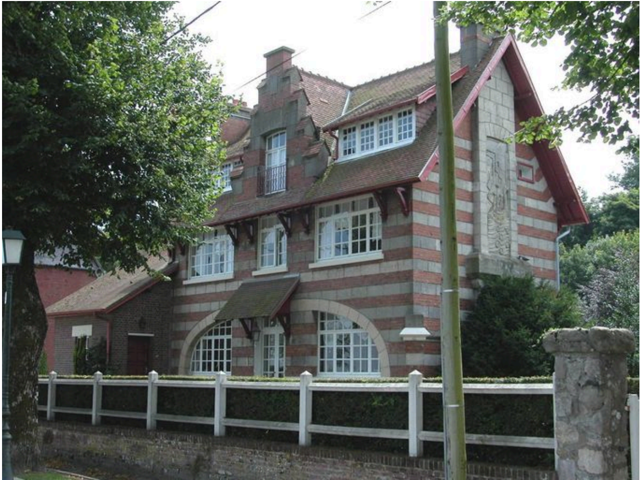
Vue d'ensemble depuis la digue.