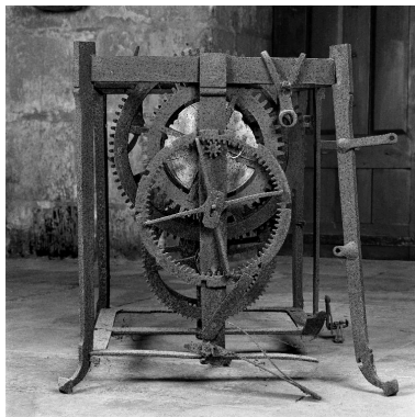
Vue latérale du mécanisme (côté du cadran).