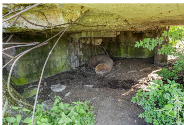
Vue intérieure vers le nord IVR31_20145905497NUCA