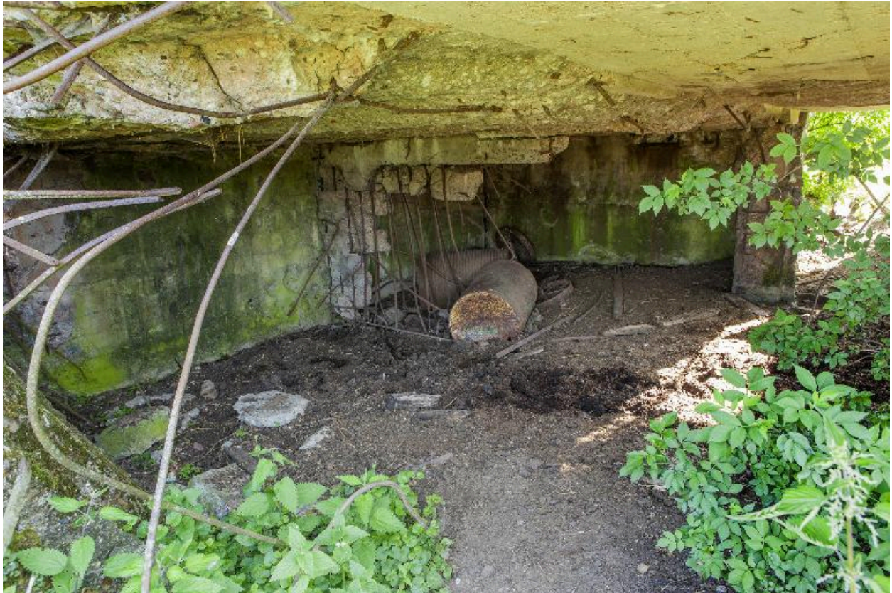
Vue intérieure vers le nord