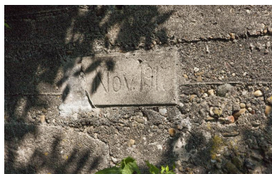
Date portée, sur l'élévation sud IVR31_20145905496NUCA