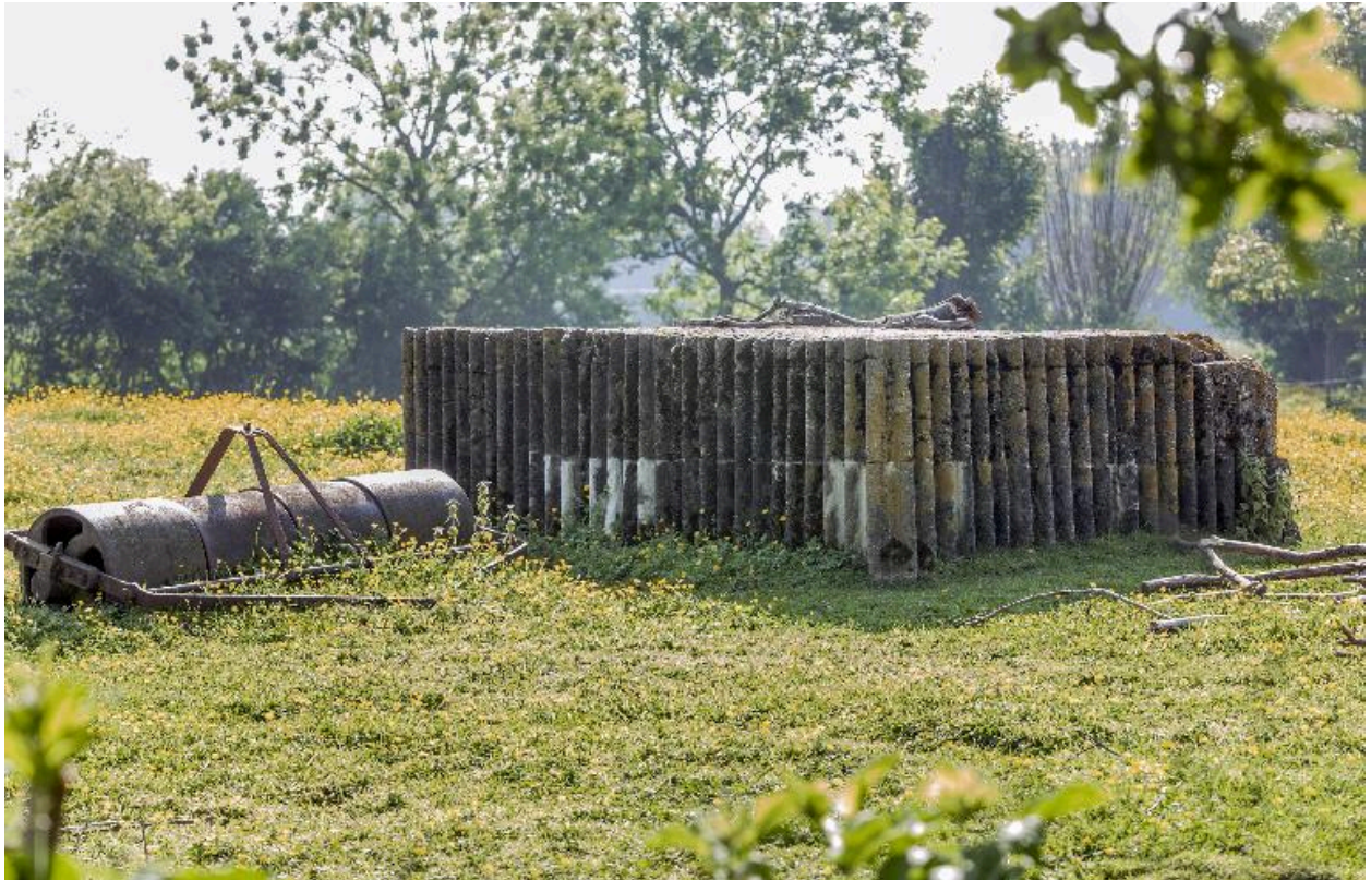
Vue arrière de l'édicule, vers le sud-ouest