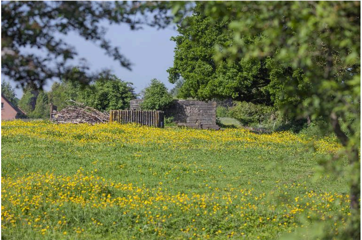
Vue générale, vers l'ouest.