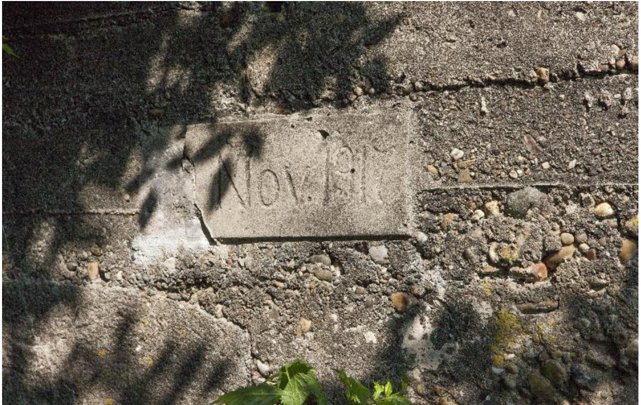
Date portée, sur l'élévation sud