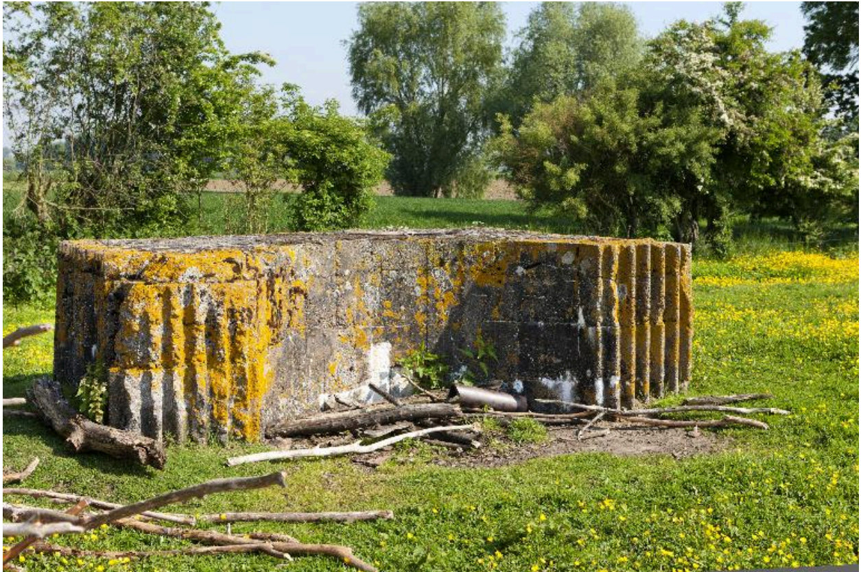
Edicule, vers le nord-est