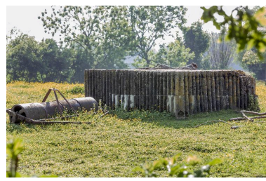
Vue arrière de l'édicule, vers le sud-ouest IVR31_20145905506NUCA