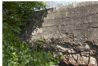
Partie de l'élévation sud