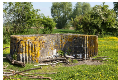
Edicule, vers le nord-est IVR31_20145905507NUCA