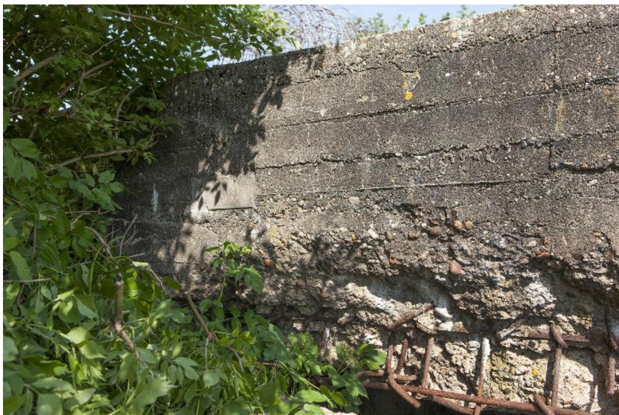
Partie de l'élévation sud