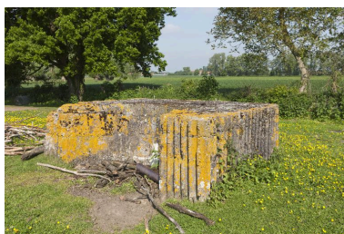
Edicule vers le nord-ouest IVR31_20145905509NUCA