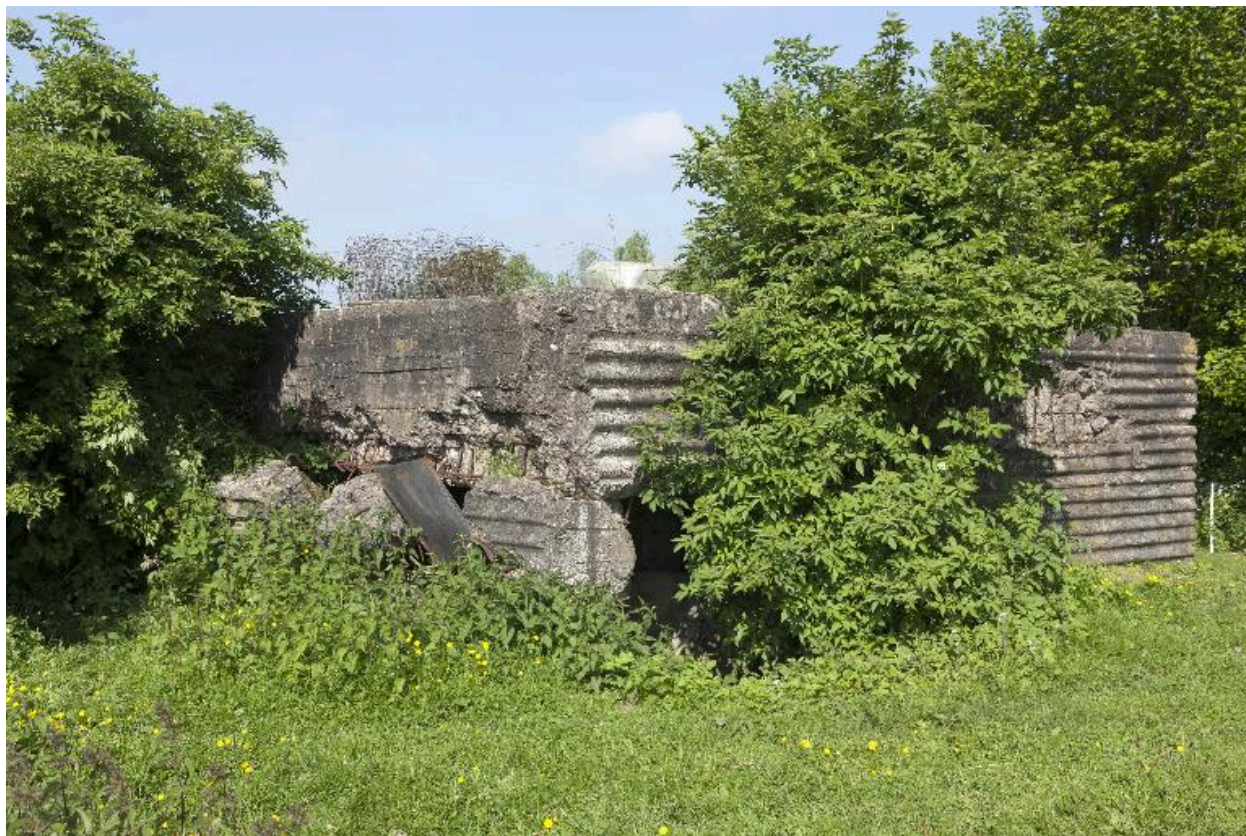
Vue de trois-quarts vers nord-ouest de la casemate dynamitée