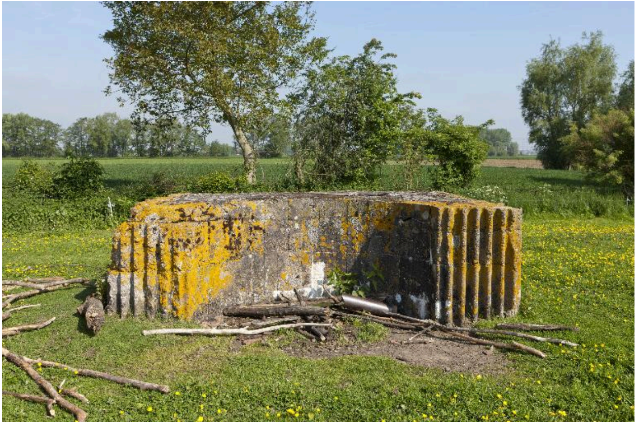
2dicule, vers le nord