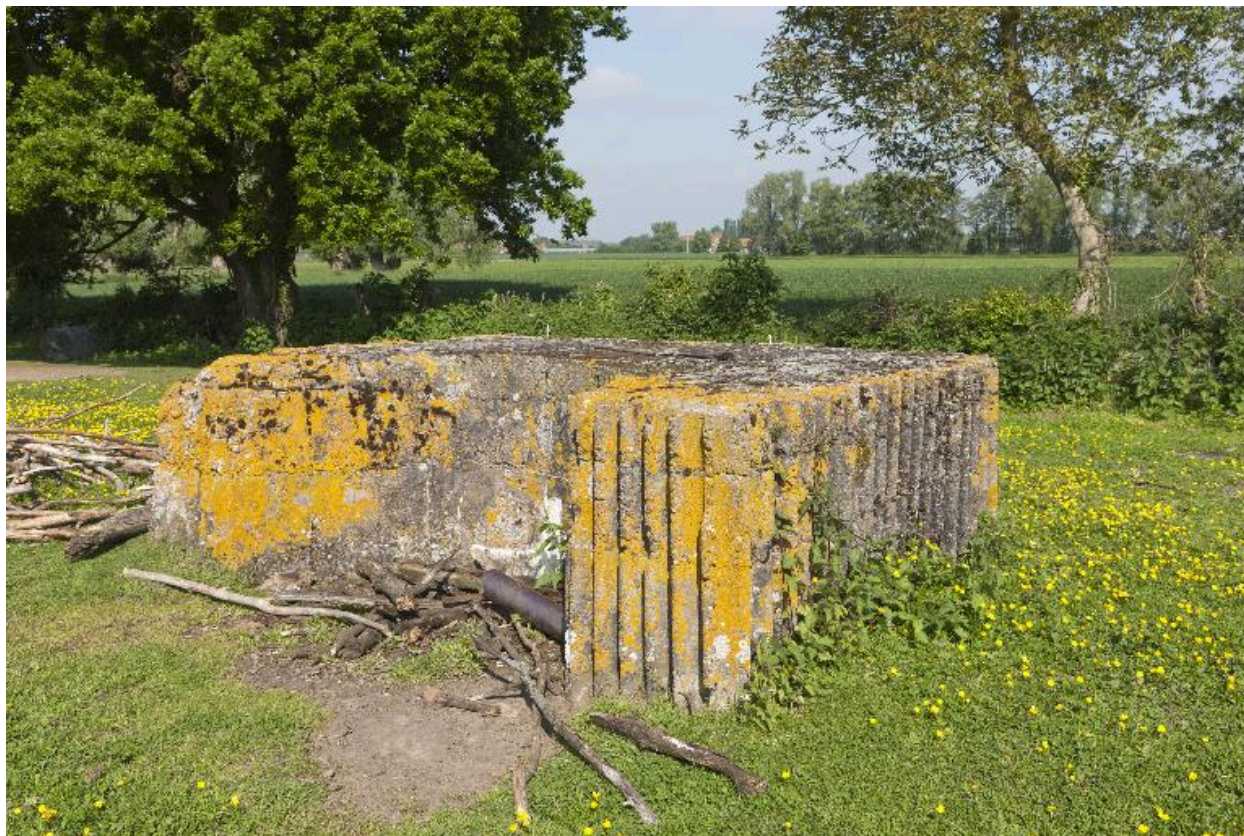
Edicule vers le nord-ouest