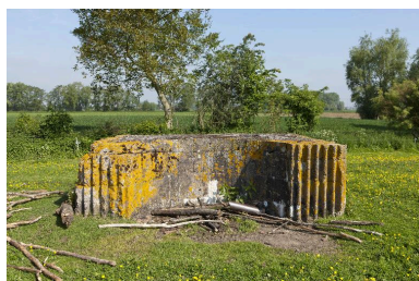
Edicule, vers le nord