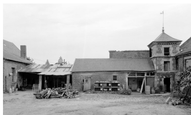
Vue partielle de la cour, côté gauche. IVR22_19846000966X