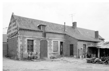
Logis. Elévation sur cour. IVR22_19846000965X