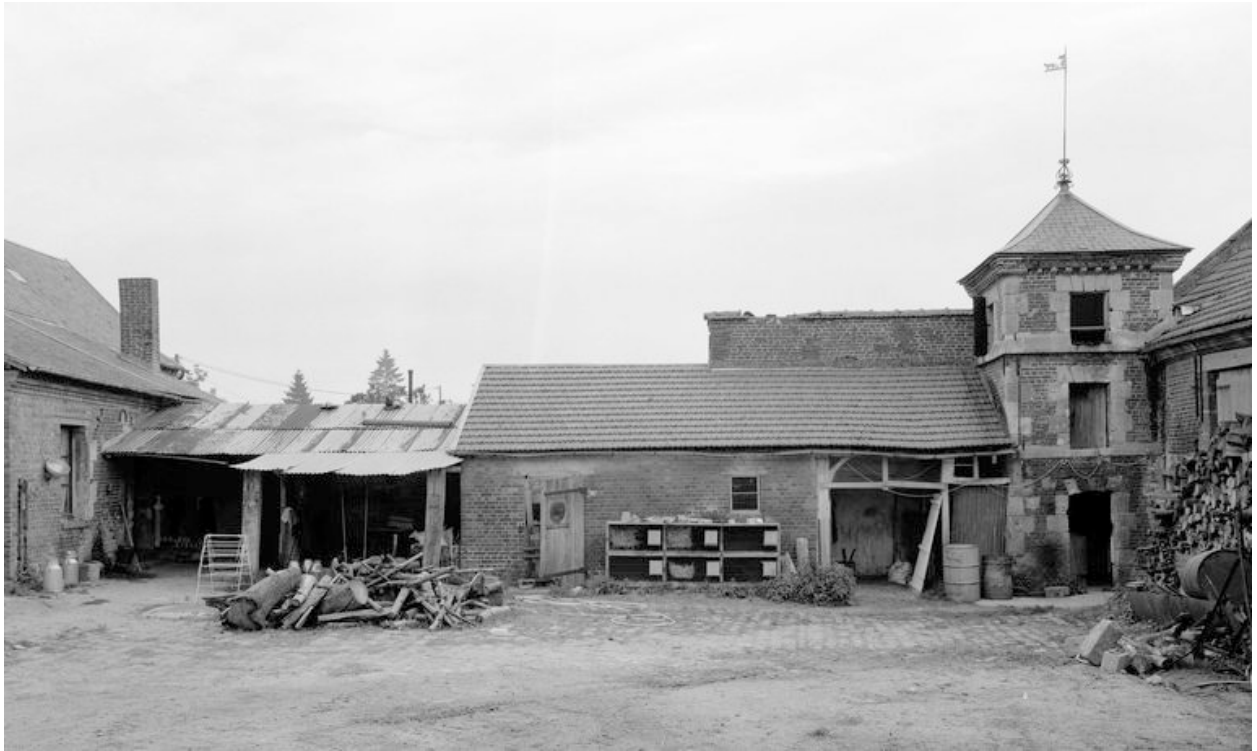
Vue partielle de la cour, côté gauche.