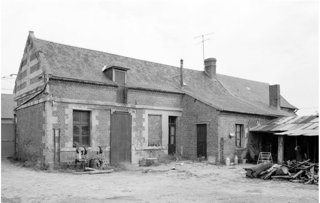
Logis. Elévation sur cour.