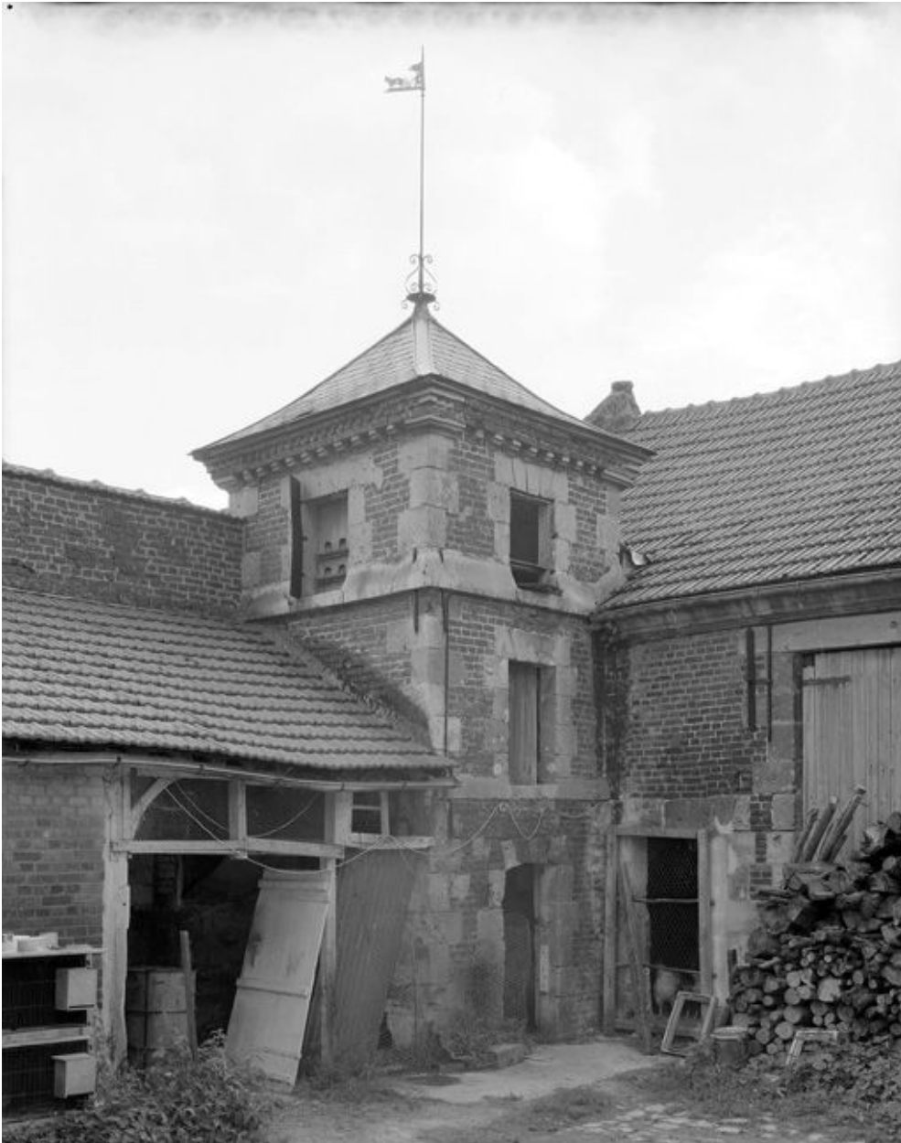
Pigeonnier. Vue générale.