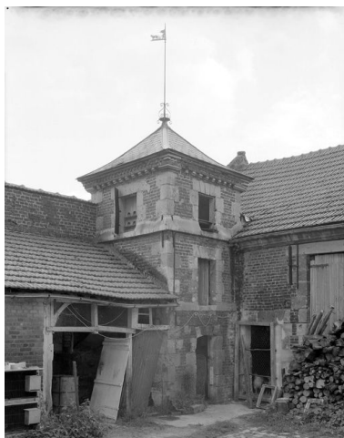
Pigeonnier. Vue générale. IVR22_19846000956V