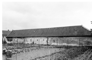
Etable et remise. Elévations extérieures, du côté droit de la cour.