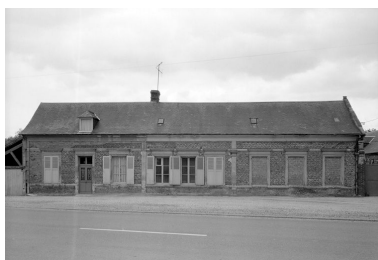
Logis. Elévation sur rue.