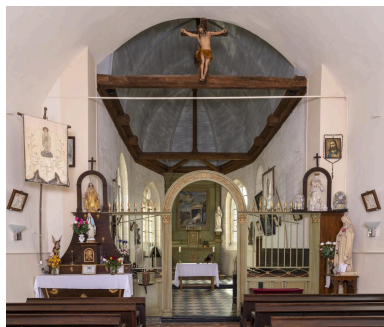
Vue du chœur. IVR32_20216000392NUCA