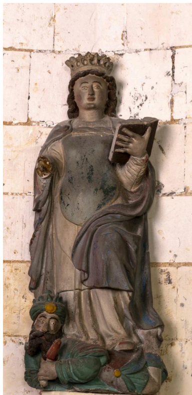
Statue de sainte Catherine, bois polychrome, 16e siècle.