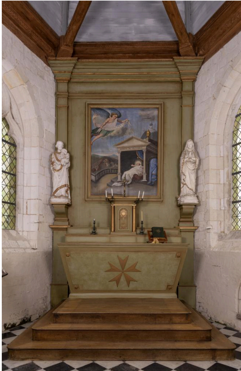
Ensemble du maître-autel avec tableau représentant une scène inspirée d'un cantique à la Vierge, 2e quart du 19e siècle.