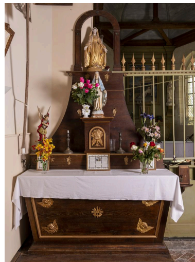
Autel secondaire de la Vierge avec tabernacle et statuette de l'Immaculée Conception, 2e quart 19e siècle. IVR32_20216000474NUCA