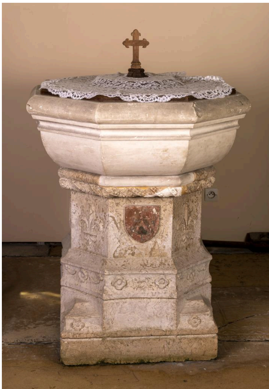
Fonts baptismaux avec blason des seigneurs de Choqueuse, pierre, limite des 15e et 16e siècles.