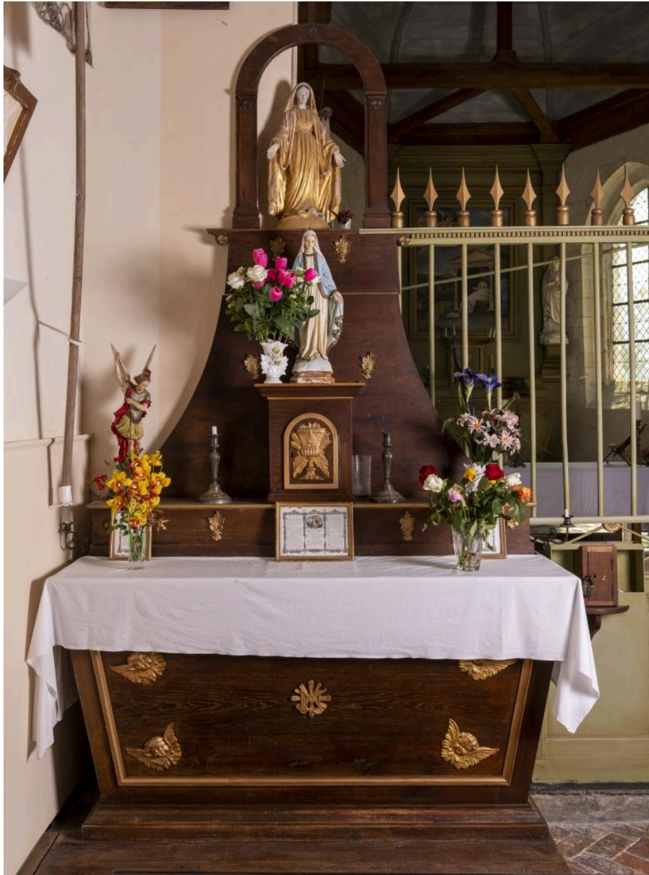
Autel secondaire de la Vierge avec tabernacle et statuette de l'Immaculée Conception, 2e quart 19e siècle.