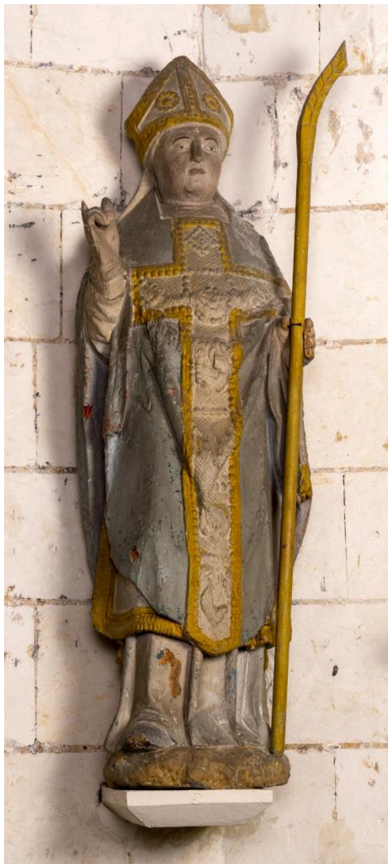
Statue de saint évêque, bois polychrome, 16e siècle.