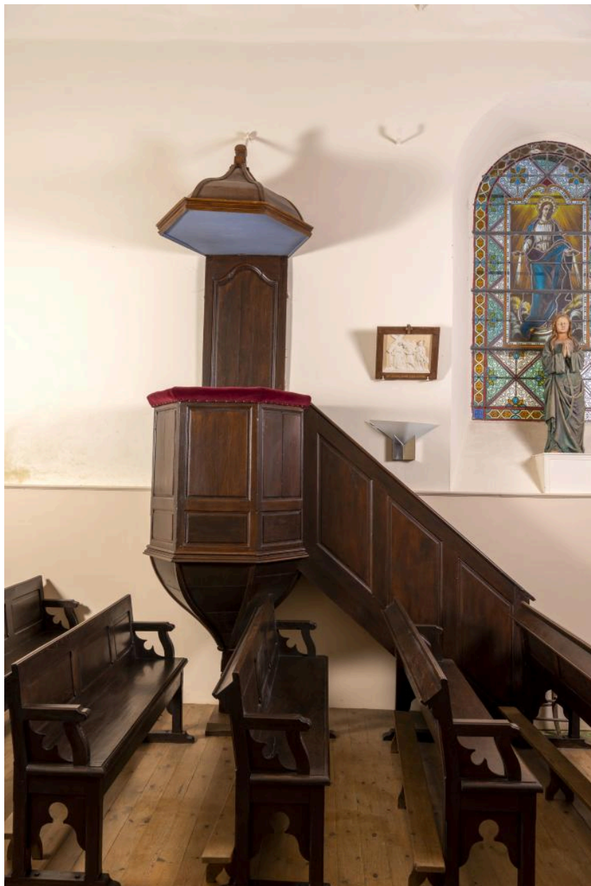
Chaire à prêcher, 1ère moitié du 19e siècle.