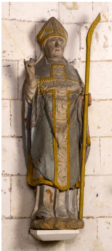
Statue de saint évêque, bois polychrome, 16e siècle.