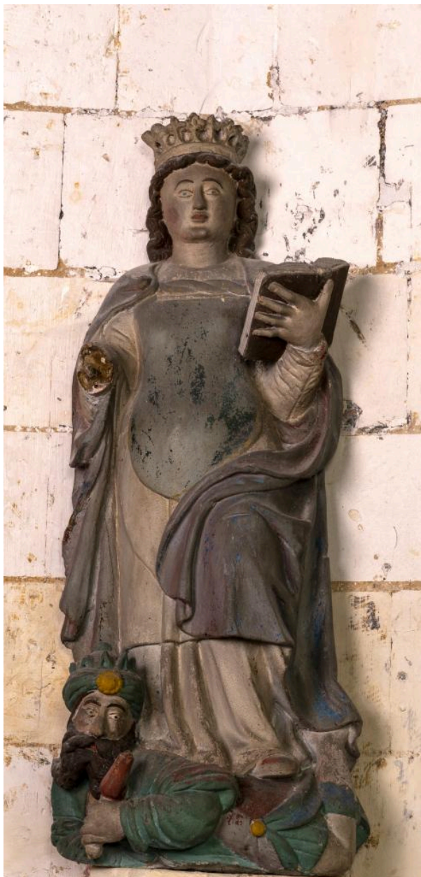
Statue de sainte Catherine, bois polychrome, 16e siècle.