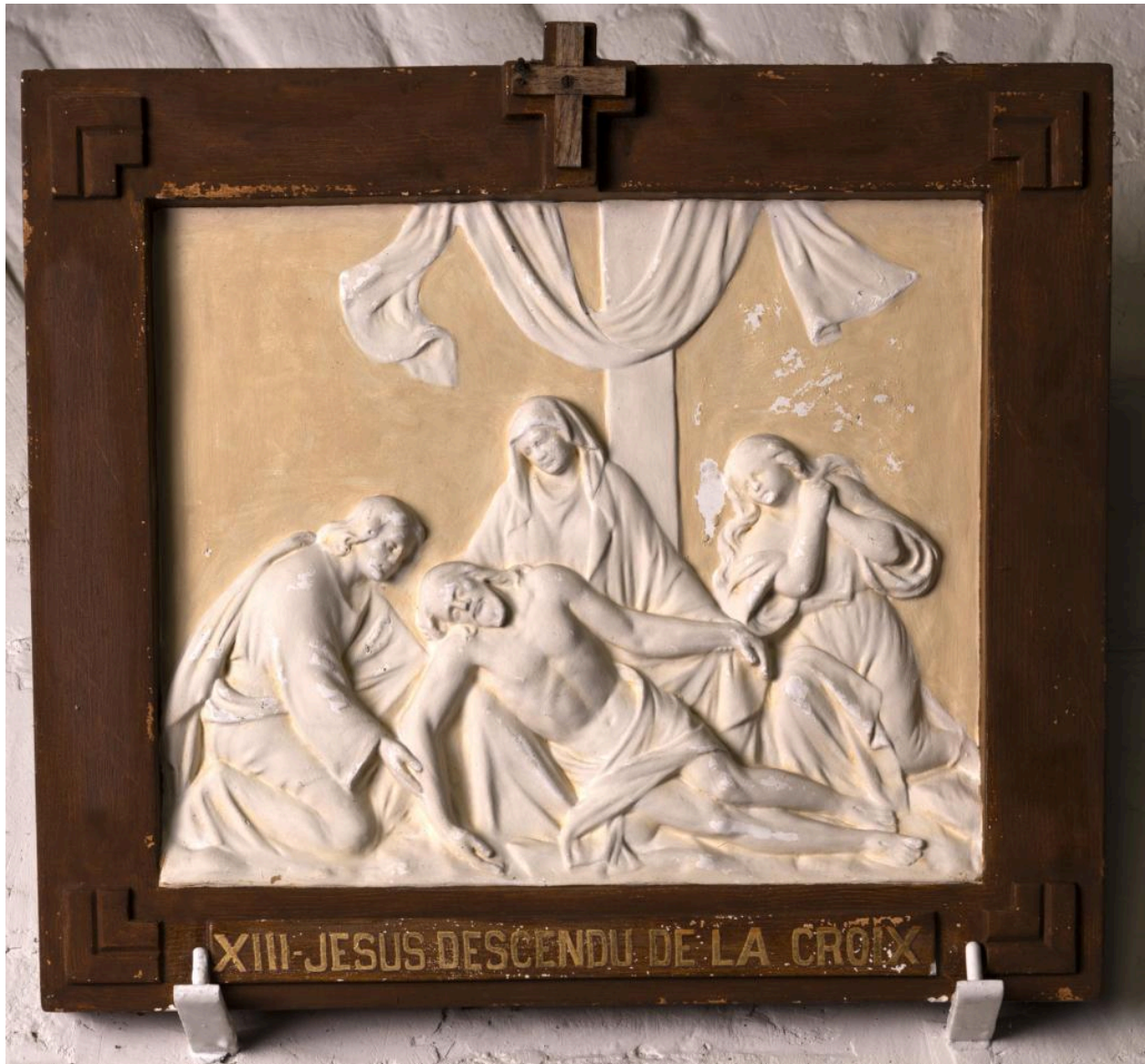
Chemin de croix, station 13: Jésus descendu de la croix, cadre en bois et bas-relief en plâtre, premier quart du 20e siècle.