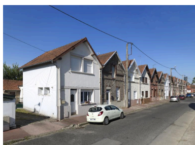
Logements ouvriers de la rue Henri-Piquet. IVR22_20168000289NUC2A