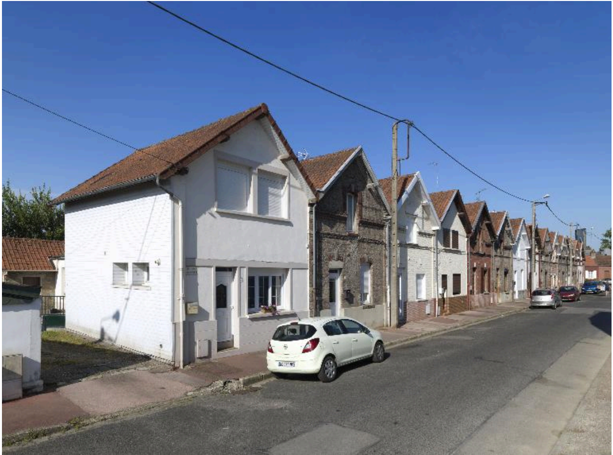
Logements ouvriers de la rue Henri-Piquet.