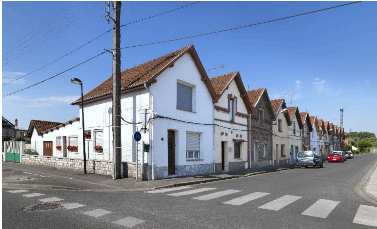
Logements ouvriers de la rue Nouvelle-Cité-Saint.