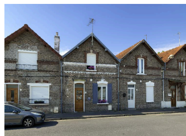
Logements ouvriers de la rue Nouvelle-Cité-Saint, façades des n° 19, 21 et 23. IVR22_20168000294NUC2A