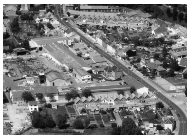
Vue aérienne générale de 1990.