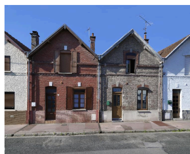
Logements ouvriers de la rue Henri- Piquet, façades des n° 18 et 20.