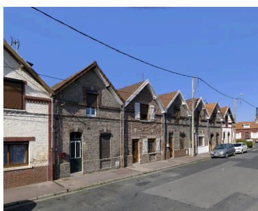
Logements ouvriers de la rue Henri-Piquet. IVR22_20168000290NUC2A