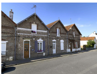
Logements ouvriers de la rue Nouvelle-Cité-Saint.