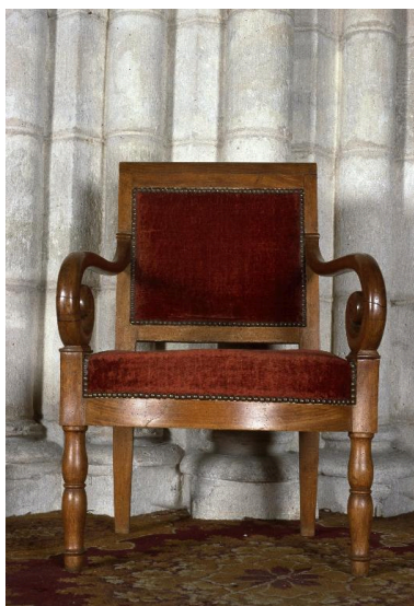
L'un des fauteuils, vu de face.

Phot. Irwin Leullier IVR22_20010202338ZA