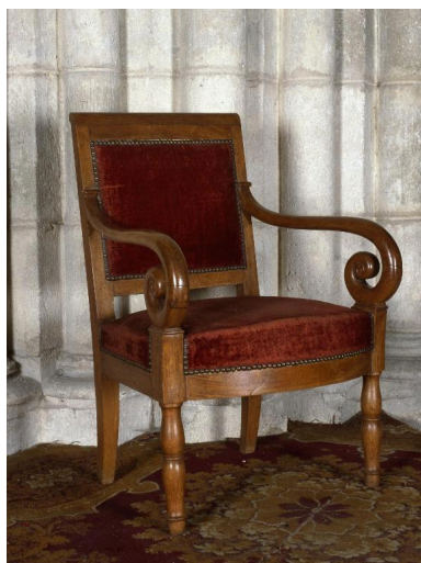
L'un des fauteuils, vu de trois-quarts.

IVR22_20010202338ZA