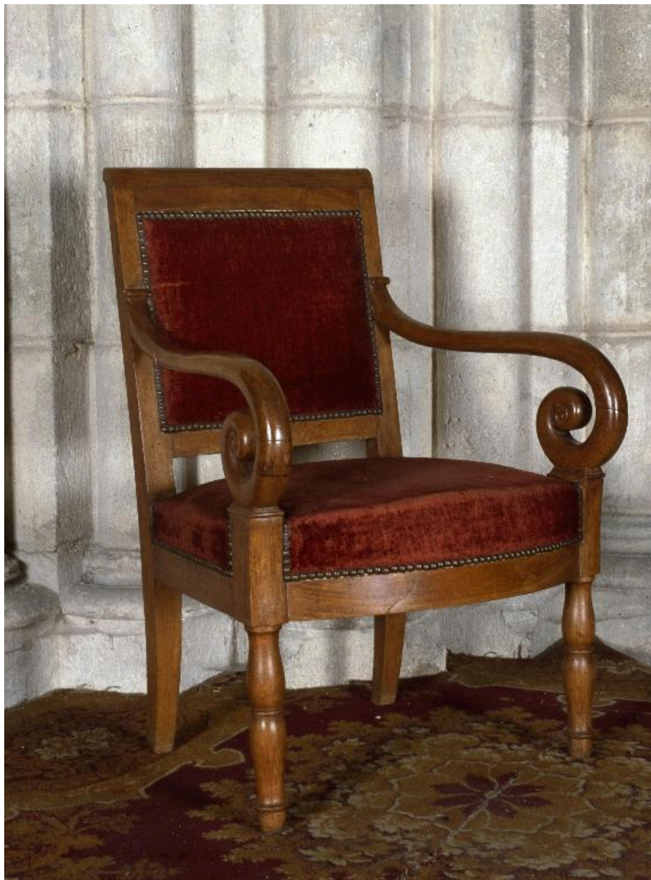
L'un des fauteuils, vu de trois-quarts.