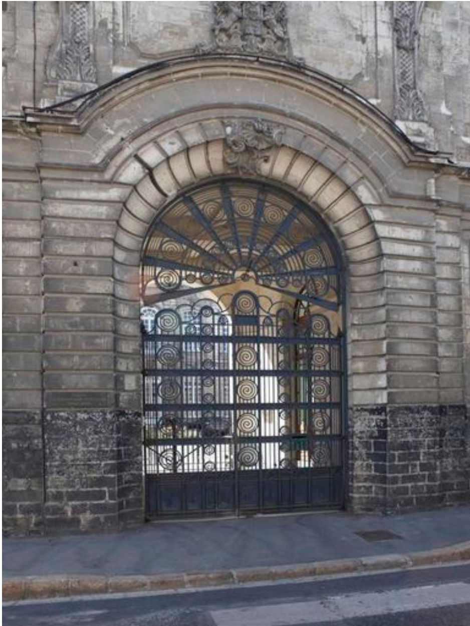
Vue de la porte cochère fermée par une grille de style Art déco.