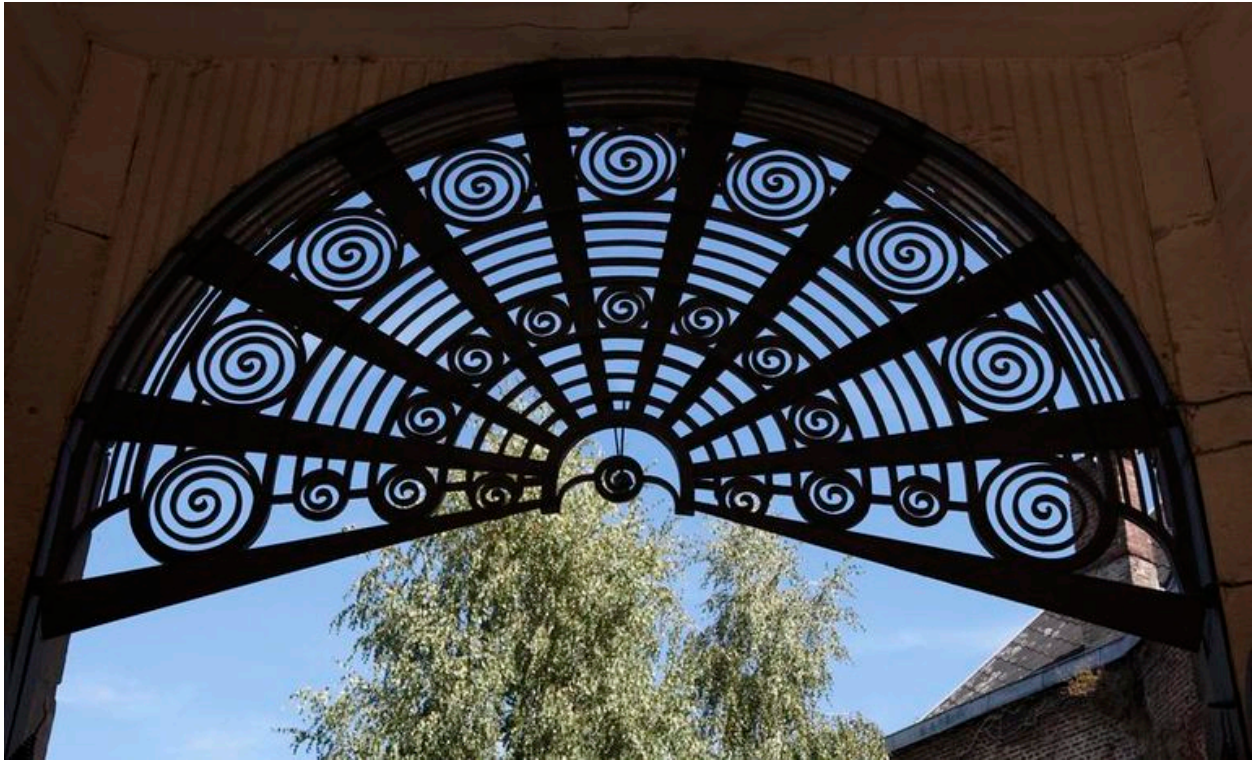
Vue de détail du couronnement de la porte cochère constitué de motifs en spirales.