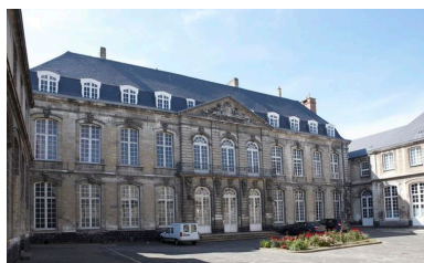
Vue générale. IVR31_20086200143NUCA