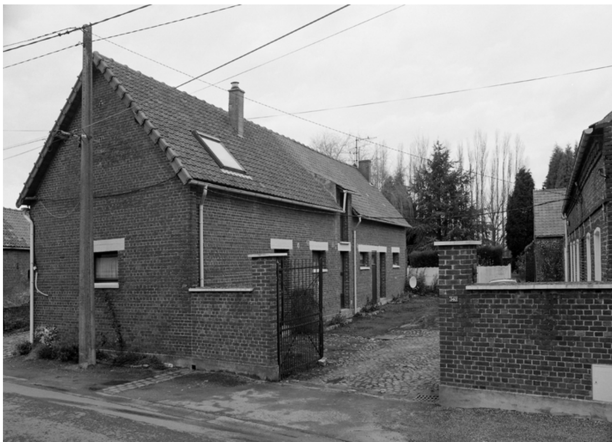
Vue générale des étables-écuries depuis la rue.