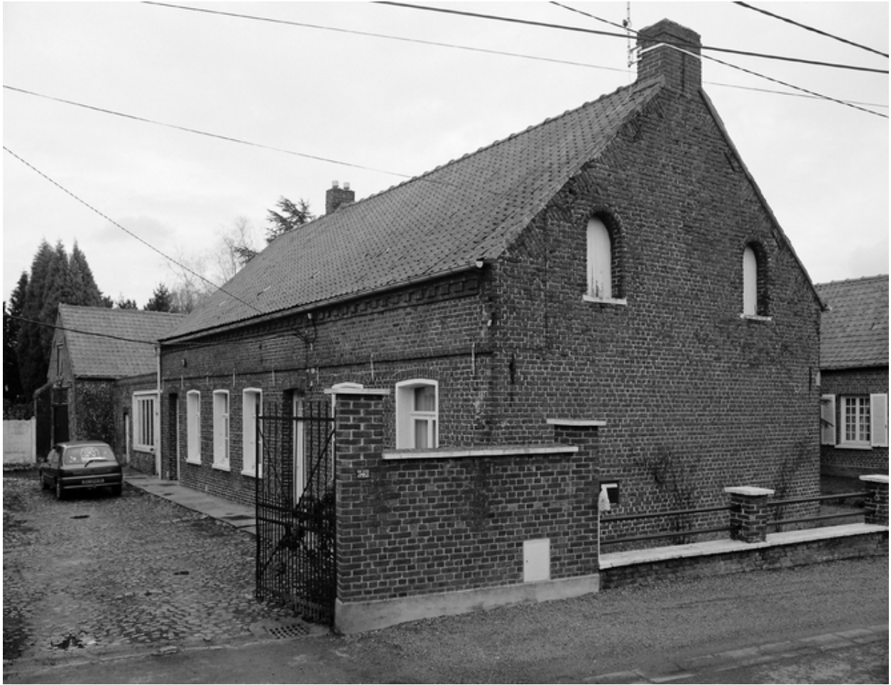
Vue générale du logis depuis la rue.