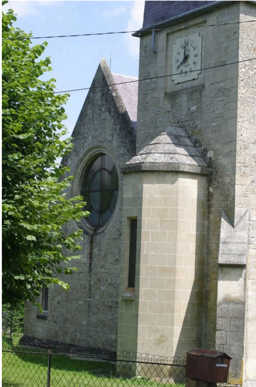
Vue de la façade ouest.