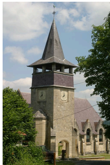
Vue latérale. IVR22_20030202864NUCA