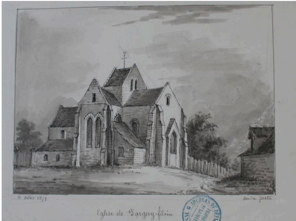
Dessin présentant l'édifice à la fin du 19e siècle, par Amédée Piette (AD Aisne : 8 Fi Pargny 1).