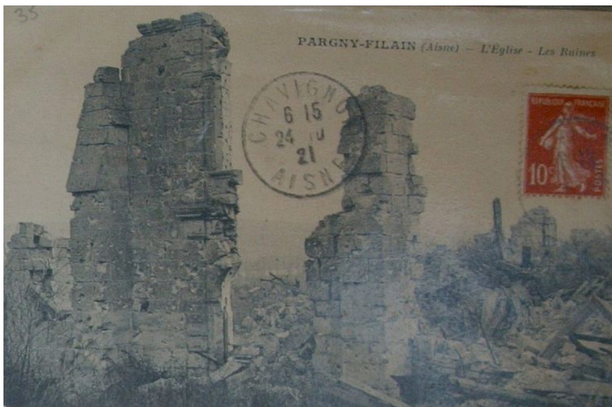
Vue de l'église en ruine (coll. part).