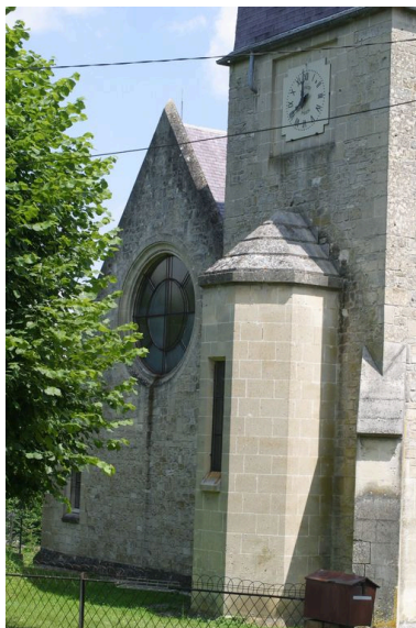
Vue de la façade ouest.