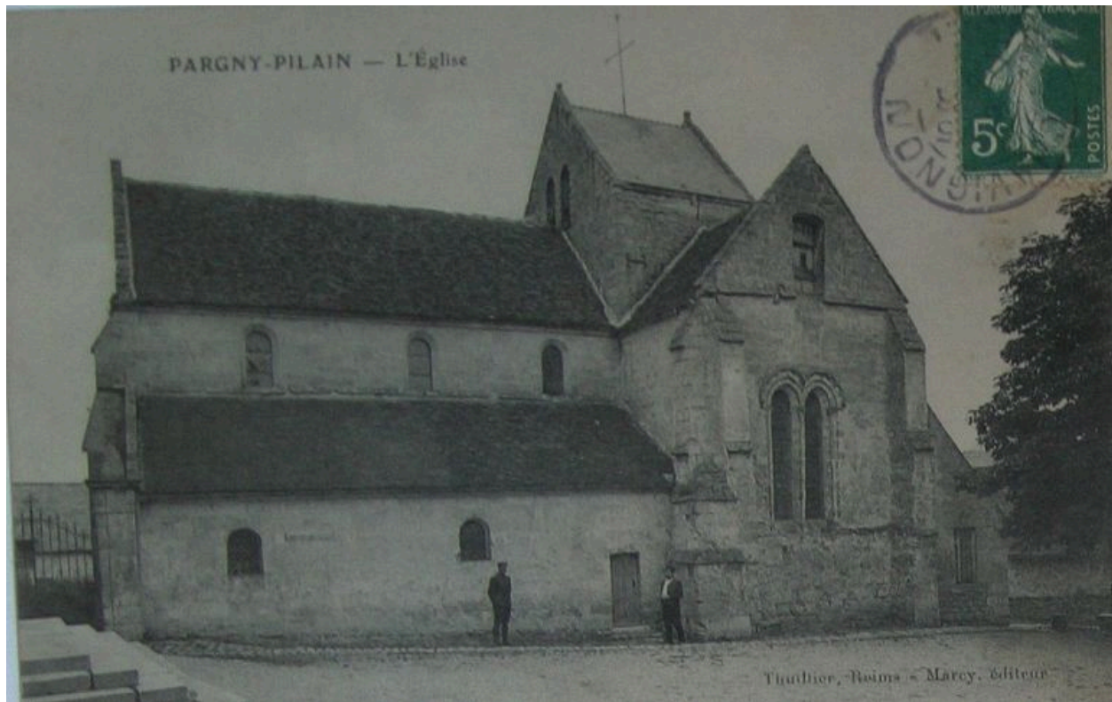
Vue de l'édifice avant la guerre (coll. part).