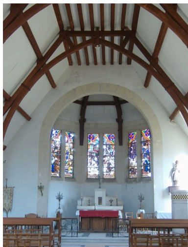
Vue générale du chœur. IVR22_20030202862NUCA