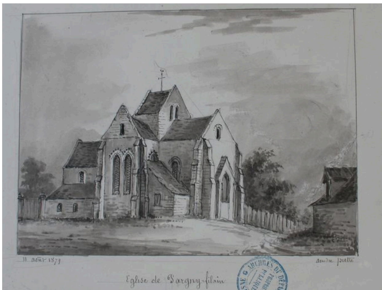
Dessin présentant l'édifice à la fin du 19e siècle, par Amédée Piette (AD Aisne : 8 Fi Pargny 1).