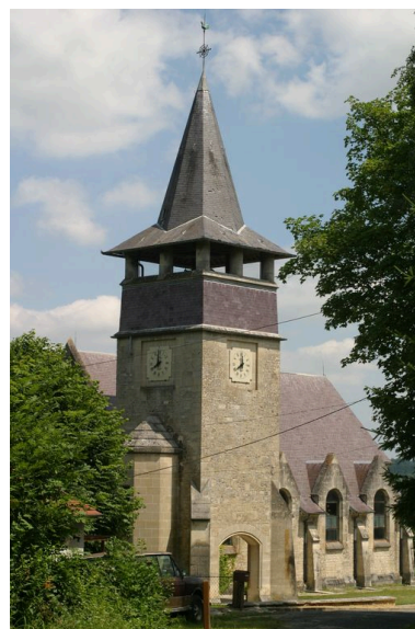
Vue latérale.