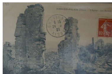
Vue de l'église en ruine (coll. part). IVR22_20030202880NUCAB