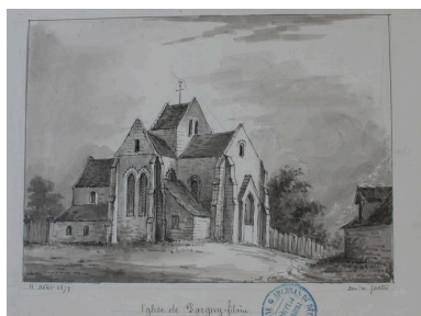
Dessin présentant l'édifice à la fin du 19e siècle, par Amédée Piette (AD Aisne : 8 Fi Pargny 1).