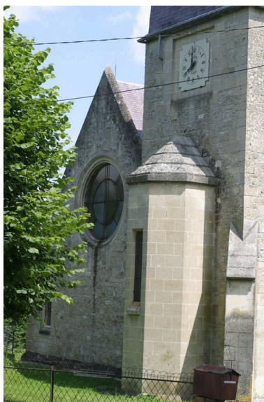
Vue de la façade ouest. IVR22_20030202865NUCA