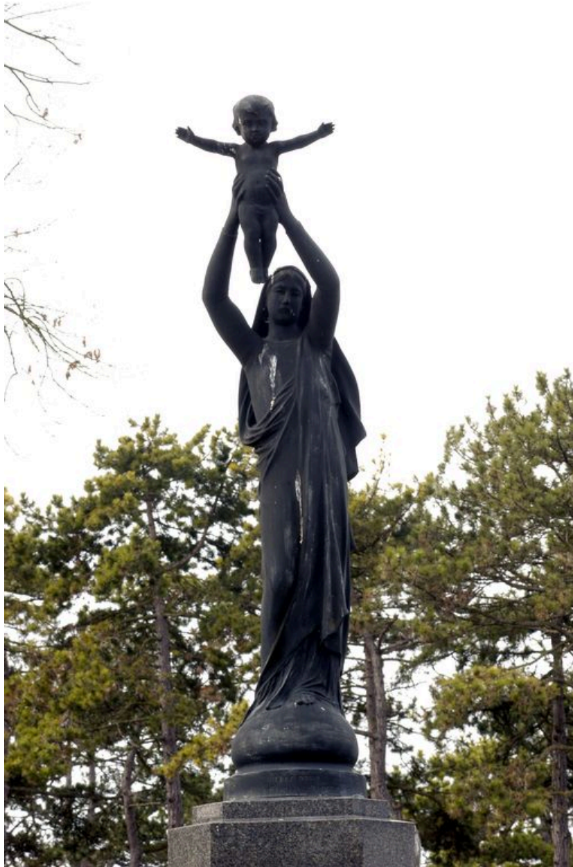
Vue de détail sur la statue (vue de face).