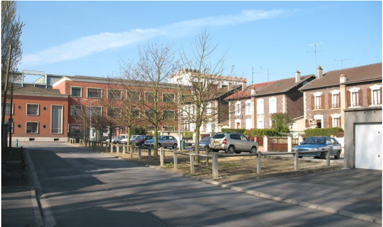
Bureaux de l'usine et cité Mertian.