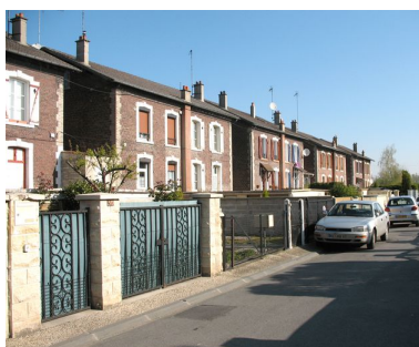
Barre de logements ouvriers de la cité Mertian. IVR22_20086005134NUCA