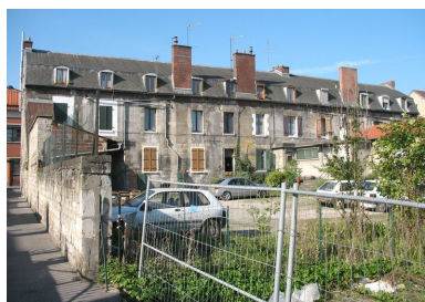
Maisons ouvrières construites en pierre le long de la rue Lénine et attenantes à la cité Mertian.