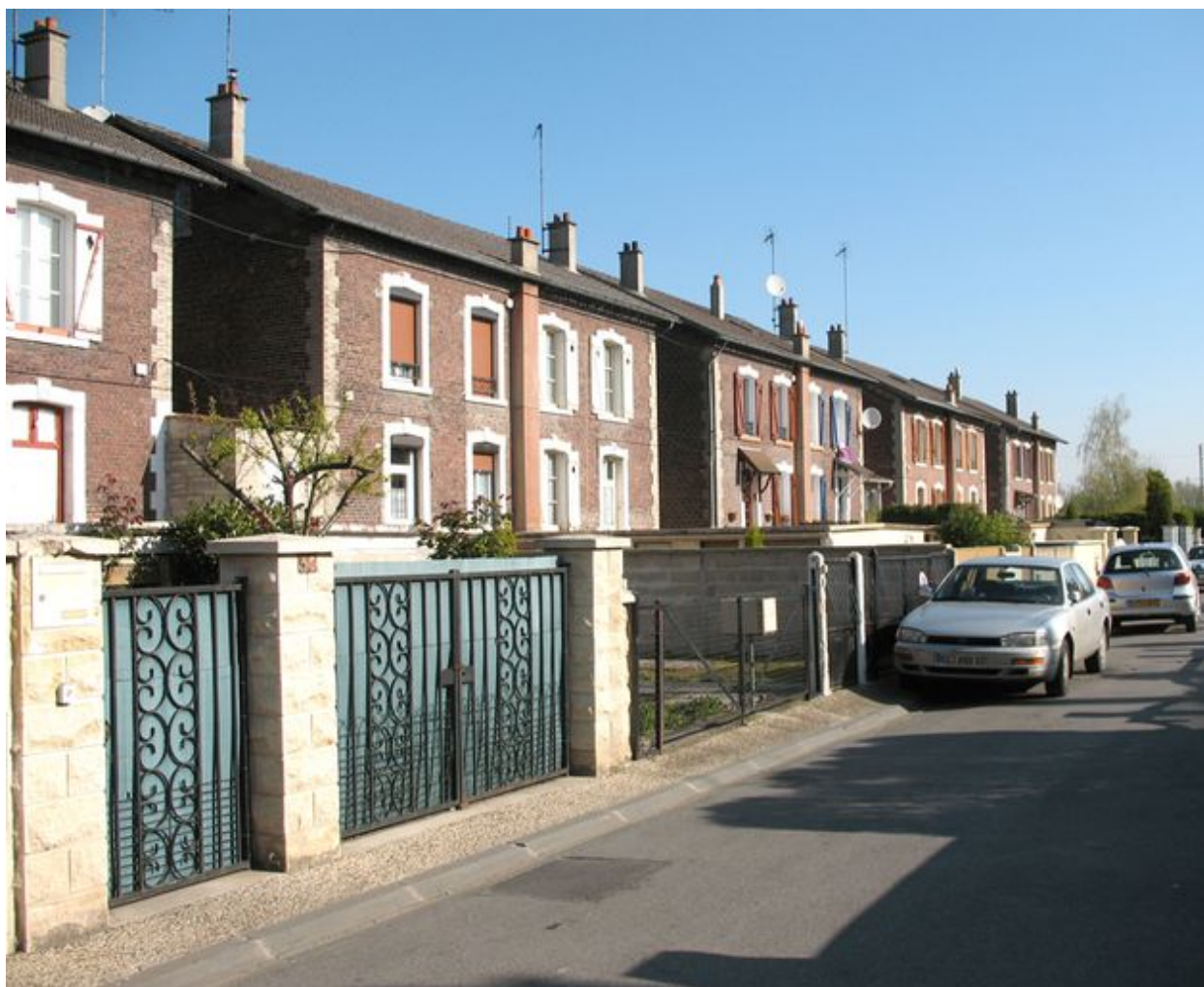
Barre de logements ouvriers de la cité Mertian.