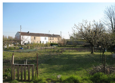
Barre de logements ouvriers construits en pierre.