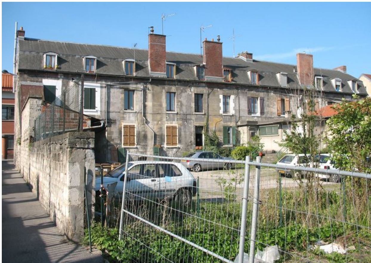
Maisons ouvrières construites en pierre le long de la rue Lénine et attenantes à la cité Mertian.