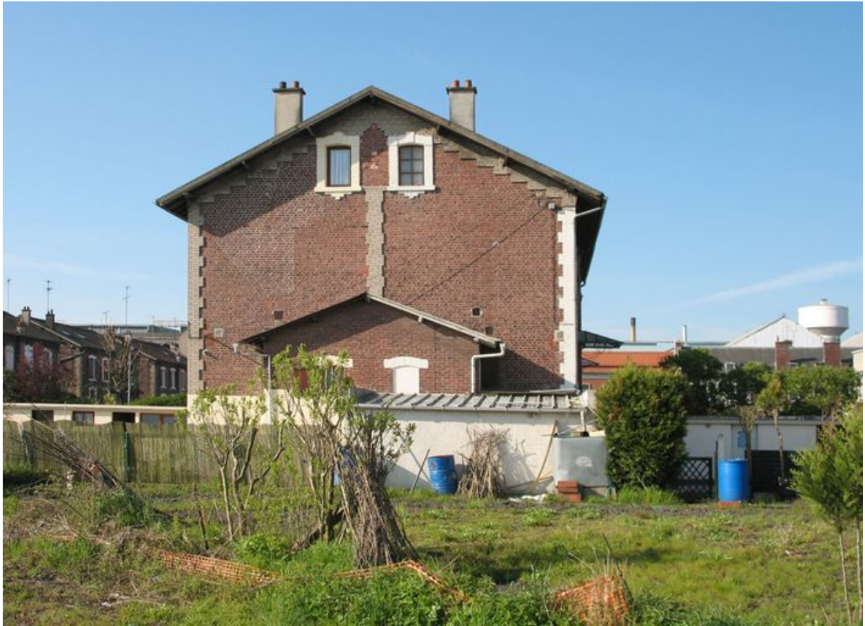
Mur pignon de deux logements de la cité Mertian.