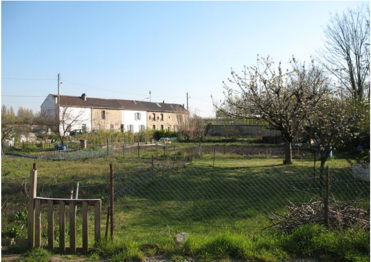
Barre de logements ouvriers construits en pierre.