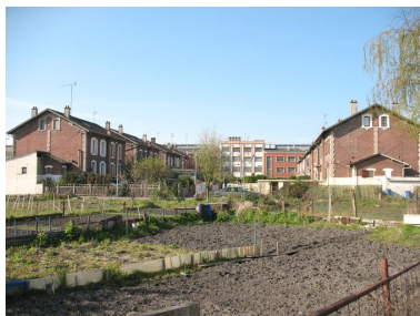
Vue générale des deux barres de logements ouvriers (48 habitations). IVR22_20086005128NUCA