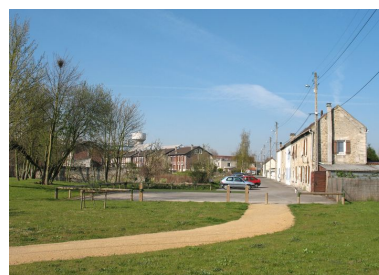
A droite : barre de 5 logements ouvriers en pierre, au centre le château d'eau de l'usine et à gauche un des barres de logements ouvriers en brique. IVR22_20086005135NUCA