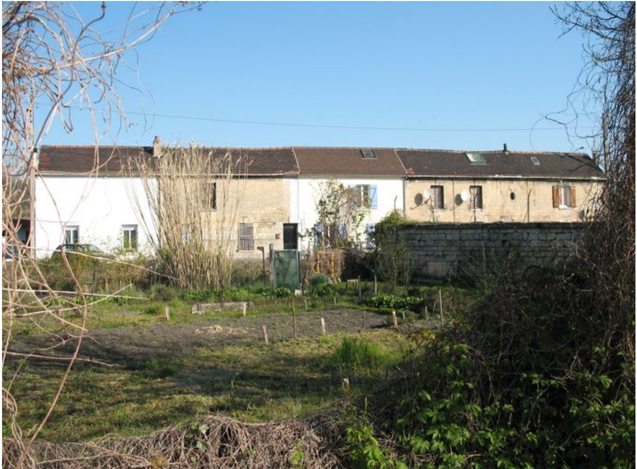
Vue rapprochée de la barre de logements.