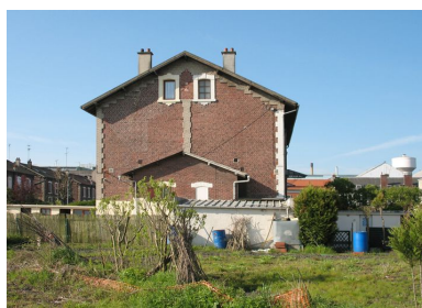
Mur pignon de deux logements de la cité Mertian. IVR22_20086005133NUCA