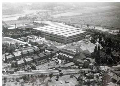
Vue aérienne de la société Usinor et de la cité Mertian, vers 1950.