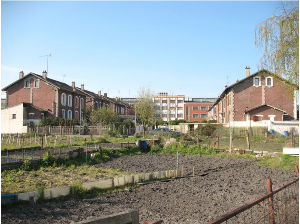
Vue générale des deux barres de logements ouvriers (48 habitations).