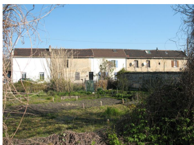
Vue rapprochée de la barre de logements. IVR22_20086005138NUCA