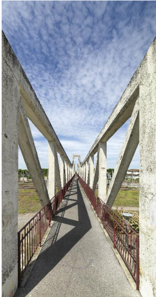
Vue générale depuis la passerelle.