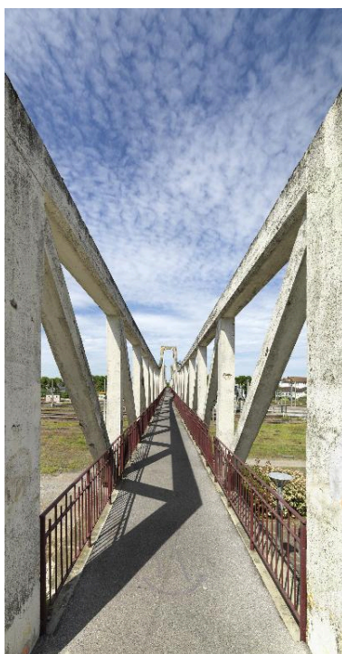
Vue générale depuis la passerelle. IVR32_20170200175NUC2AQ