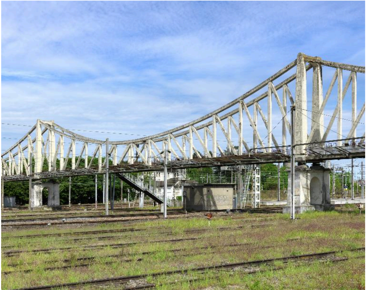
Vue du tablier central de la passerelle.