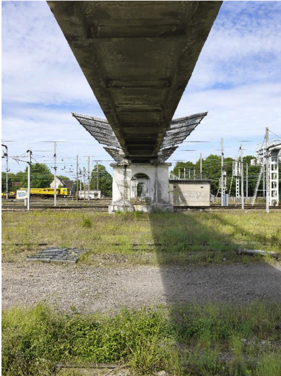
Dessous du tablier de la passerelle.