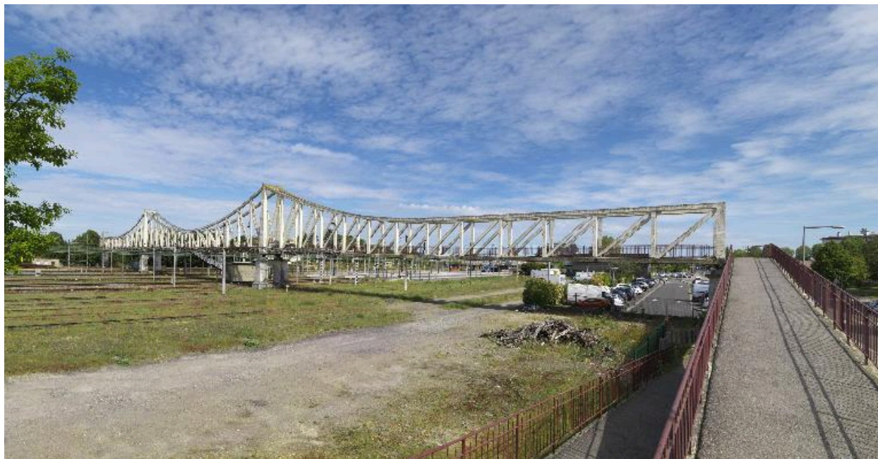
Vue générale depuis le sud.