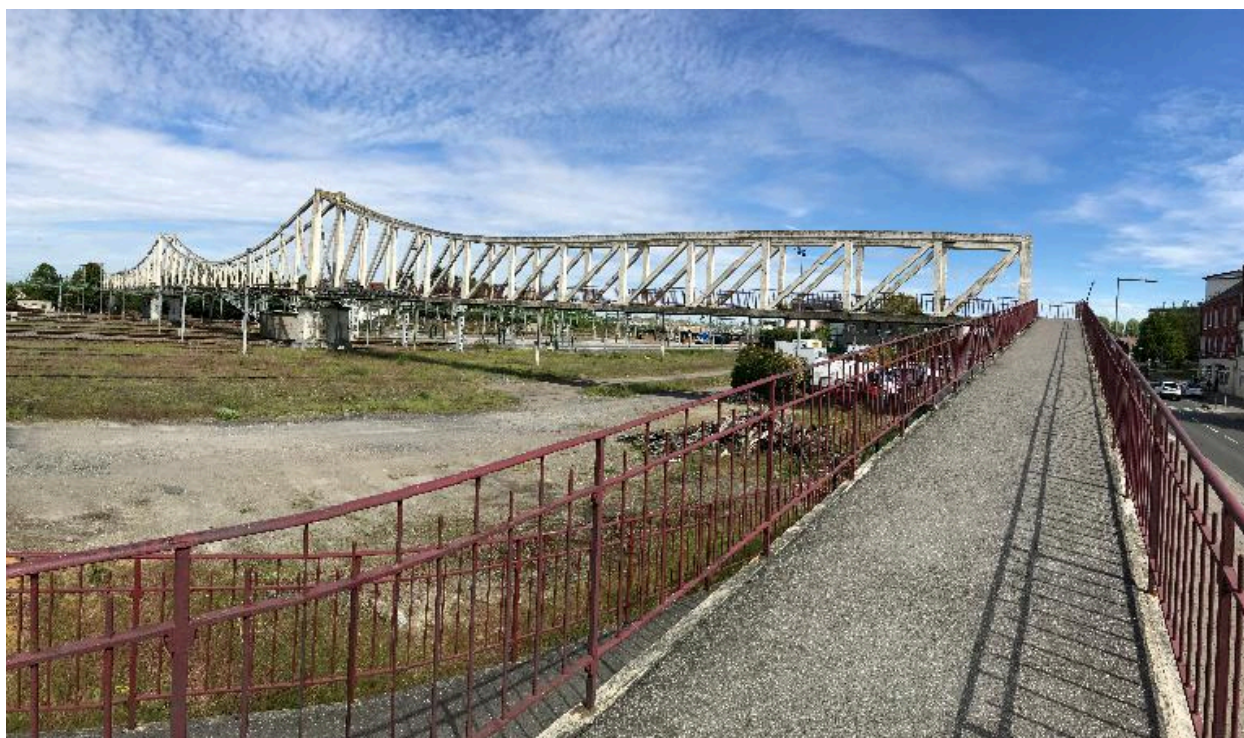
Rampe d'accès piéton à la passerelle.