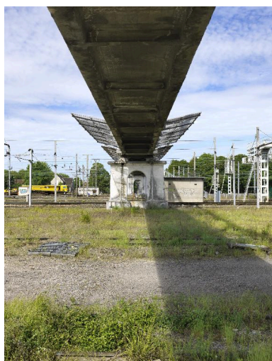
Dessous du tablier de la passerelle. IVR32_20170200174NUC2A