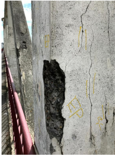
Epaufure du béton sur l'un des supports verticaux de la passerelle. IVR32_20170205226NUC2A