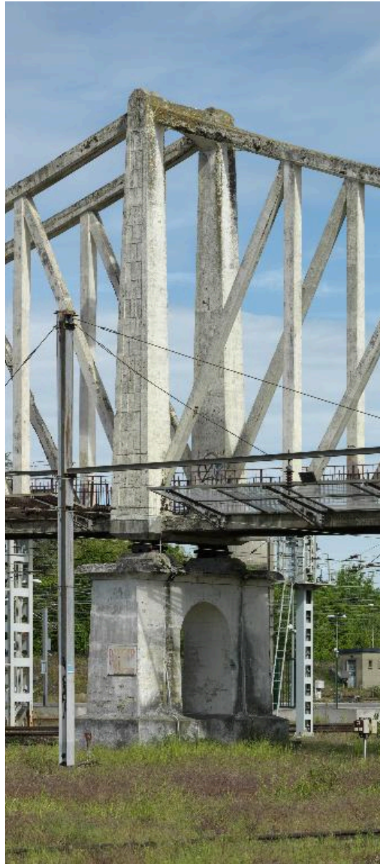
Détail d'un support de la passerelle.