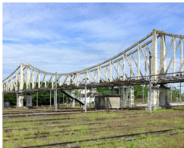
Vue du tablier central de la passerelle.