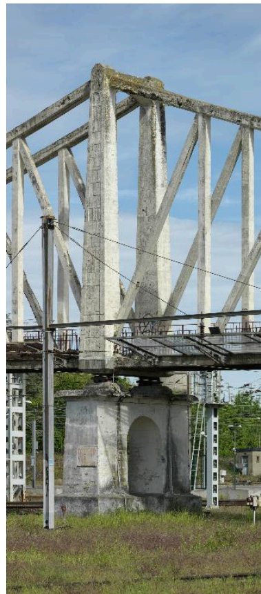
Détail d'un support de la passerelle.