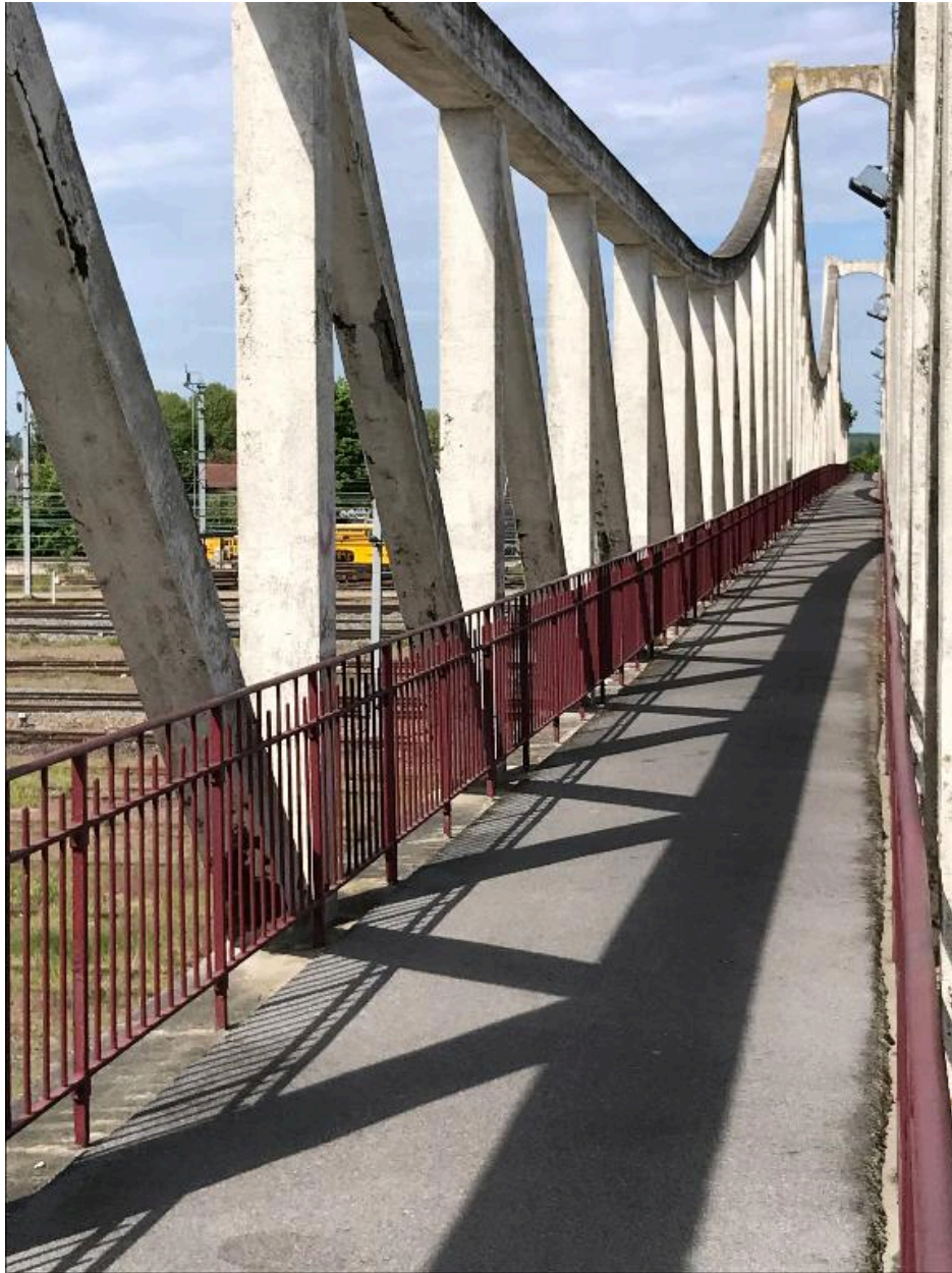
Vue générale de la passerelle.