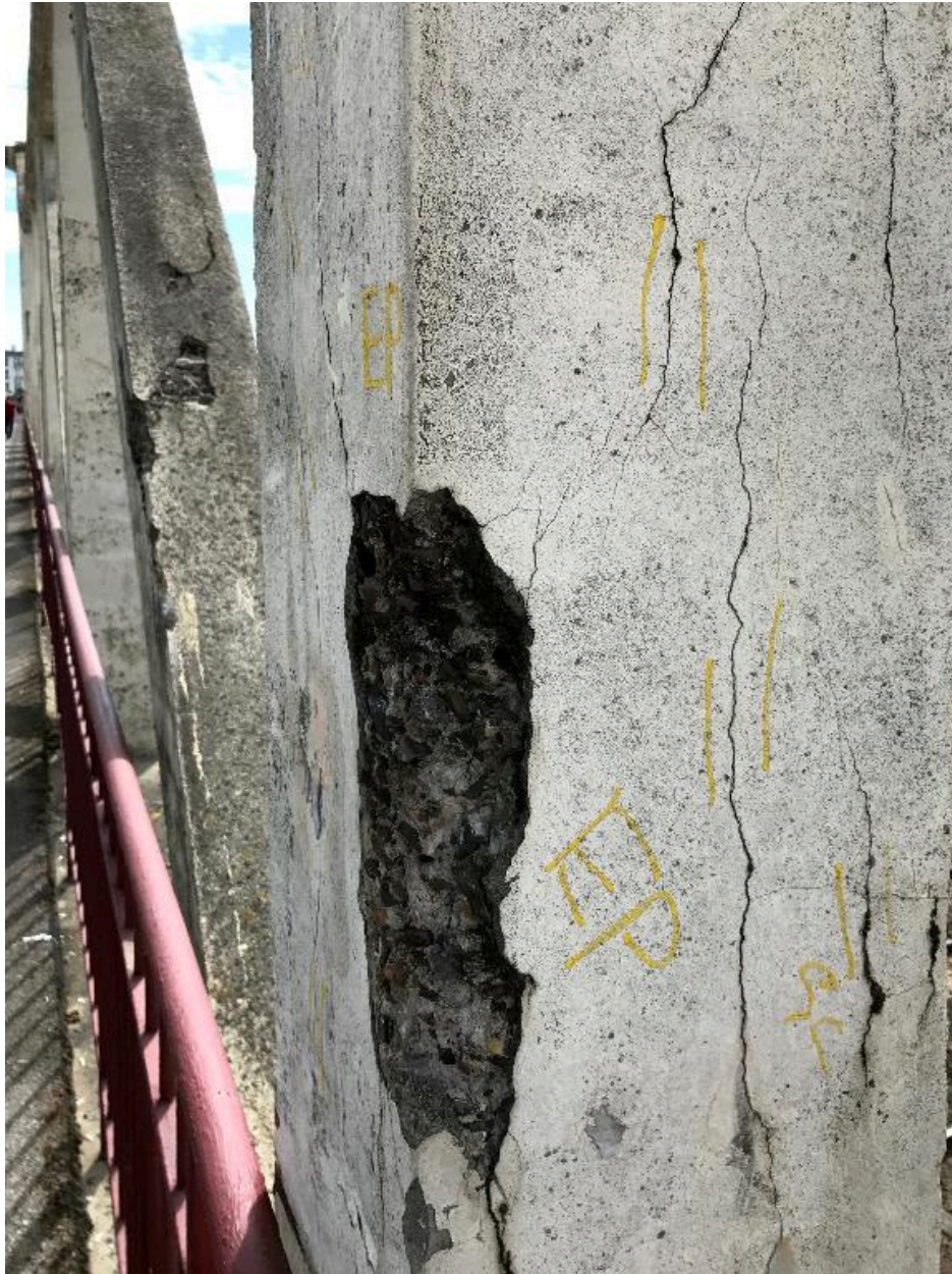
Epaufure du béton sur l'un des supports verticaux de la passerelle.