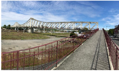
Rampe d'accès piéton à la passerelle.