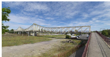
Vue générale depuis le sud. IVR32_20170200171NUC2AQ