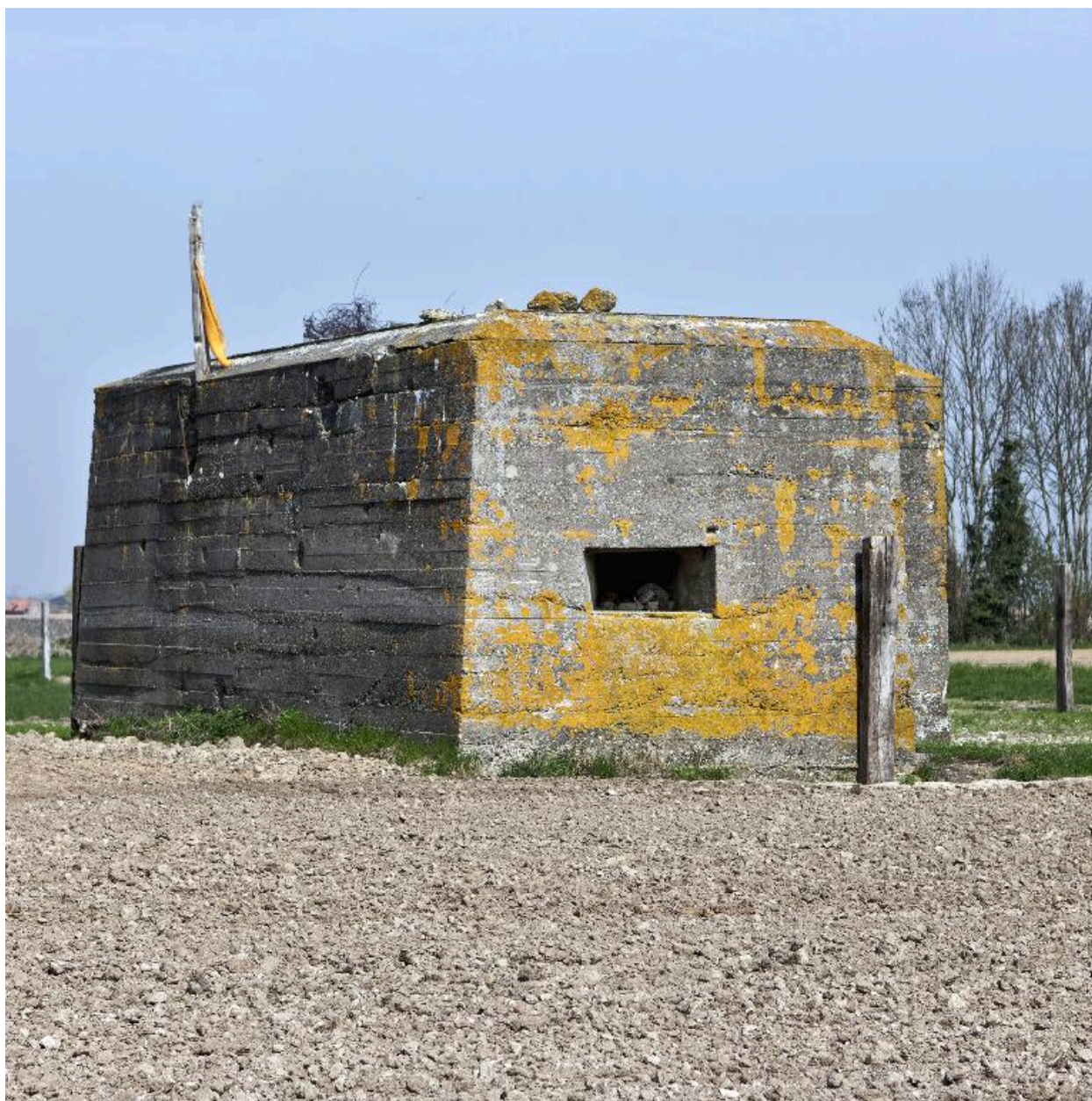
Elévations ouest et sud