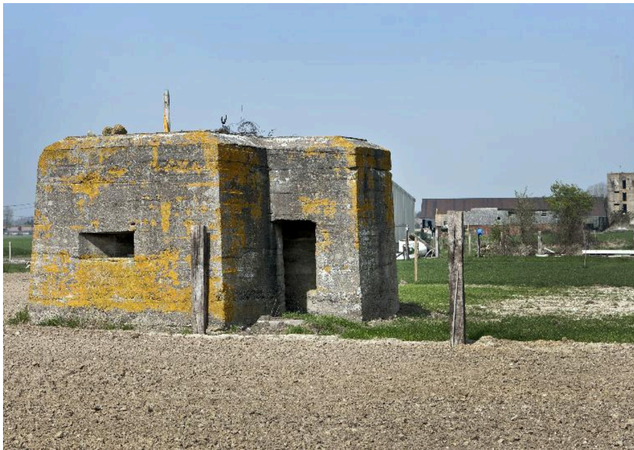
Vue générale vers le nord-ouest