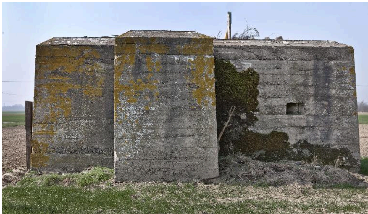
Vue vers l'ouest. Au premier plan le porche pare-souffle