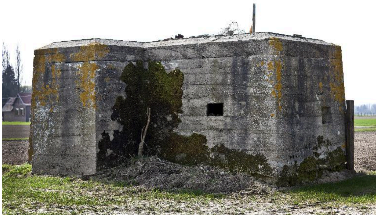
Vue vers le sud-ouest