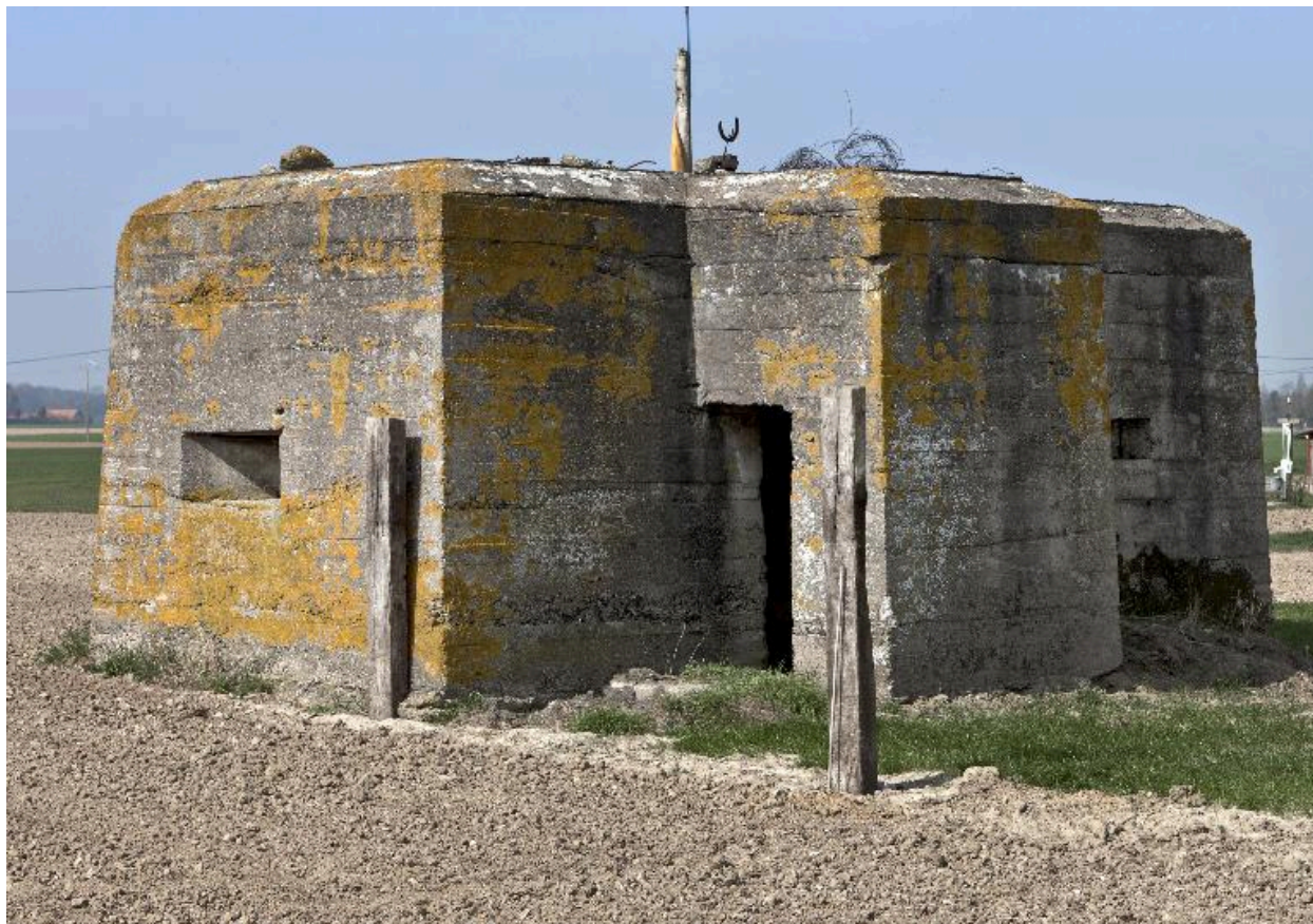
Vue vers le nord-ouest. L'entrée.