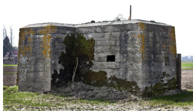
Vue vers le sud-ouest IVR31_20145904437NUCA

Plans (théoriques ?) en juin 1916, de sept stations de communication optique (2 à Fromelles, 2 à Le-Maisnil, 1 Aubers, 1 au lieu-dit Fresnoy (Beaucamps-Ligny) 1 au lieu-dit Desprez (Fournes-en-Weppes)) IVR32_20175900221NUCA