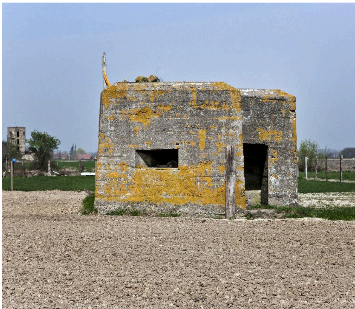
Elévation sud et le porche pare-souffle