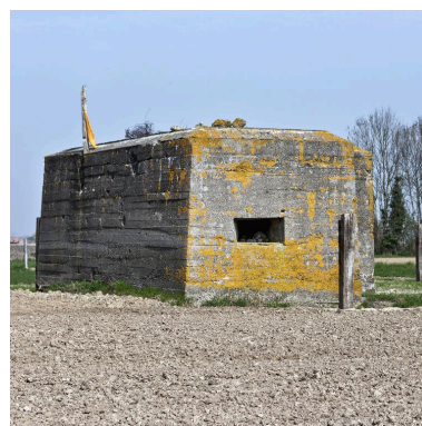
Elévations ouest et sud IVR31_20145904434NUCA