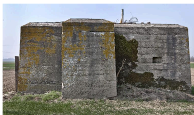
Vue vers l'ouest. Au premier plan le porche pare-suffle IVR31_20145904436NUCA