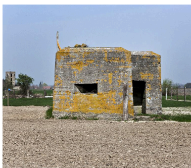
Elévation sud et le porche pare-suffle IVR31_20145904433NUCA