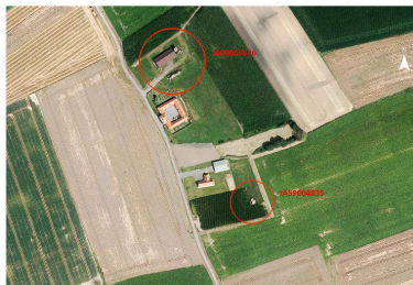
Position de l'édifice (ici en bas) sur une photographie aérienne de 2014 IVR32_20175900223NUCA

Plans (théoriques ?) en juin 1916, de sept stations de communication optique (2 à Fromelles, 2 à Le-Maisnil, 1 Aubers, 1 au lieu-dit Fresnoy (Beaucamps-Ligny) 1 au lieu-dit Desprez (Fournes-en-Weppes)) IVR32_20175900221NUCA