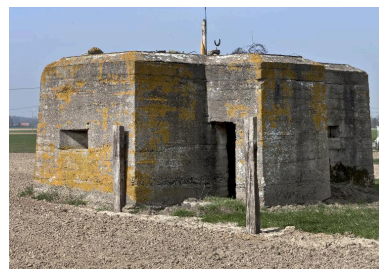
Vue vers le nord-ouest. L'entrée. IVR31_20145904435NUCA