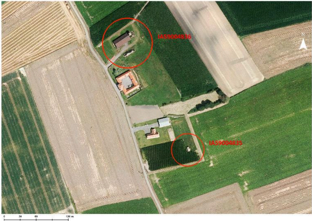
Position de l'édifice (ici en bas) sur une photographie aérienne de 2014