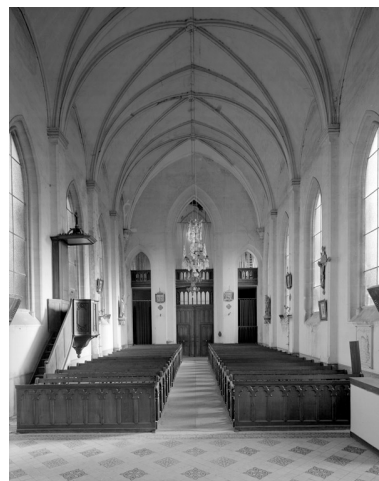
Vue intérieure, depuis le chœur. IVR22_19978000040V