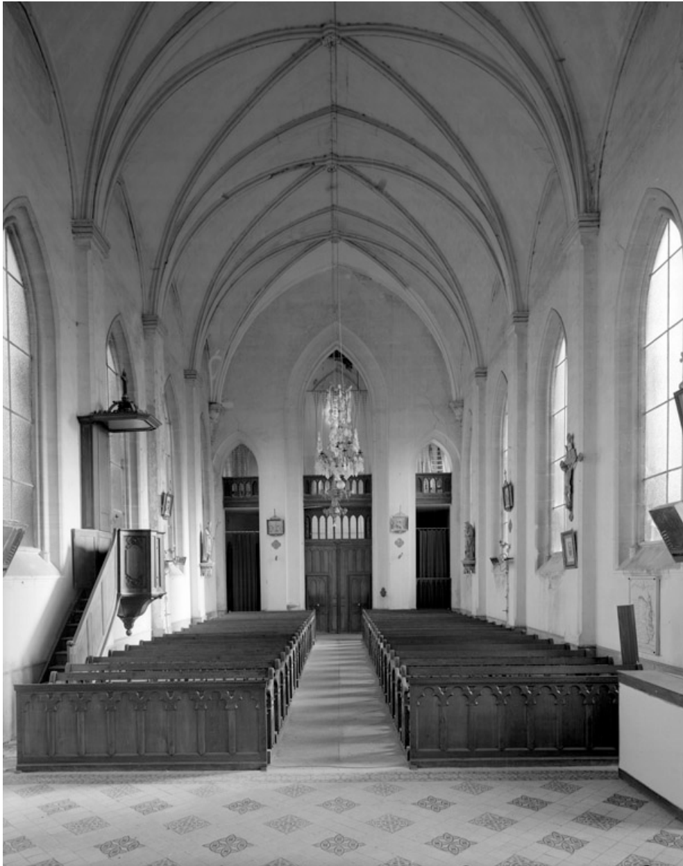
Vue intérieure, depuis le chœur.