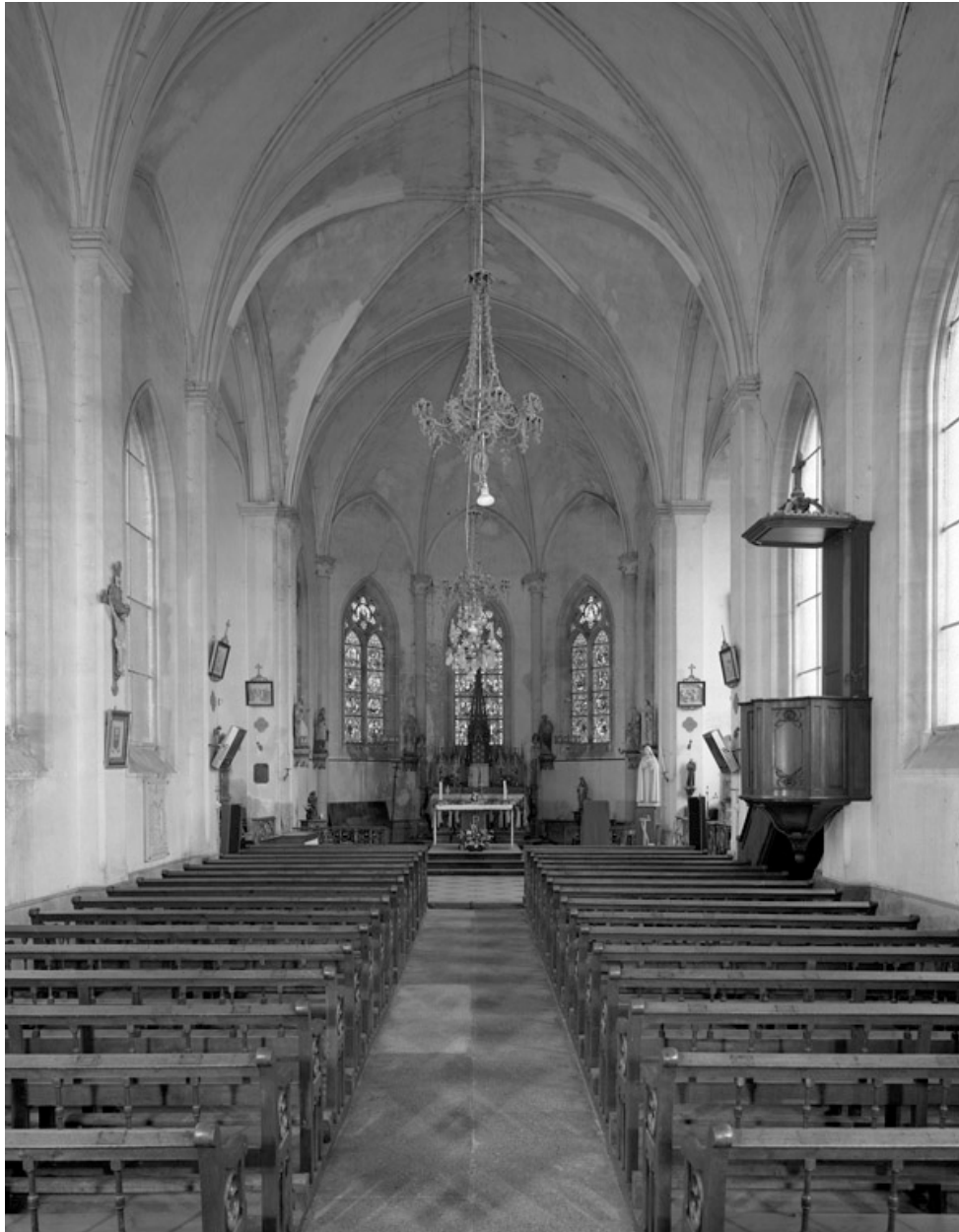
Vue intérieure, vers le chœur.