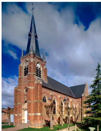
Façade antérieure et latérale est. IVR22_19978000100VA