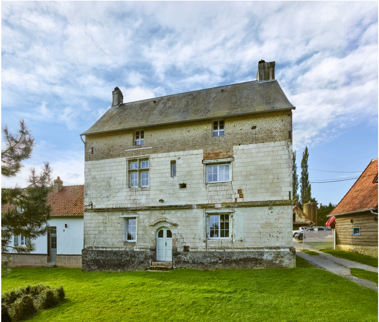
Façade nord du manoir.