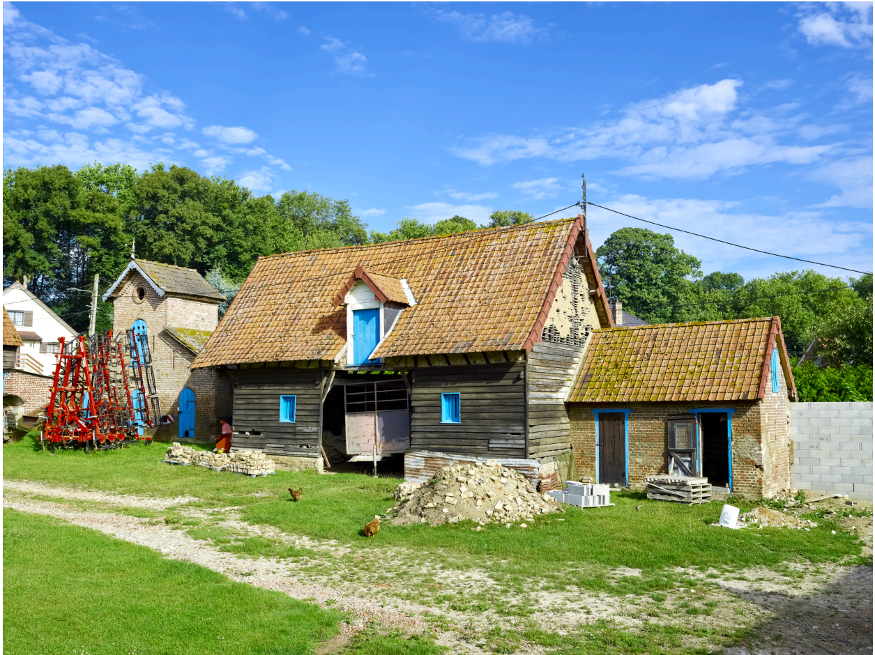
Vue de la bergerie, depuis le sud-est.