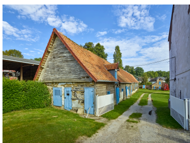
Vue de l'entrée de la cour, depuis le sud. IVR32_20248001106NUCA