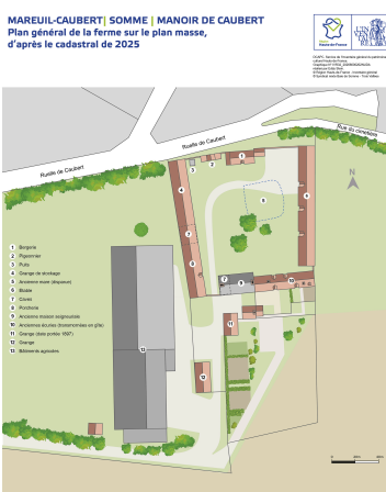
Plan général du manoir de Caubert, destination des bâtiments.

Repro. Archives départementales de la Somme IVR32_20248005483NUCA