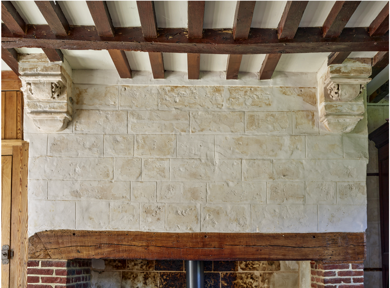
Détail de la hotte de la cheminée du manoir.