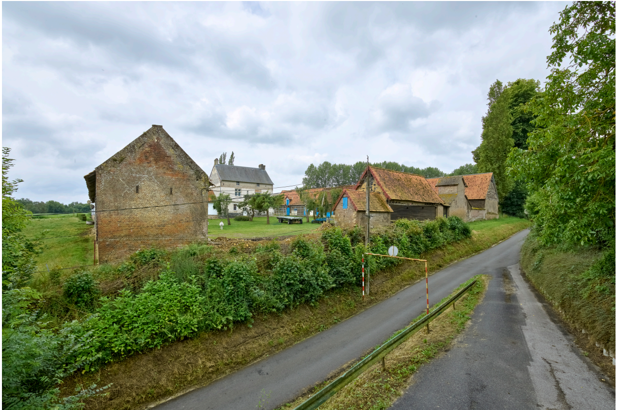
Vue d'ensemble de la ferme, depuis l'entrée du cimetière au nord.