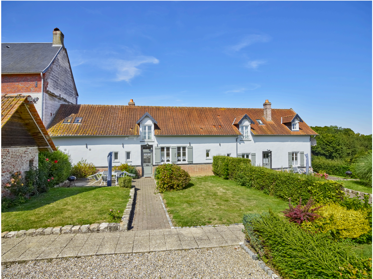
Vue des anciennes écuries, depuis le sud.