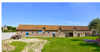
Vue des étables, depuis l'ouest.