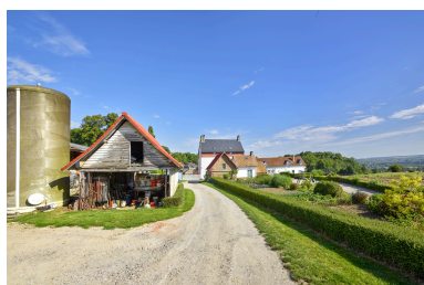
Vue de l'entrée de la ferme, depuis le sud.

IVR32_20248001098NUCA