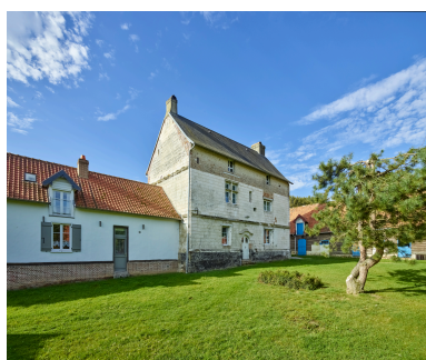
Façade nord du manoir et ancienne écurie.

Phot. Thierry Lefébure IVR32_20248001101NUCA