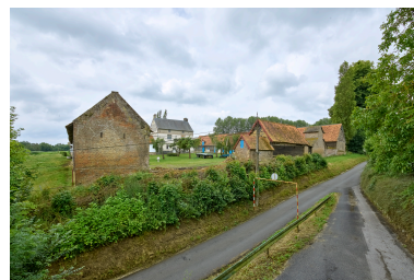
Vue d'ensemble de la ferme, depuis l'entrée du cimetière au nord.

IVR32_20248001098NUCA