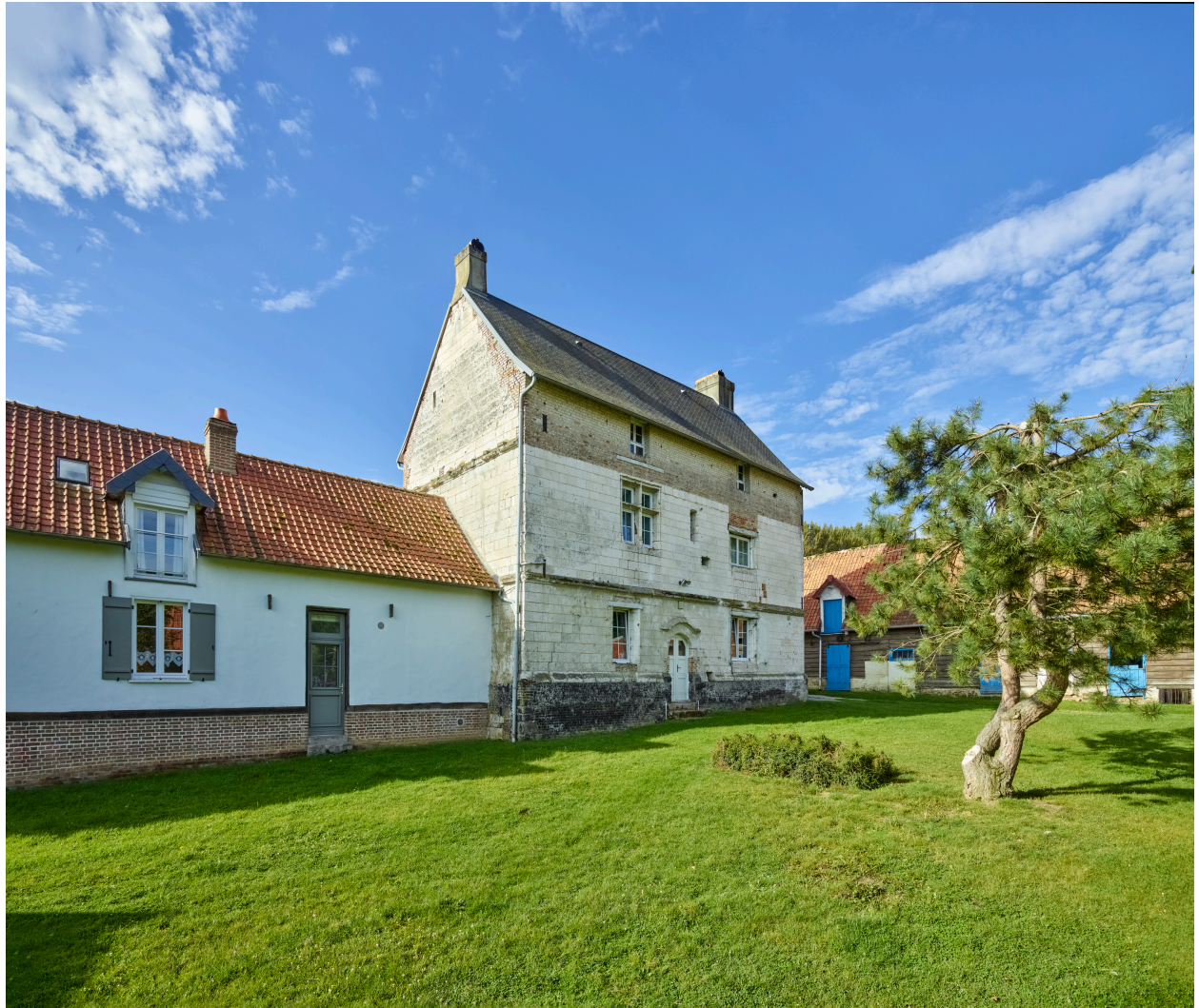
Façade nord du manoir et ancienne écurie.