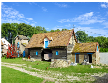
Vue de la bergerie, depuis le sud-est. IVR32_20248001119NUCA