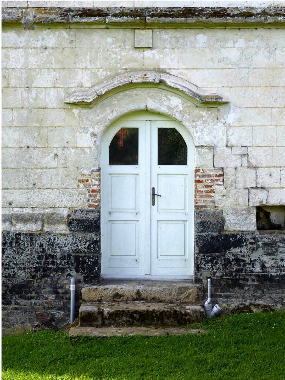
Détail de la porte de la façade nord du manoir.