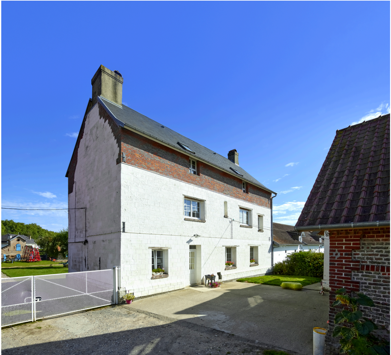
Façade sud du manoir.