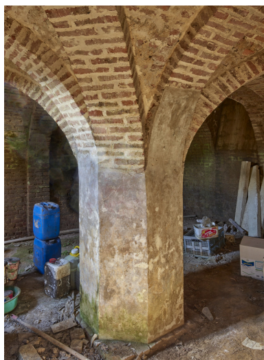
Cave sous l'étable. IVR32_20248001115NUCA