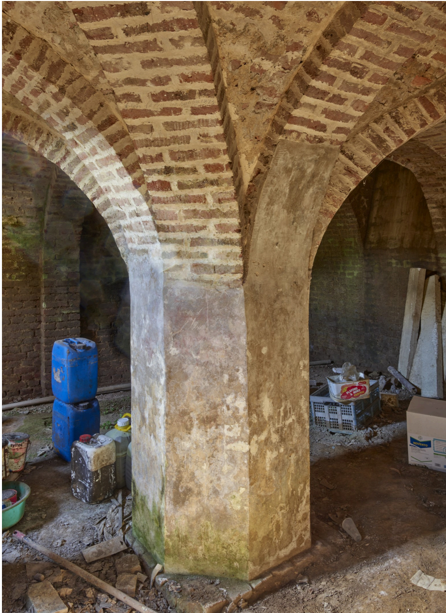
Cave sous l'étable.