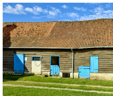
Détail des ouvertures de l'ancienne étable à cochons ou grange, depuis l'est.