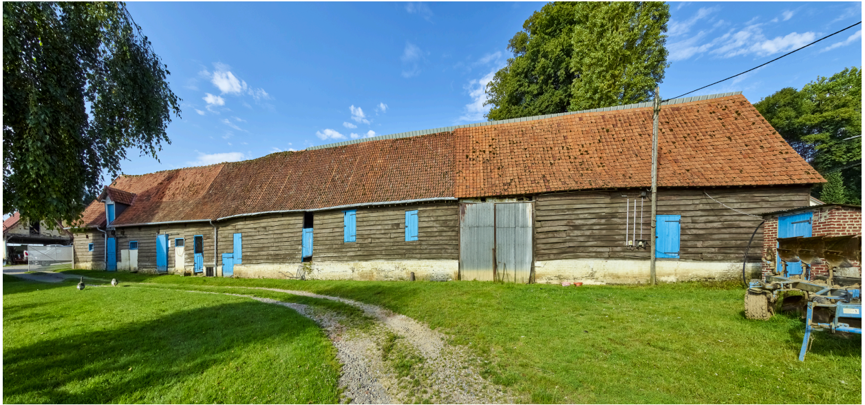
Vue de l'ancienne étable à cochons ou grange, depuis l'est.