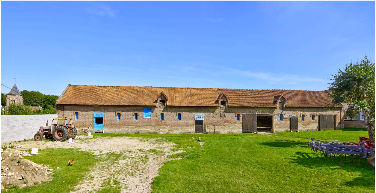
Vue des étables, depuis l'ouest.