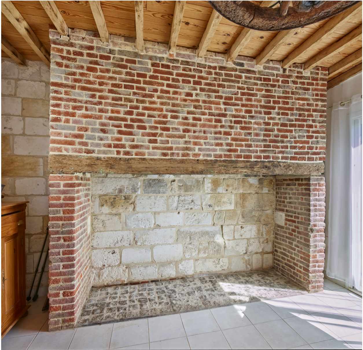
Cheminée du bâtiment au sud du manoir.