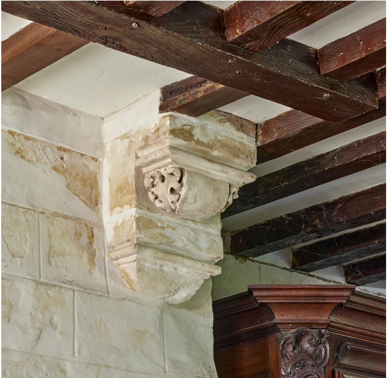
Détail d'un des corbeaux de la cheminée du manoir.