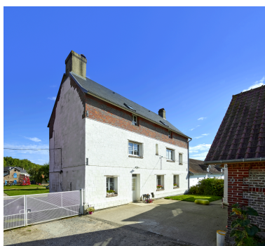
Façade sud du manoir.

Phot. Thierry Lefébure IVR32_20248001134NUCA