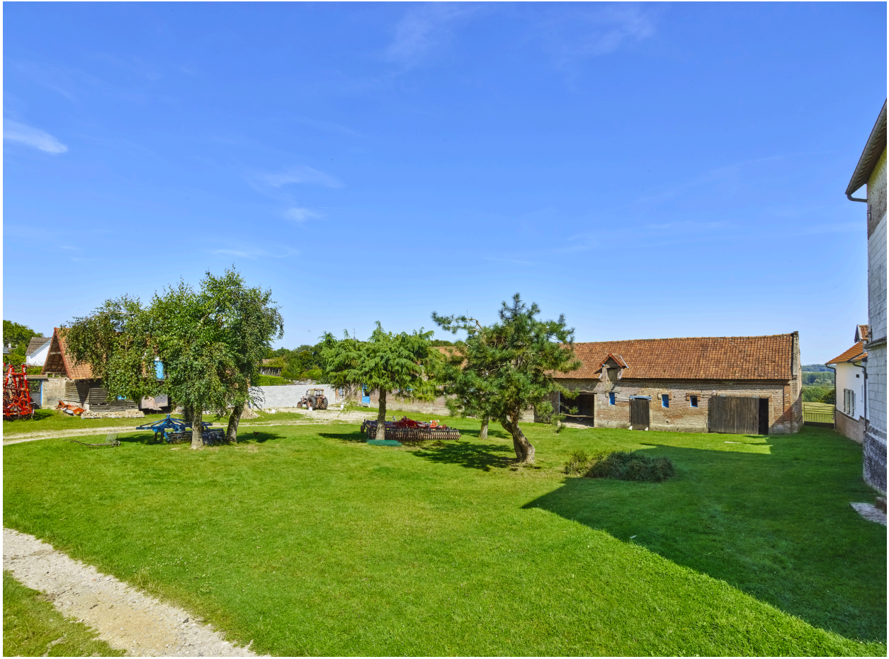
Vue d'ensemble de la cour, depuis l'entrée.