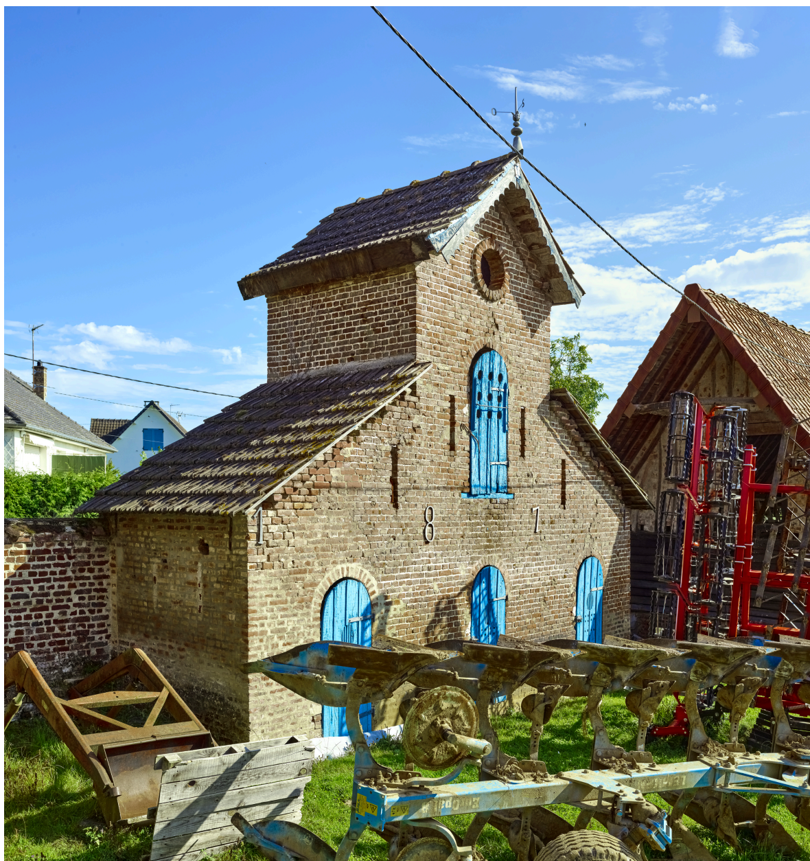
Vue du pigeonnier, depuis le sud.