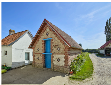
Grange au sud du manoir, depuis le nord. IVR32_20248001129NUCA