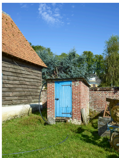
Vue du puits, depuis le sud. IVR32_20248001121NUCA