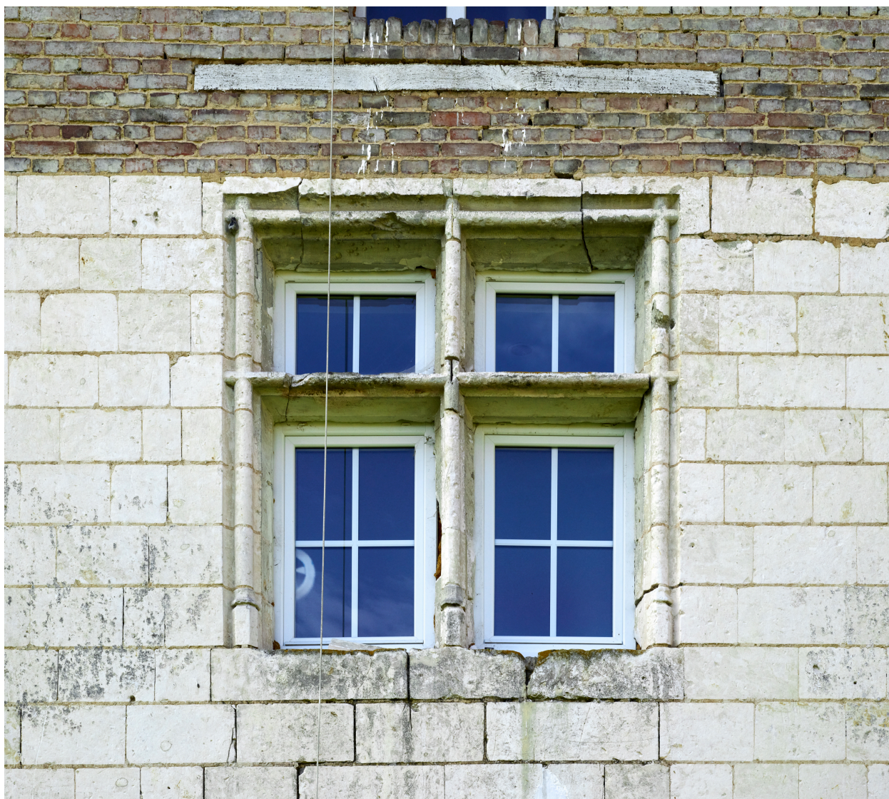
Détail de la fenêtre à meneau de la façade nord du manoir.