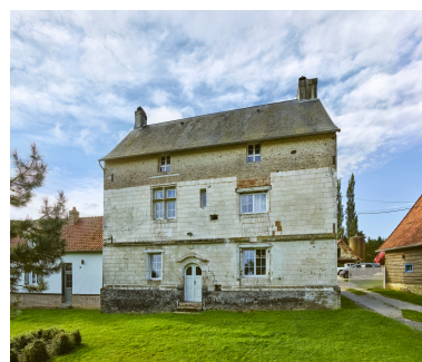
Façade nord du manoir.

Phot. Thierry Lefébure IVR32_20248001099NUCA