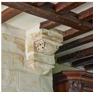
Détail d'un des corbeaux de la cheminée du manoir. IVR32_20248001128NUCA