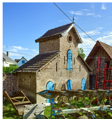
Vue du pigeonnier, depuis le sud. IVR32_20248001120NUCA