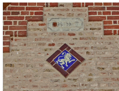
Date portée sur la grange au sud du manoir.