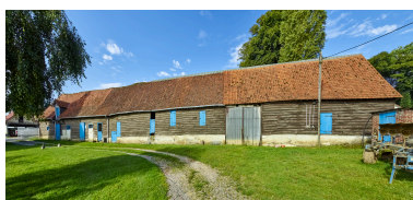
Vue de l'ancienne étable à cochons ou grange, depuis l'est.