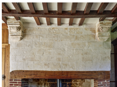
Détail de la hotte de la cheminée du manoir.