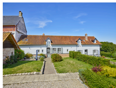
Vue des anciennes écuries, depuis le sud.