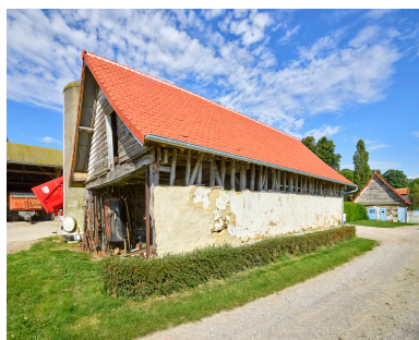
Vue de la charreterie, depuis le sud-est. IVR32_20248001133NUCA