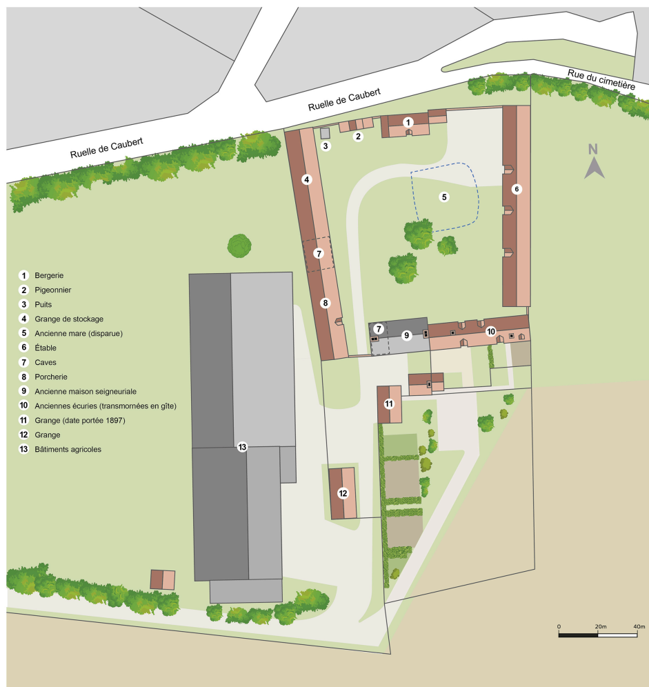
Plan général du manoir de Caubert, destination des bâtiments.

DCAPC - Service de l'inventaire général du patrimoine culturel Hauts-de-France. Graphique N° IVR32_20268000202NUDA réalisé par Eddy Stein