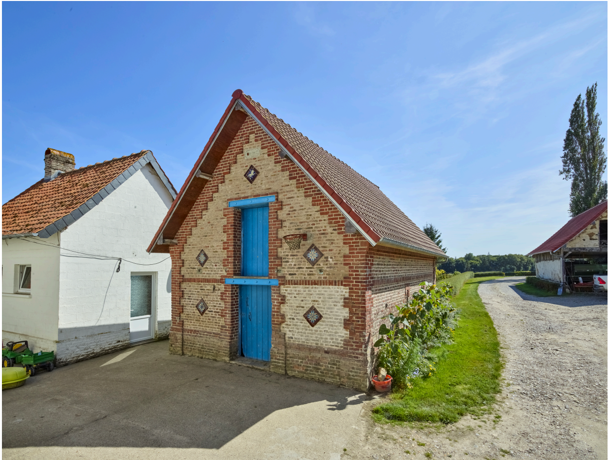
Grange au sud du manoir, depuis le nord.