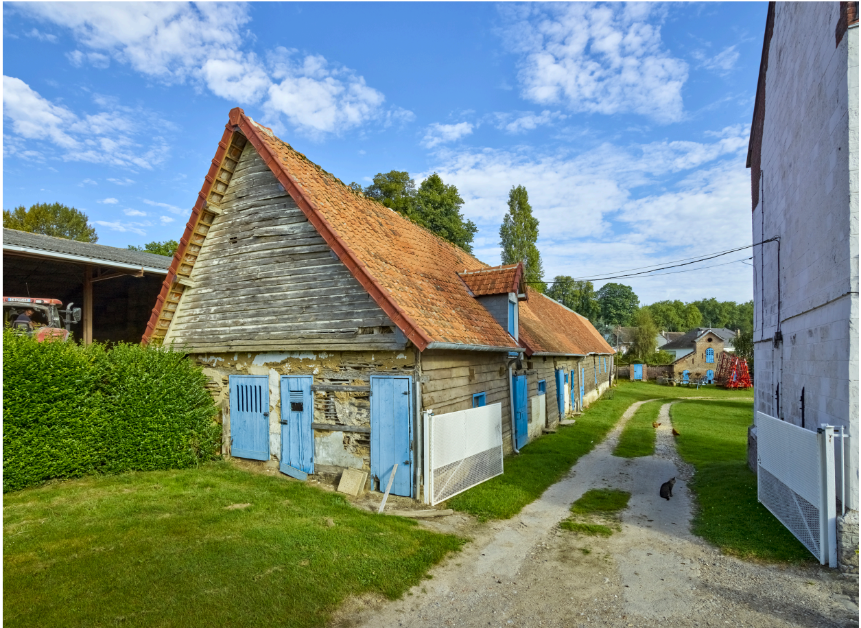
Vue de l'entrée de la cour, depuis le sud.