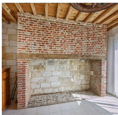
Cheminée du bâtiment au sud du manoir.