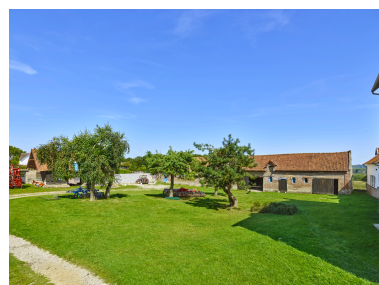
Vue d'ensemble de la cour, depuis l'entrée. IVR32_20248001122NUCA