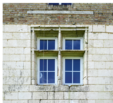
Détail de la fenêtre à meneau de la façade nord du manoir.

IVR32_20248005482NUCA