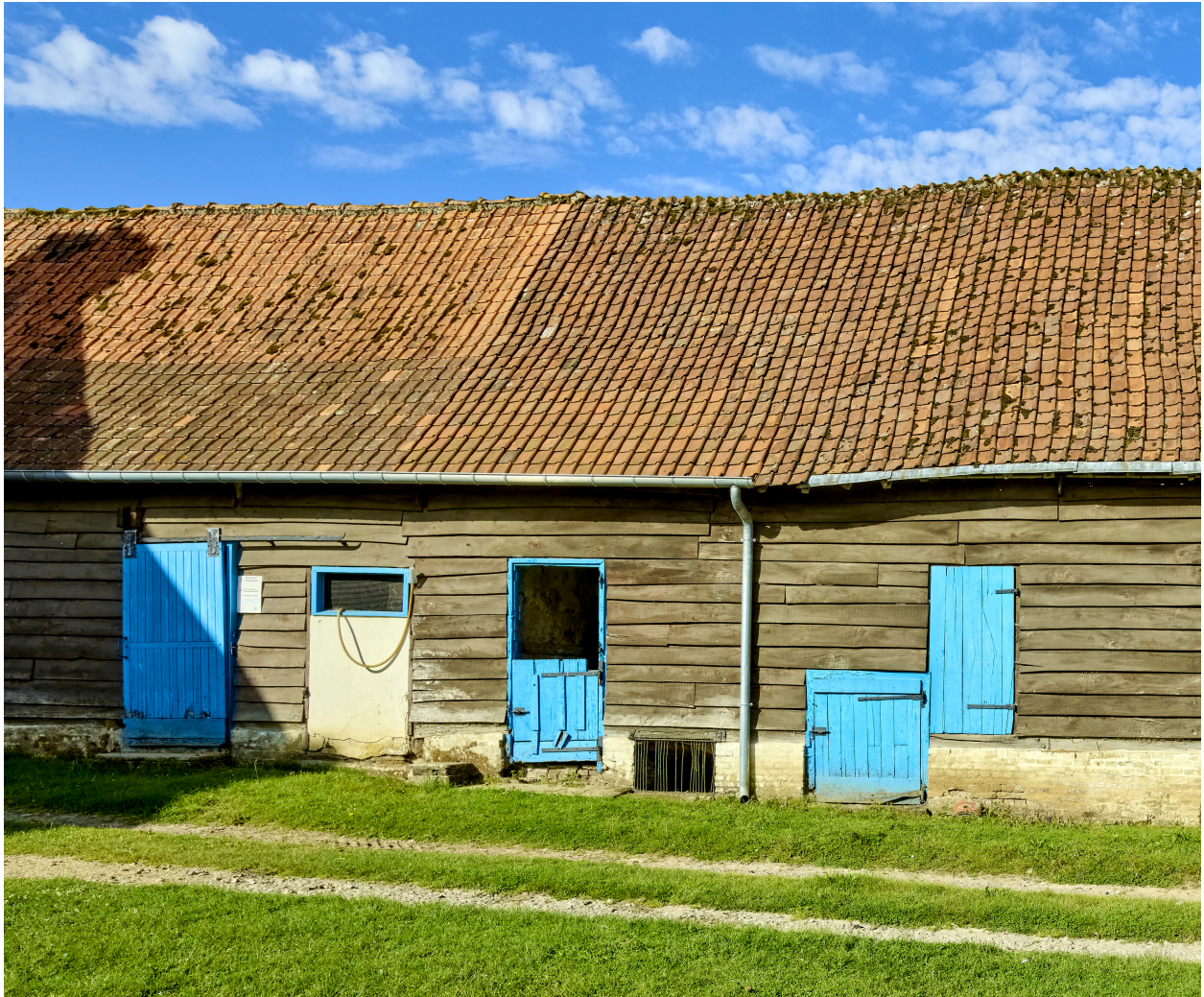
Détail des ouvertures de l'ancienne étable à cochons ou grange, depuis l'est.