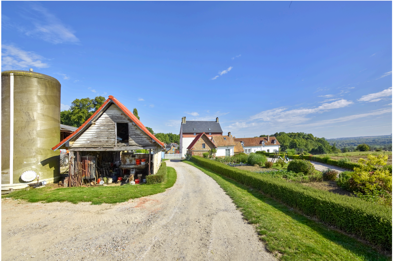
Vue de l'entrée de la ferme, depuis le sud.