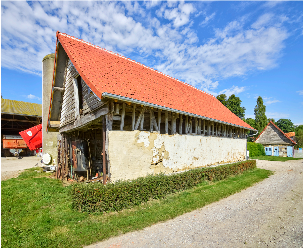
Vue de la charreterie, depuis le sud-est.