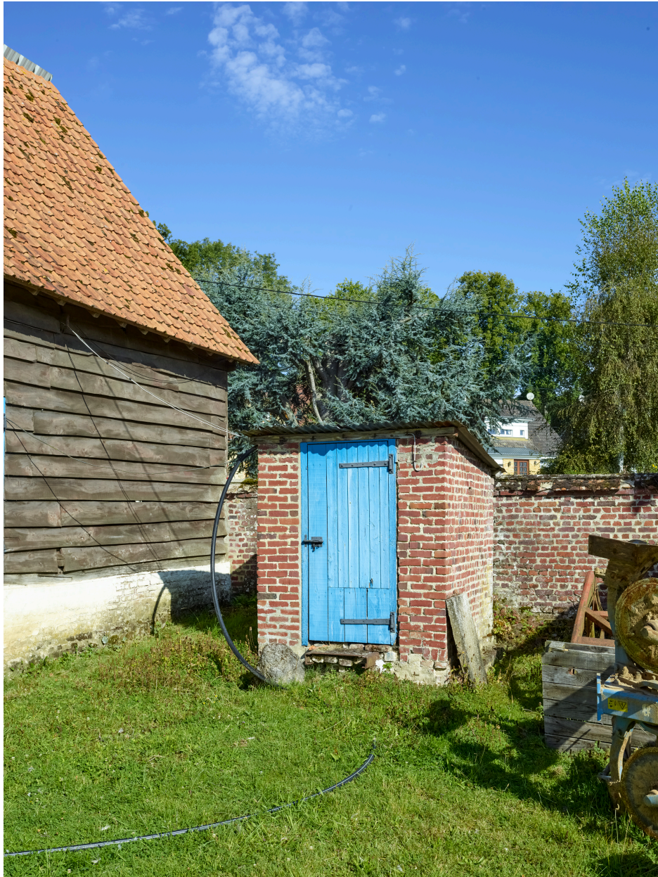
Vue du puits, depuis le sud.