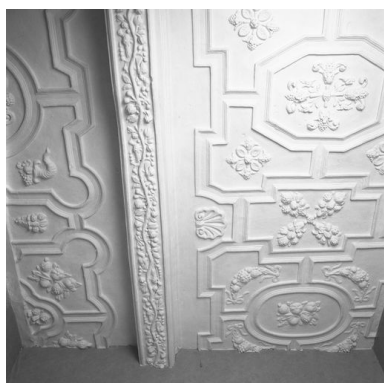
Vue partielle du plafond coupé par le cloisonnement en logements (ici, n° 37 rue de la Cavalerie).