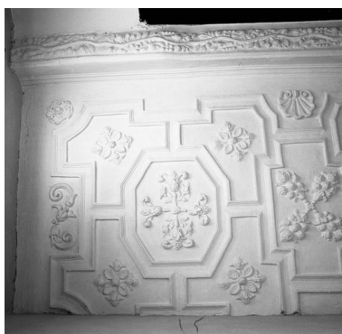
Vue partielle du plafond coupé par le cloisonnement en logements (ici, n° 37 rue de la Cavalerie).