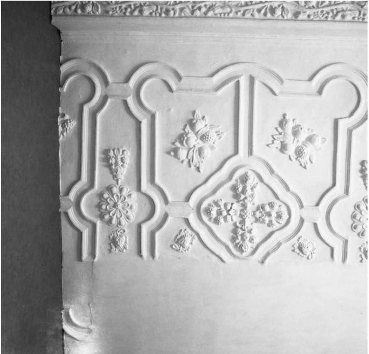
Vue partielle du plafond coupé par le cloisonnement en logements (ici, n° 37 rue de la Cavalerie).