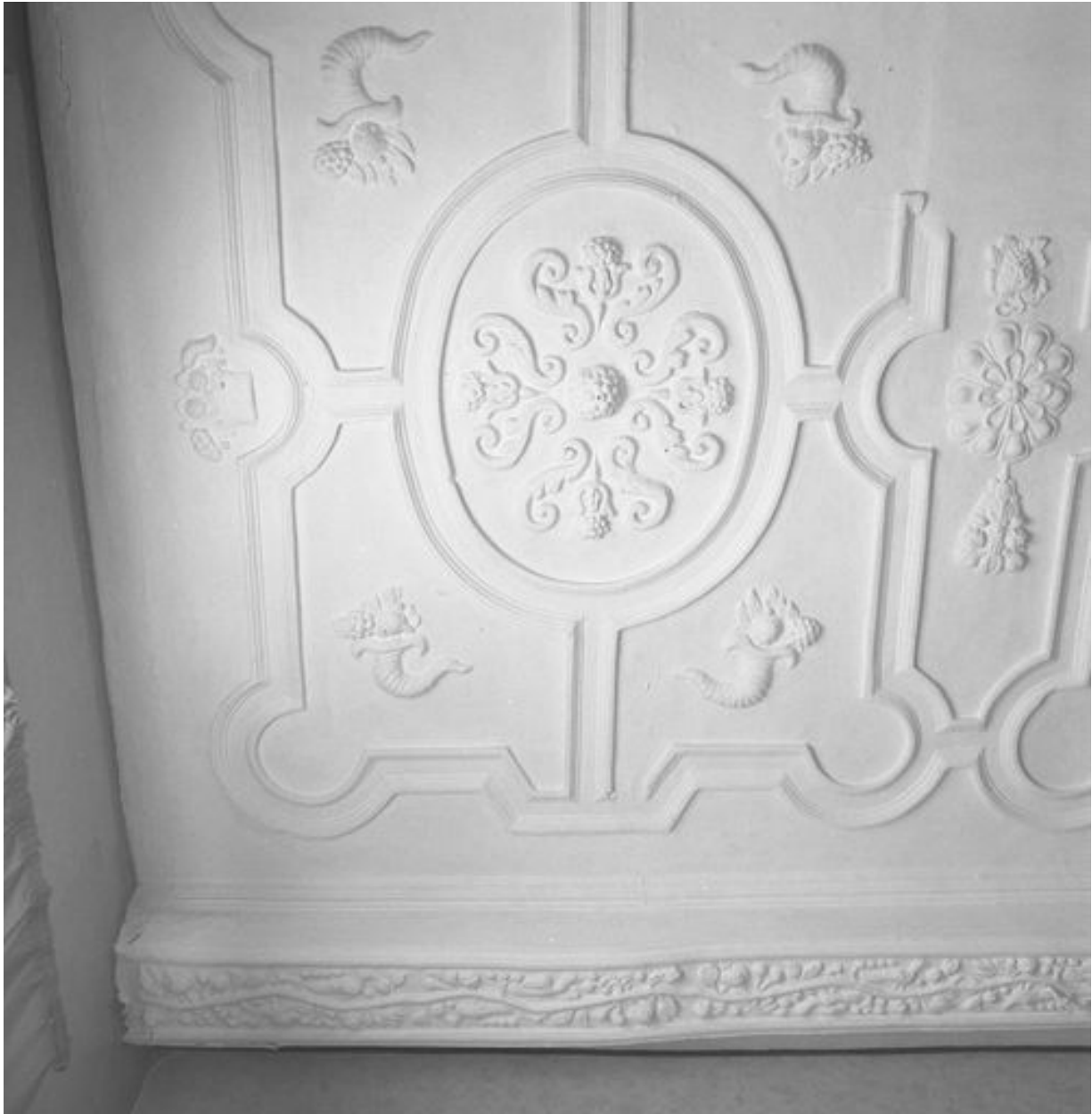
Vue partielle du plafond coupé par le cloisonnement en logements (ici, n° 37 rue de la Cavalerie).