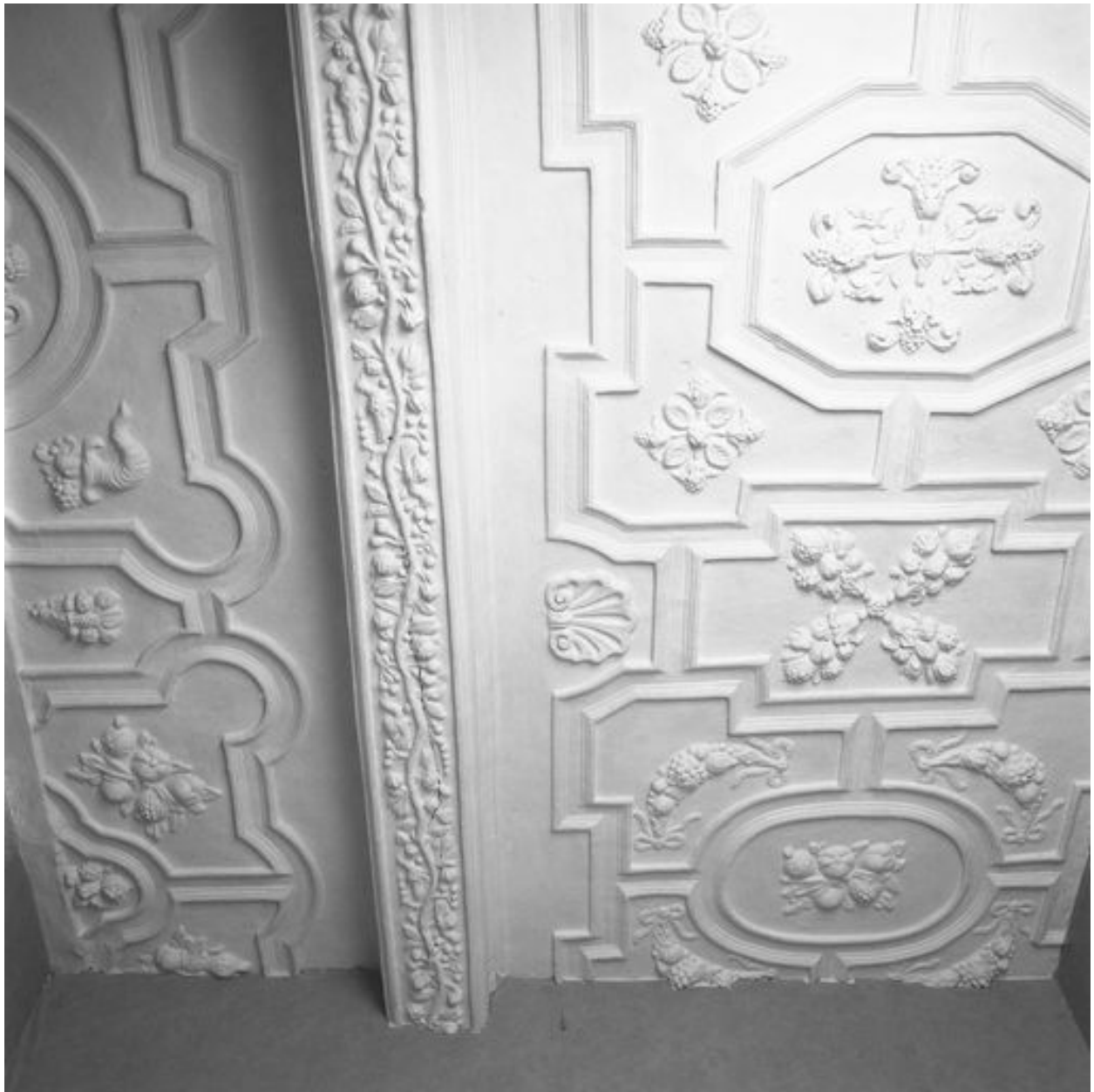
Vue partielle du plafond coupé par le cloisonnement en logements (ici, n° 37 rue de la Cavalerie).