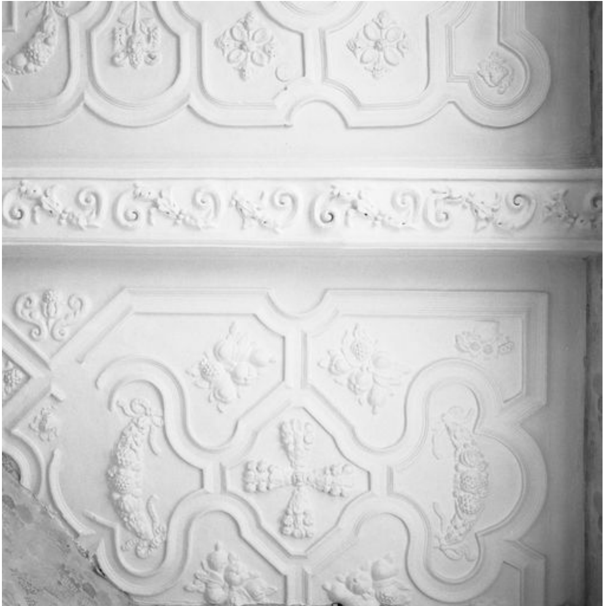
Vue partielle du plafond coupé par le cloisonnement en logements (ici, n° 35 rue de la Cavalerie).