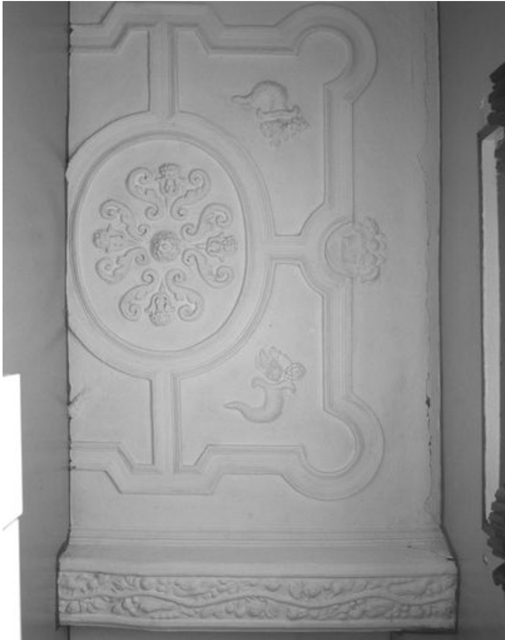
Vue partielle du plafond coupé par le cloisonnement en logements (ici, n° 37 rue de la Cavalerie).