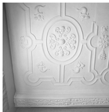
Vue partielle du plafond coupé par le cloisonnement en logements (ici, n° 37 rue de la Cavalerie).