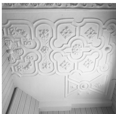
Vue partielle du plafond coupé par le cloisonnement en logements (ici, n° 35 rue de la Cavalerie).