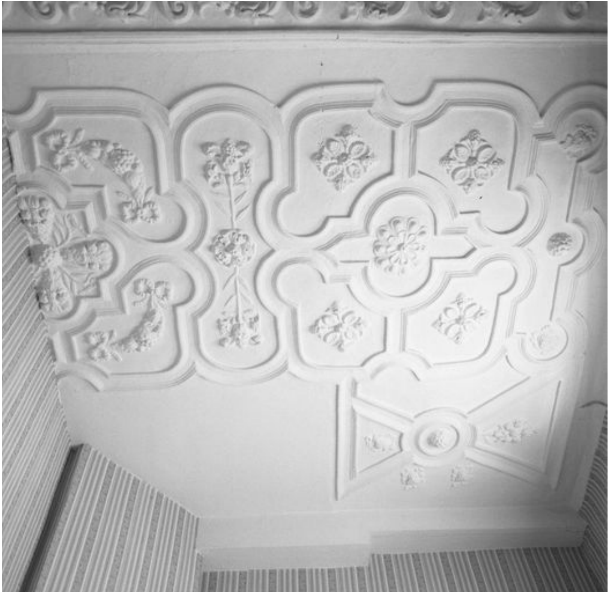
Vue partielle du plafond coupé par le cloisonnement en logements (ici, n° 35 rue de la Cavalerie).