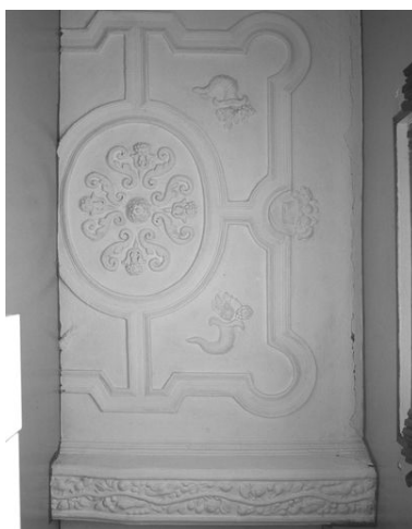
Vue partielle du plafond coupé par le cloisonnement en logements (ici, n° 37 rue de la Cavalerie).