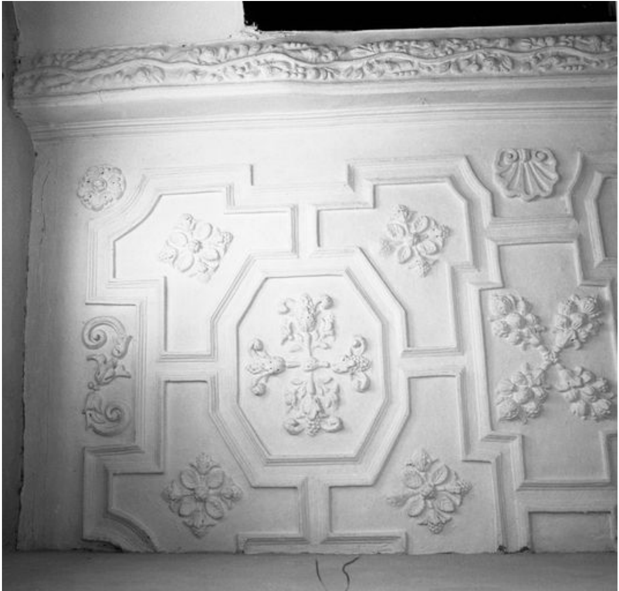
Vue partielle du plafond coupé par le cloisonnement en logements (ici, n° 37 rue de la Cavalerie).