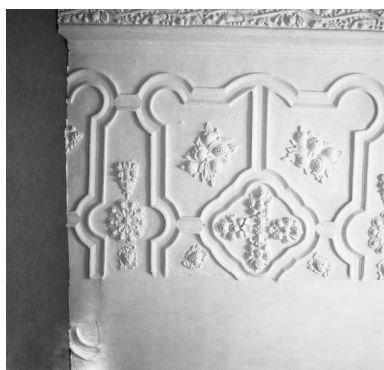
Vue partielle du plafond coupé par le cloisonnement en logements (ici, n° 37 rue de la Cavalerie).