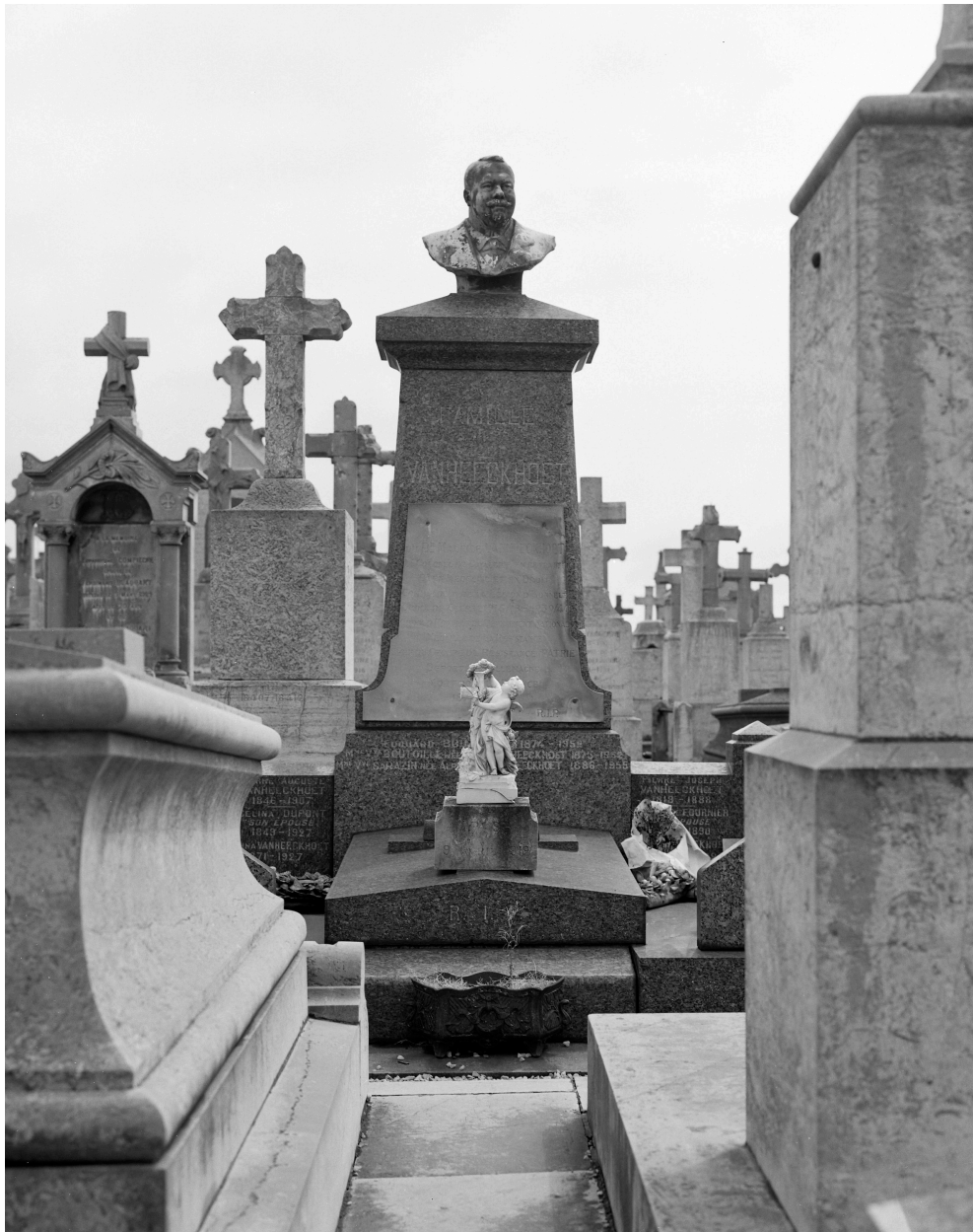
Tombeau de la famille Vanheeckhoet, vu de face.