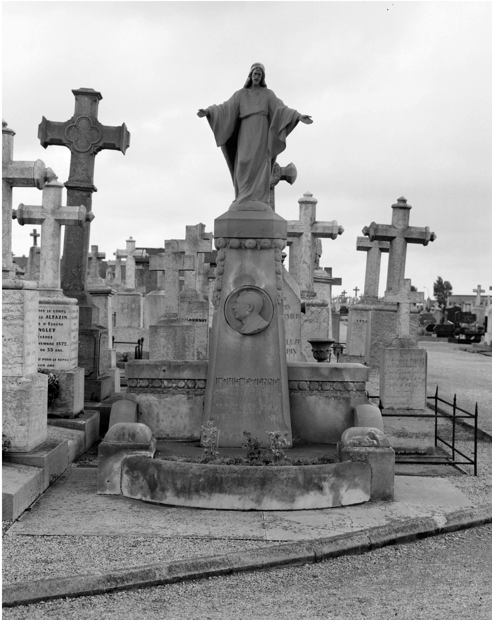
Tombeau de Louis Etienne, vu de face.