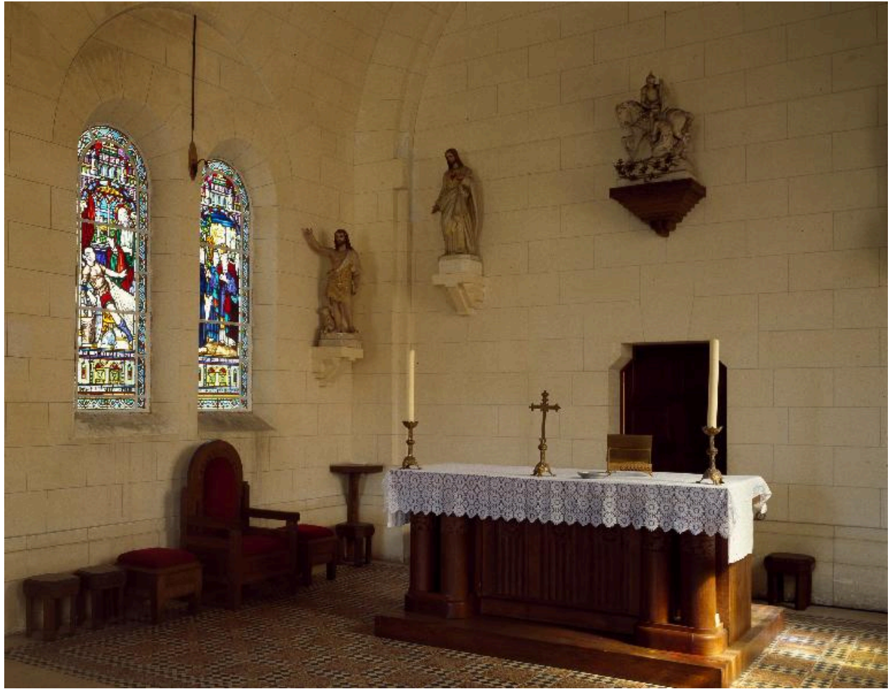
Vue intérieure du chœur.