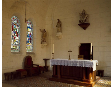
Vue intérieure du chœur. IVR22_20068000462VA