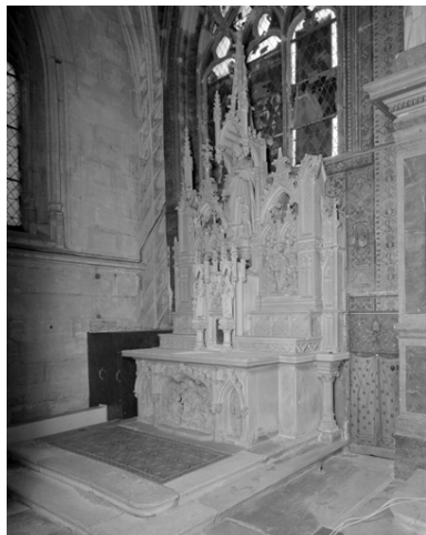
Autel en pierre, par la maison Haussaire, 19e siècle. IVR22_19950203235V