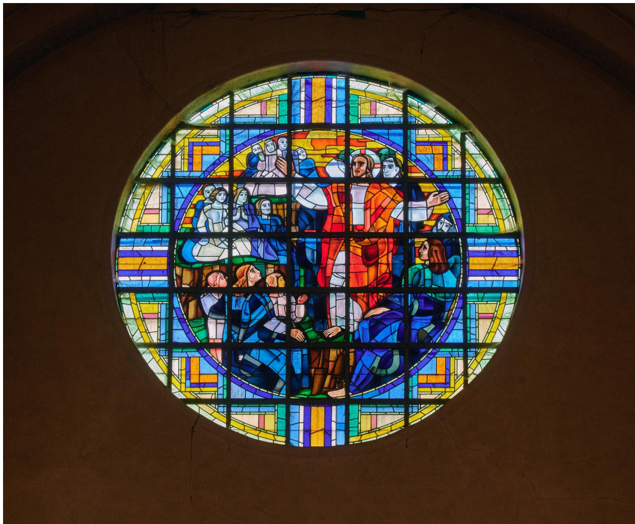
Baie 105 : verrière figurée. Jésus et les enfants.