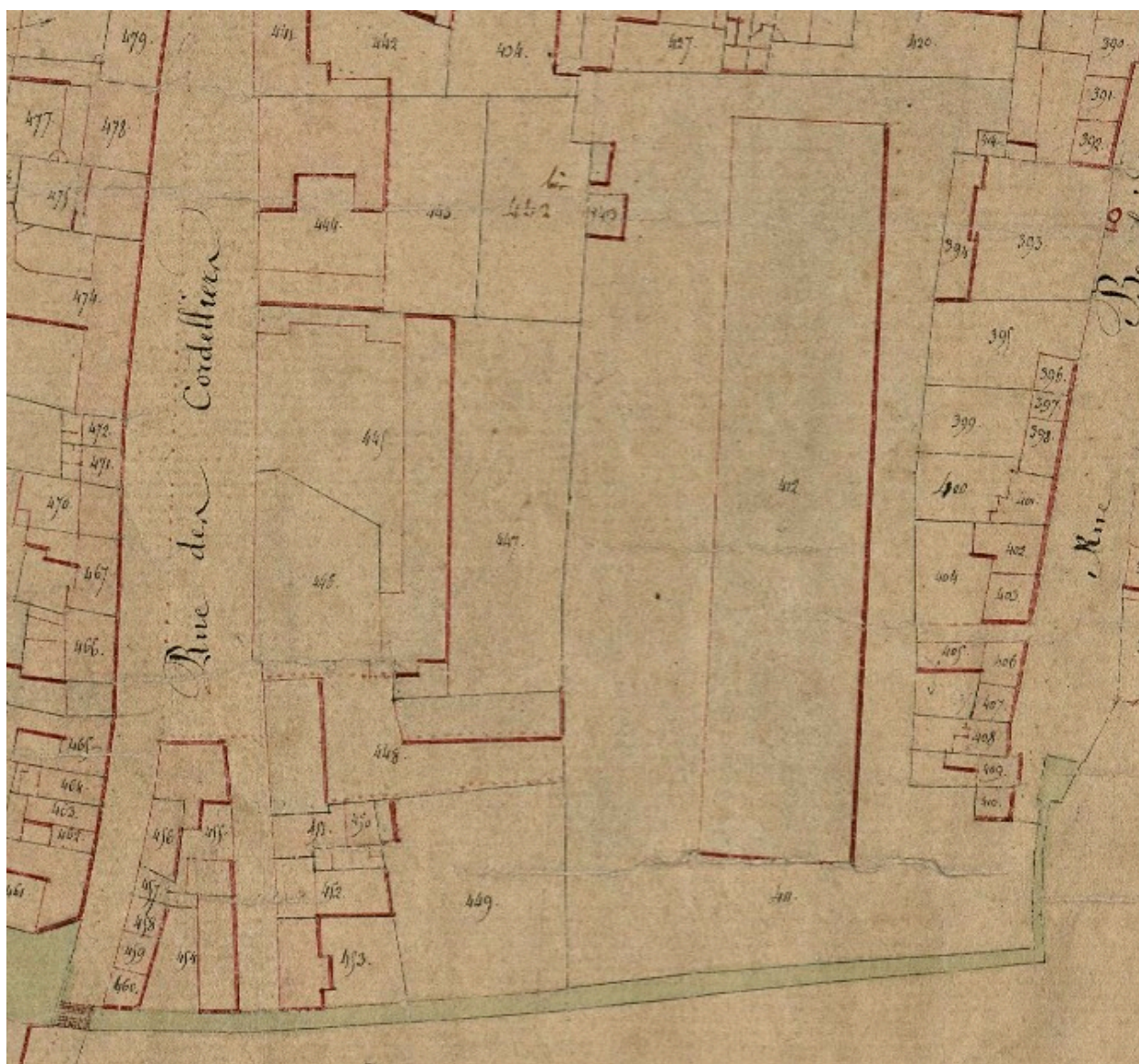
Extrait du cadastre napoléonien. Section B (AD Somme ; 3P 2065/4).