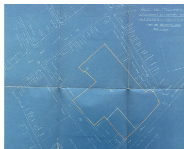
Ville de Péronne. Lotissement du terrain de l'ancienne caserne. Plan de situation (AD Somme ; 99O 3002).