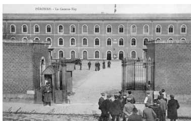
Péronne. La caserne Foy. Carte postale, vers 1905 (AD Somme ; 8FI 3347).