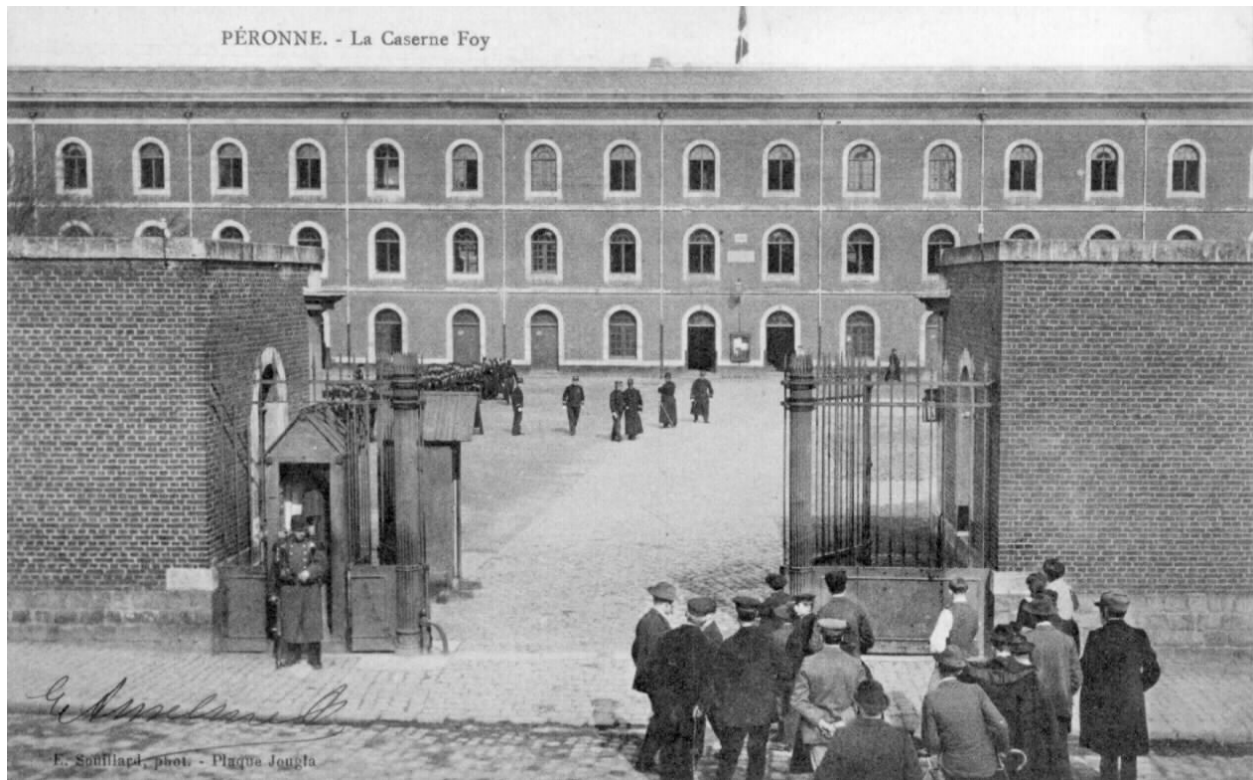
Péronne. La caserne Foy. Carte postale, vers 1905.