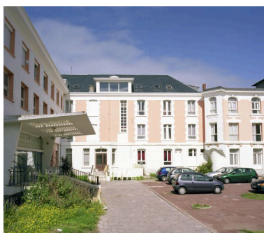
Corps de logis donnant sur la rue de Lhomel, élévation postérieure.