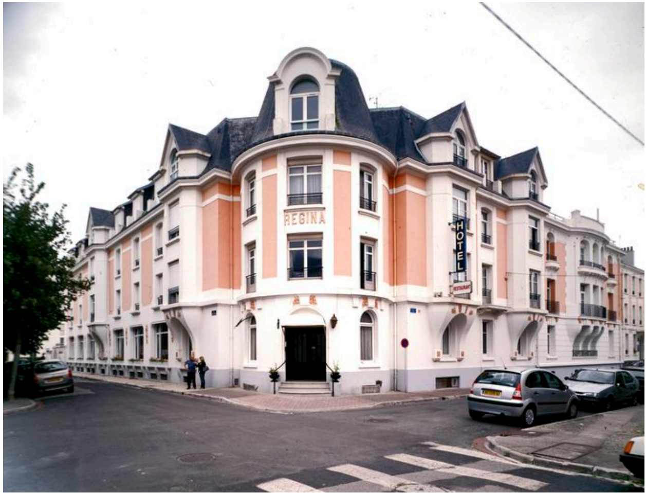
Vue générale en 2007.