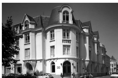
Vue générale en 1981.