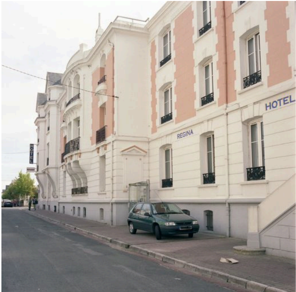
Elévation sur la rue de Lhomel, vue prise en enfilade en regardant vers l'est.