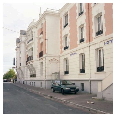
Elévation sur la rue de Lhomel, vue prise en enfilade en regardant vers l'est.