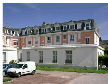
Corps de logis donnant sur la rue Eugène-Trigoulet, élévation postérieure.