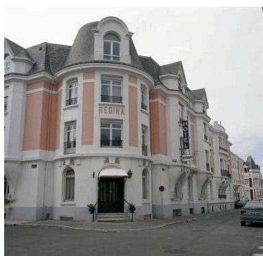
Elévisions sur les rues de Lhomel et Eugène-Trigoulet, vue angulaire montrant l'enfilade des façades donnant sur la rue de Lhomel. IVR31_20076200036XE