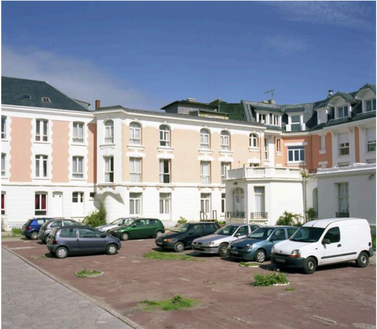
Corps de logis donnant sur la rue de Lhomel, élévation postérieure.