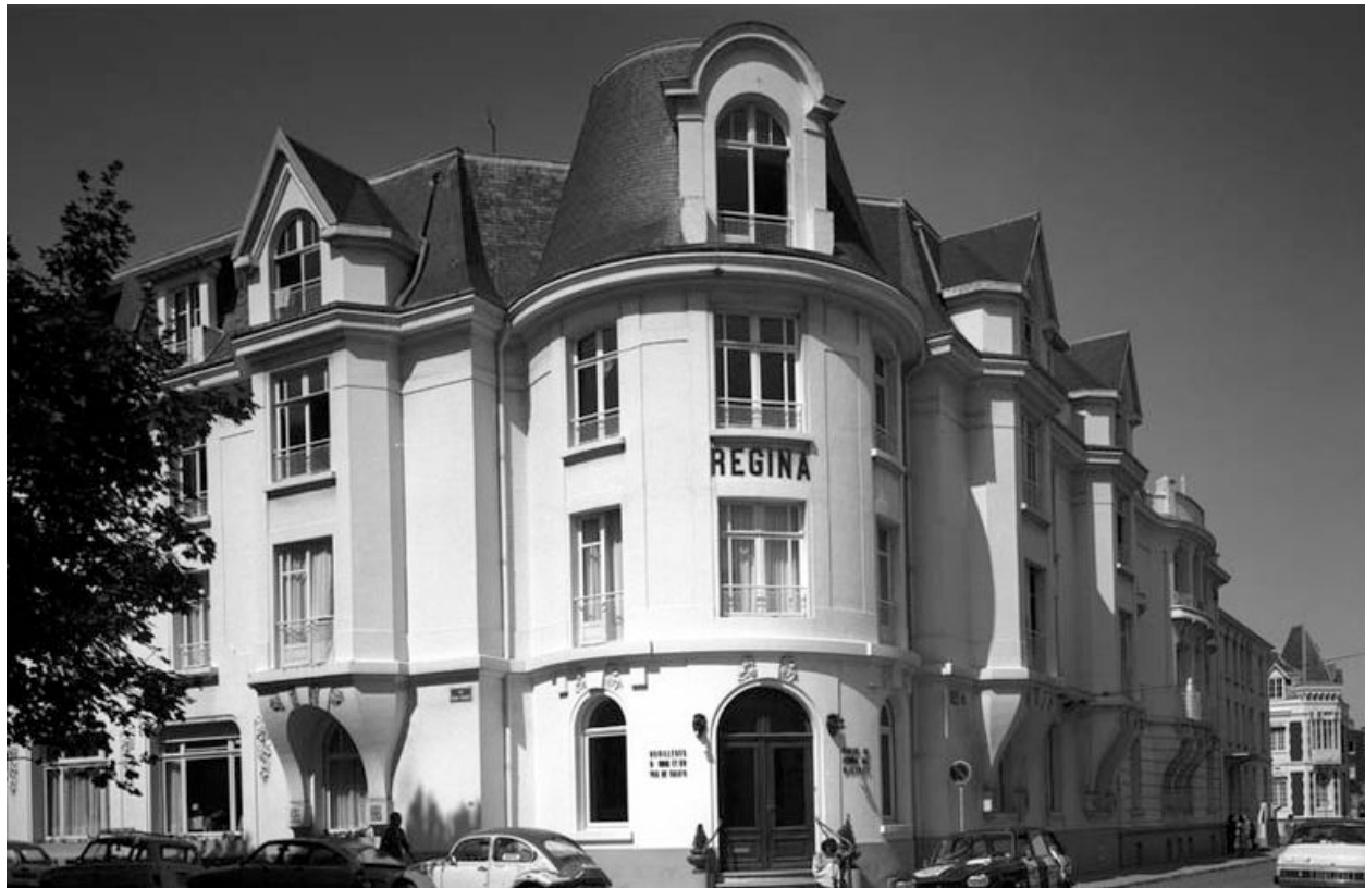
Vue générale en 1981.