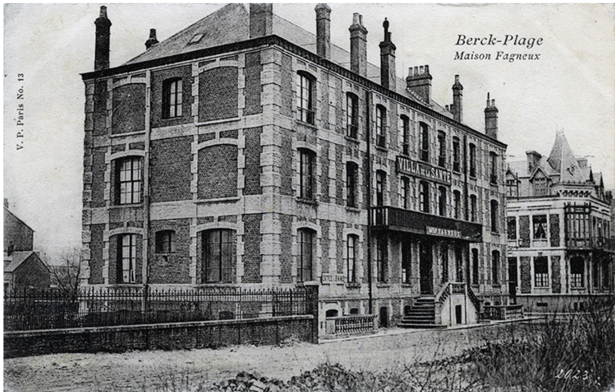
Elévation antérieure donnant sur la rue de Lhomel avant adjonction d'un nouveau corps de logis destiné à abriter l'hôtel Régina, vue générale prise de trois-quarts gauche.