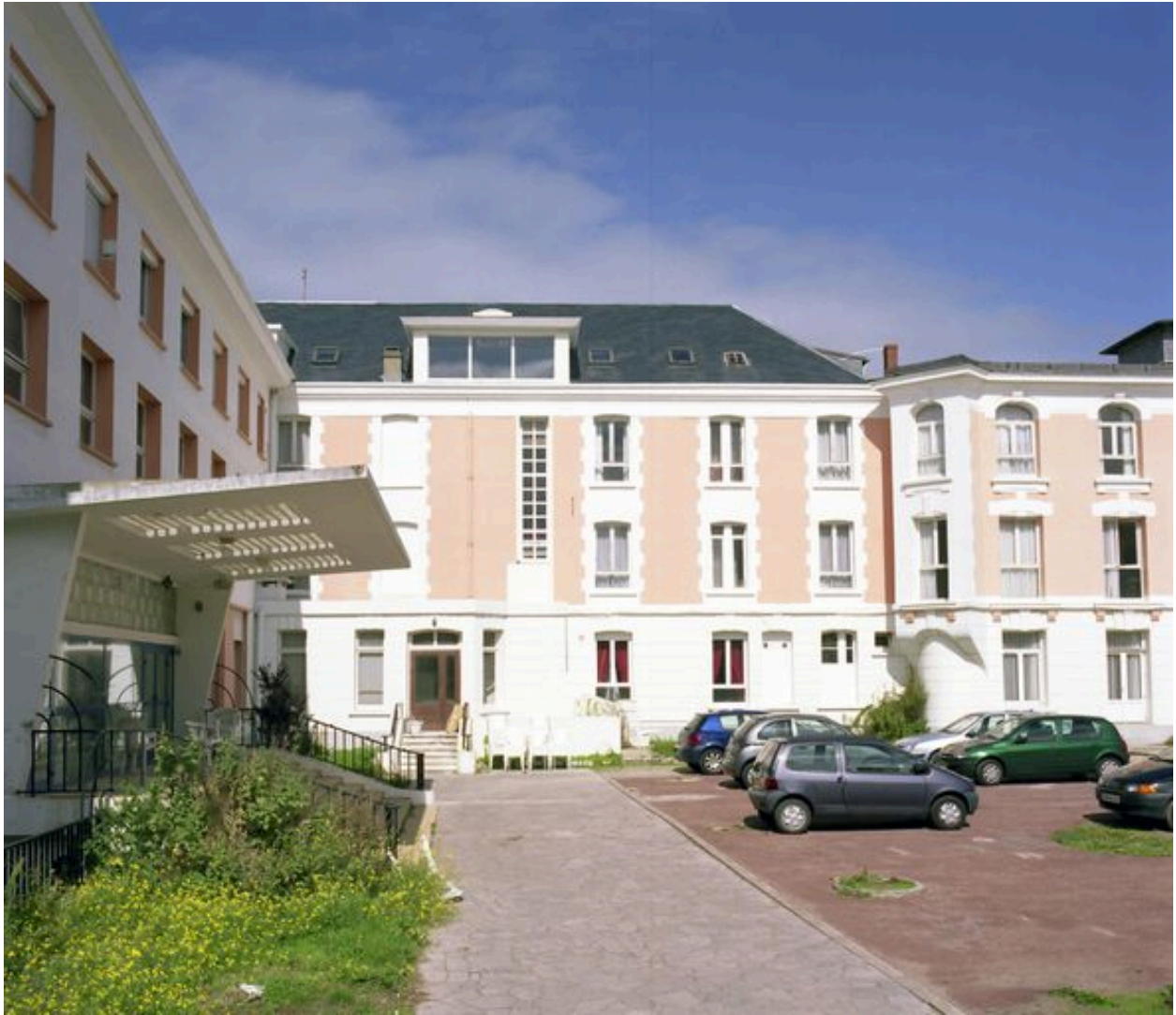
Corps de logis donnant sur la rue de Lhomel, élévation postérieure.