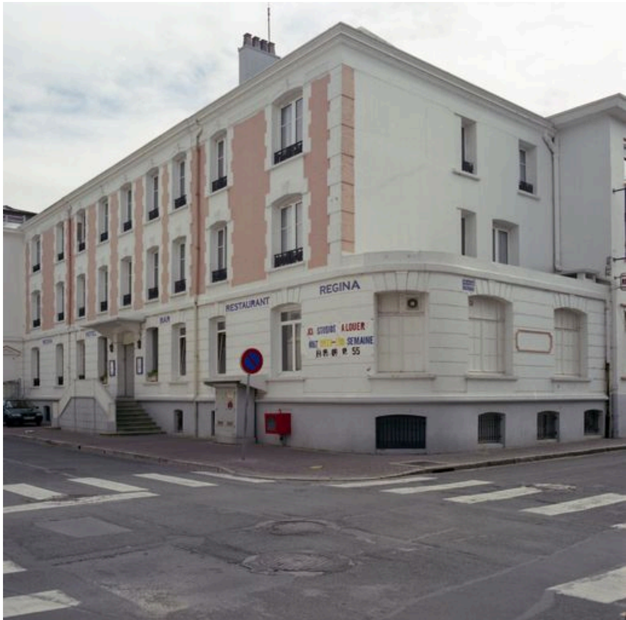
Corps de logis le plus ancien correspondant à celui de la villa de la Santé, élévation sur la rue de Lhomel, vue de trois-quarts droit.