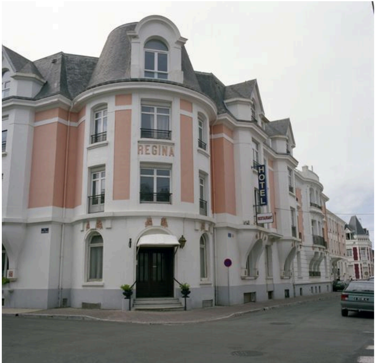
Elévations sur les rues de Lhomel et Eugène-Trigoulet, vue angulaire montrant l'enfilade des façades donnant sur la rue de Lhomel.