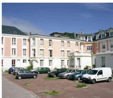
Corps de logis donnant sur la rue de Lhomel, élévation postérieure. IVR31_20076200033XE