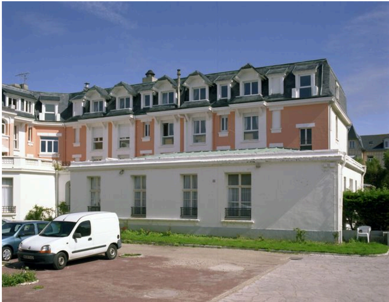
Corps de logis donnant sur la rue Eugène-Trigoulet, élévation postérieure.