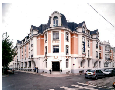
Vue générale en 2007. IVR31_20076200047XA