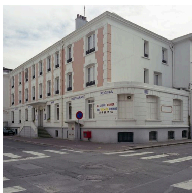
Corps de logis le plus ancien correspondant à celui de la villa de la Santé, élévation sur la rue de Lhomel, vue de trois-quarts droit.