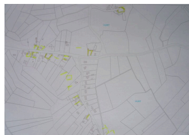
Superposition des cadastres napoléonien et actuel.