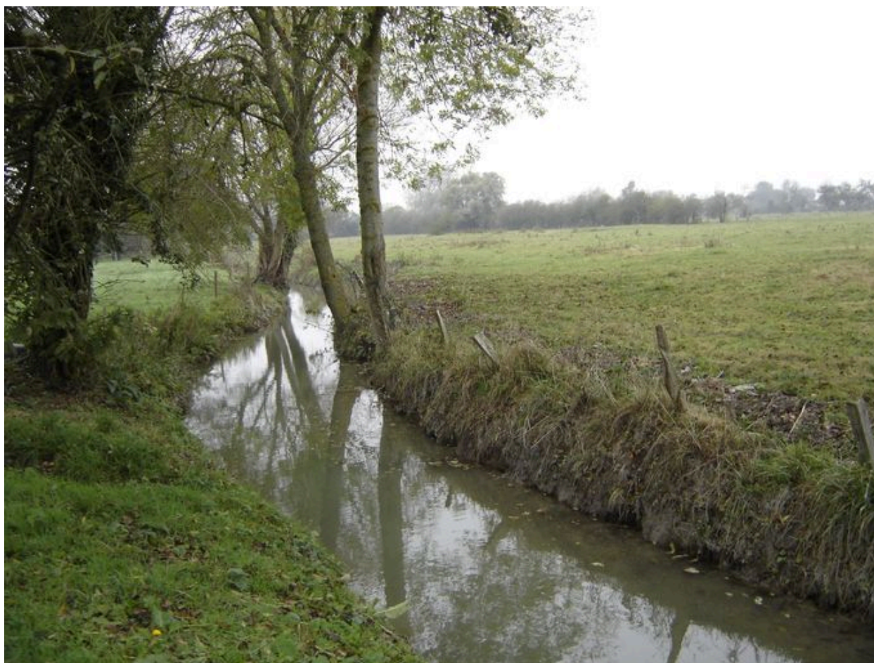
Vue du paysage de prairie autour du hameau et prépondérance de l'eau.