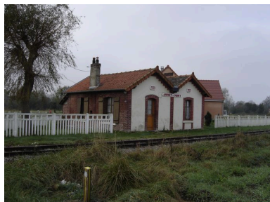
La halte de Hurt, sur la ligne de la voie ferrée Noyelles-Cayeux.