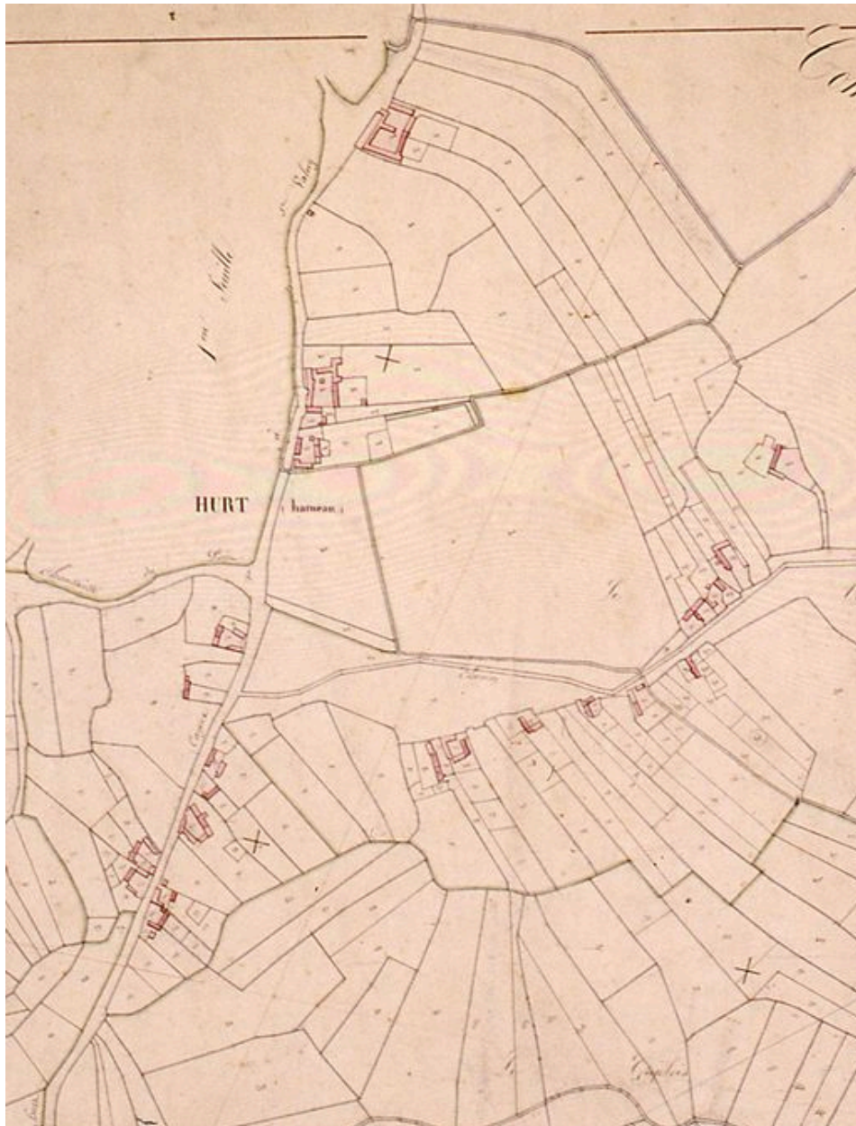
Vue détaillée de la section de Hurt sur le cadastre napoléonien de 1831.