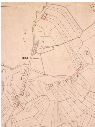
Vue détaillée de la section de Hurt sur le cadastre napoléonien de 1831.