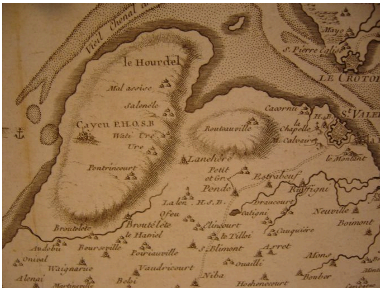
Carte du secteur de Cayeux en 1744.