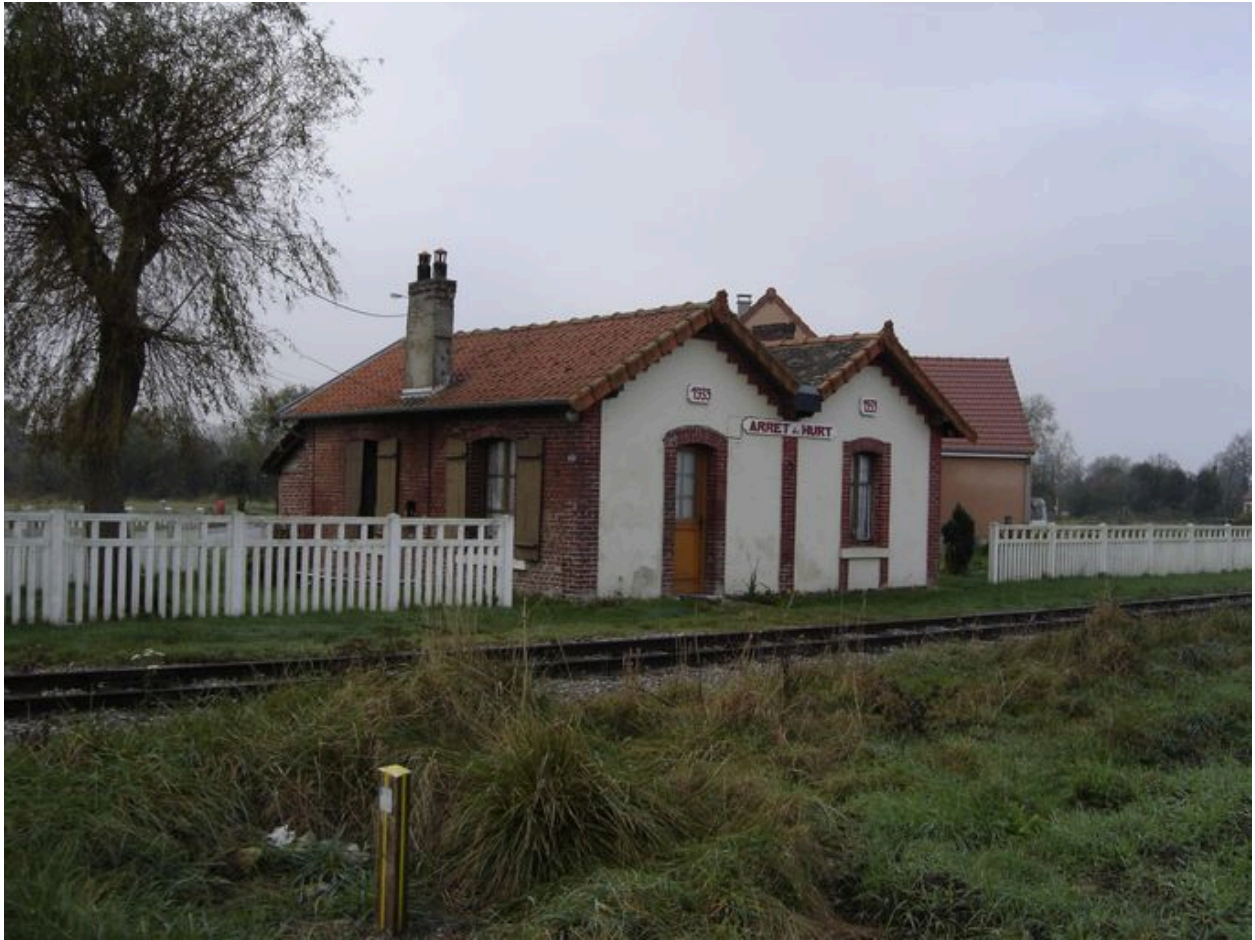
La halte de Hurt, sur la ligne de la voie ferrée Noyelles-Cayeux.