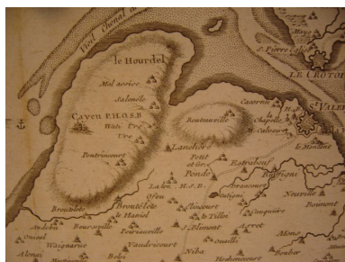
Carte du secteur de Cayeux en 1744.