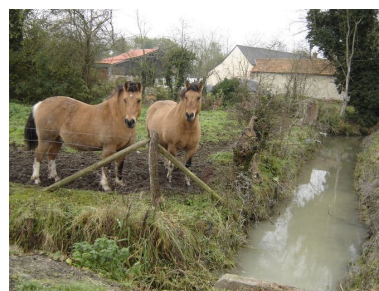
Forte présence de l’eau et des prairies au coeur même du hameau.