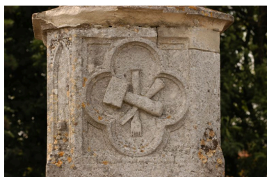
Détail sur le médaillon (emblème du maçon).

IVR22_20038000801NUCA