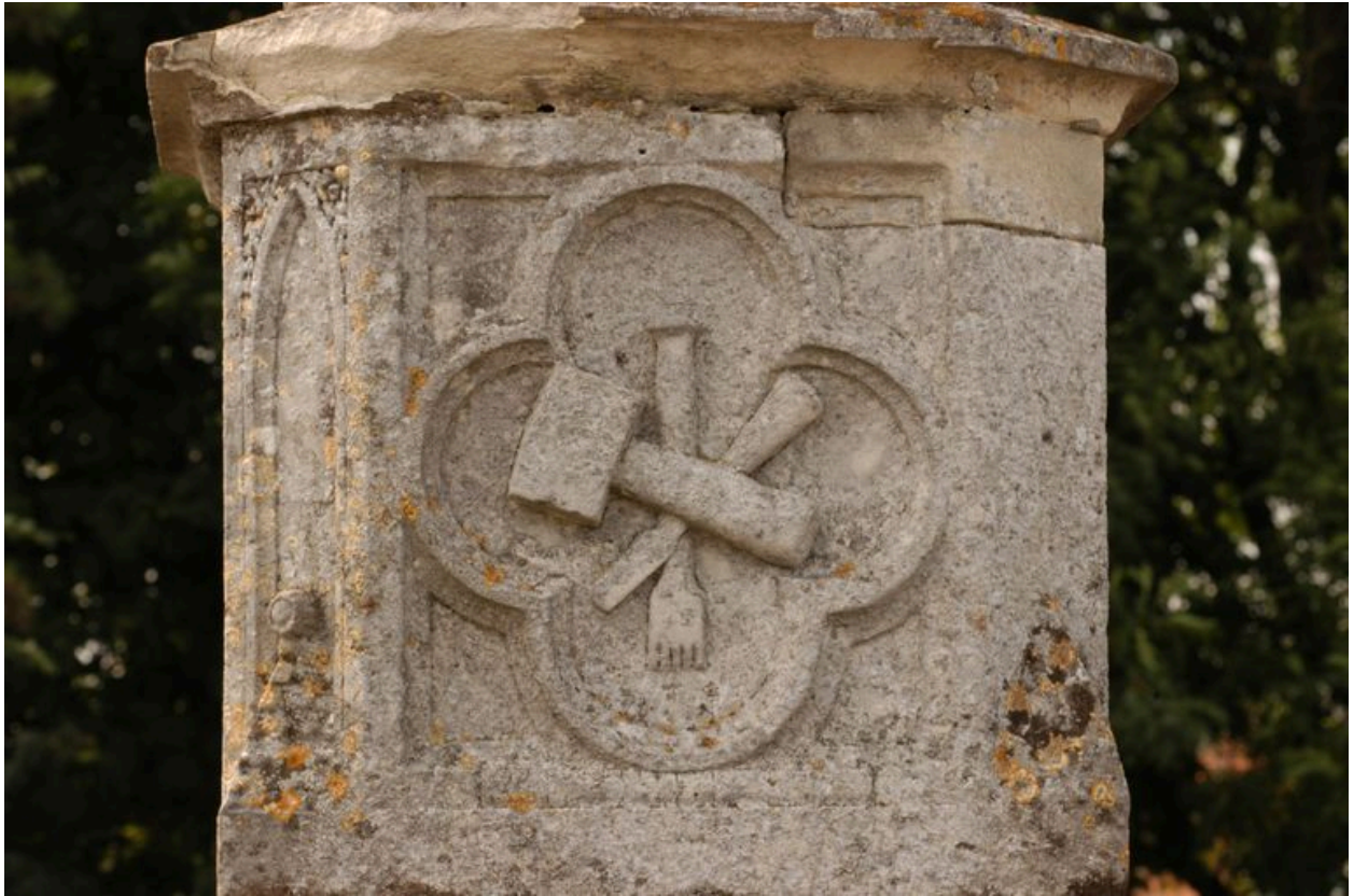
Détail sur le médaillon (emblème du maçon).