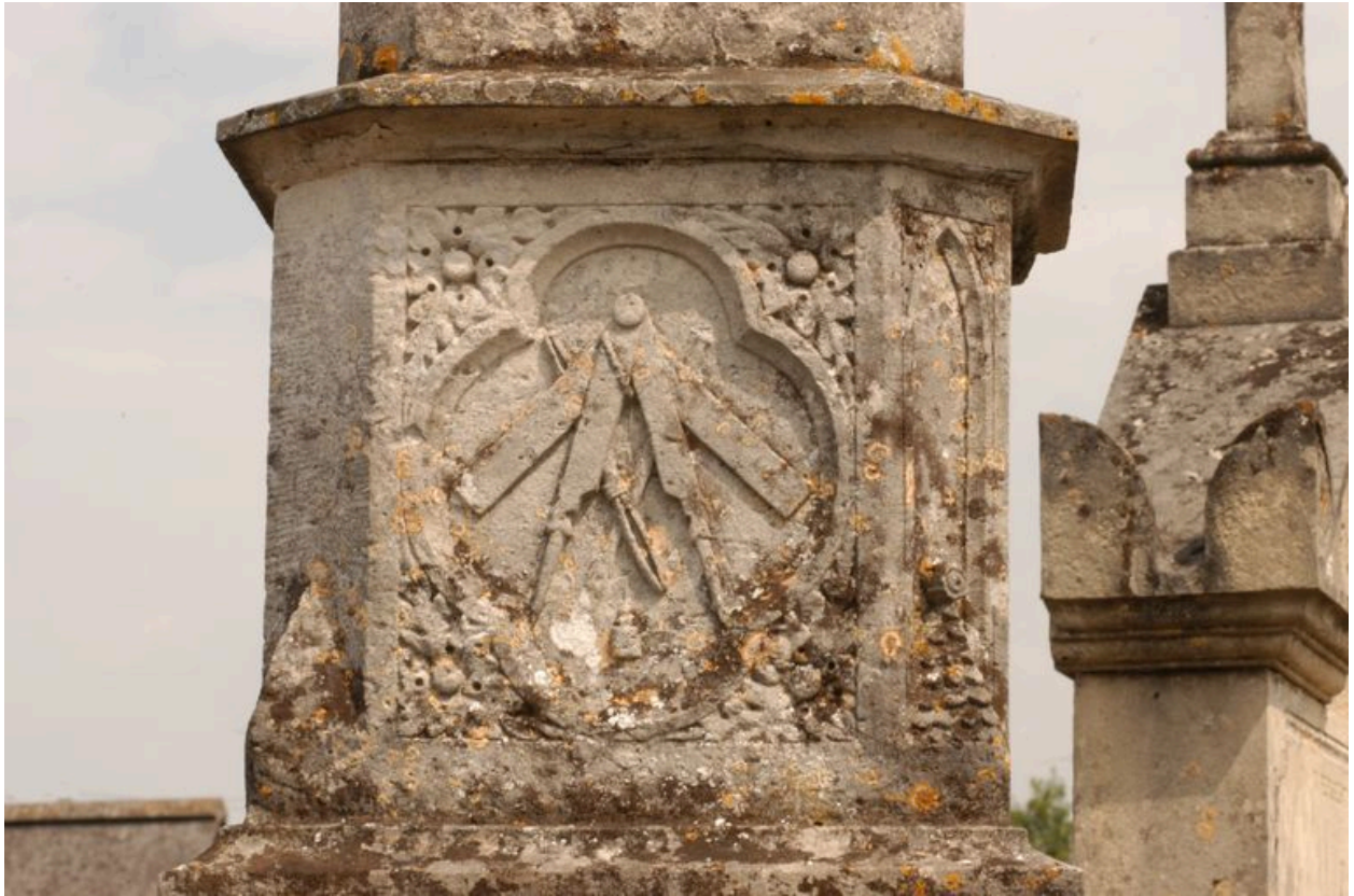
Détail sur le médaillon (emblème du tailleur de pierre).