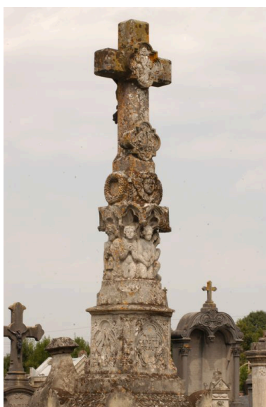
Détail sur la croix.

IVR22_20038000799NUCA