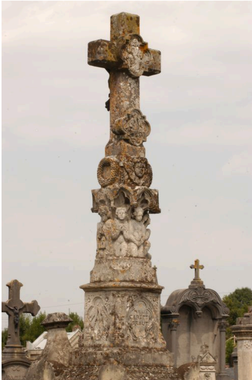
Détail sur la croix.