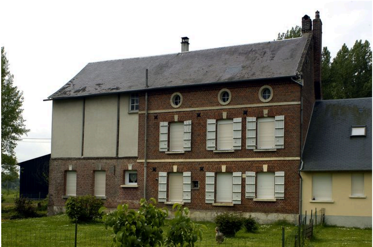
Vue générale du moulin à blé, façade sur jardin.