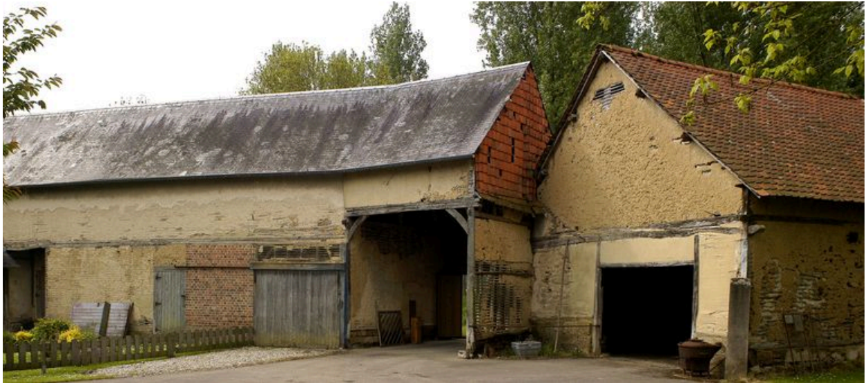
L'entrée charretière et les dépendances agricoles, façade sur cour.