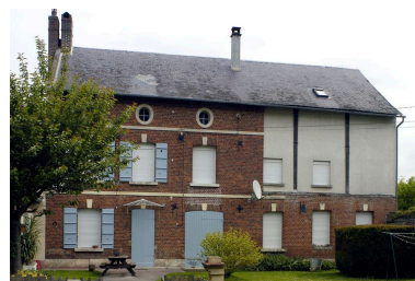
Vue d'ensemble du moulin à blé, façade sur cour.