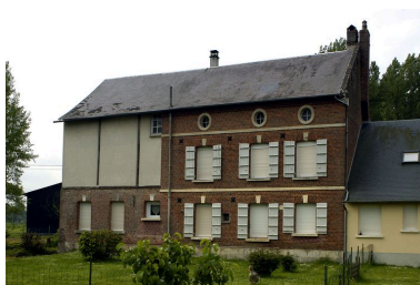
Vue générale du moulin à blé, façade sur jardin.