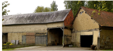
L'entrée charretière et les dépendances agricoles, façade sur cour. IVR22_20056000062NUCA