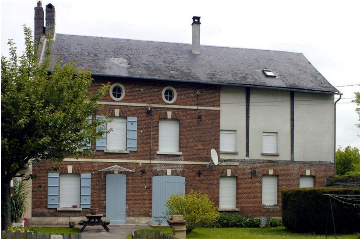
Vue d'ensemble du moulin à blé, façade sur cour.