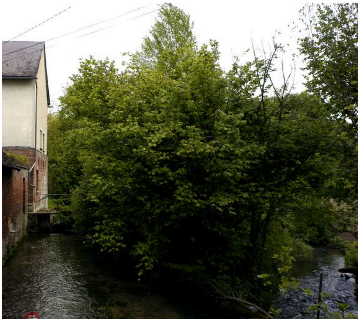
Le canal d'aménée, le déversoir et le pignon du moulin à blé.