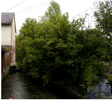
Le canal d'aménée, le déversoir et le pignon du moulin à blé.