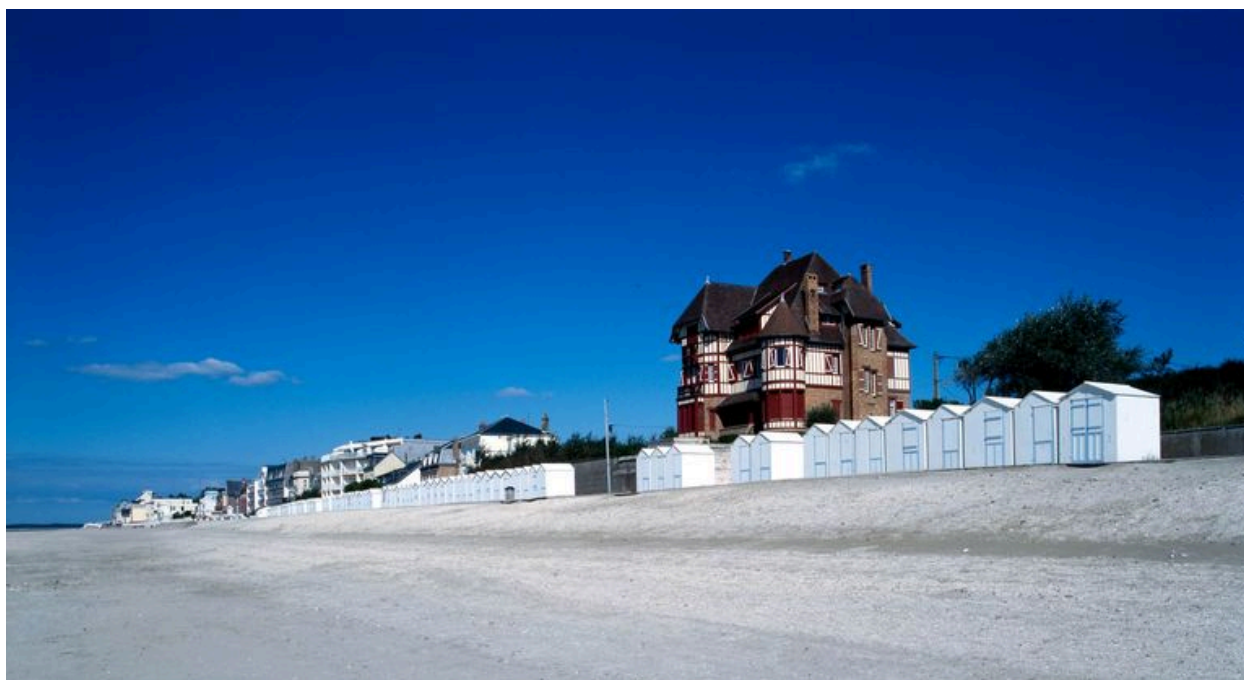
La plage du Crotoy.