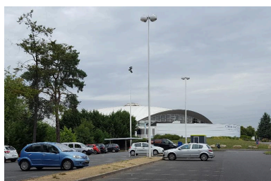
Vue de l'entrée du centre nautique depuis le parking