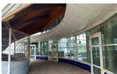
Vue de la terrasse d'entrée, avec vue sur les bassins.