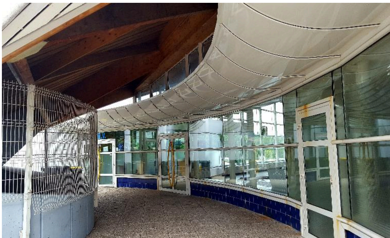
Vue de la terrasse d'entrée, avec vue sur les bassins.