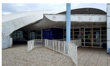
Vue de l'entrée de la piscine. IVR32_20176005065NUCA