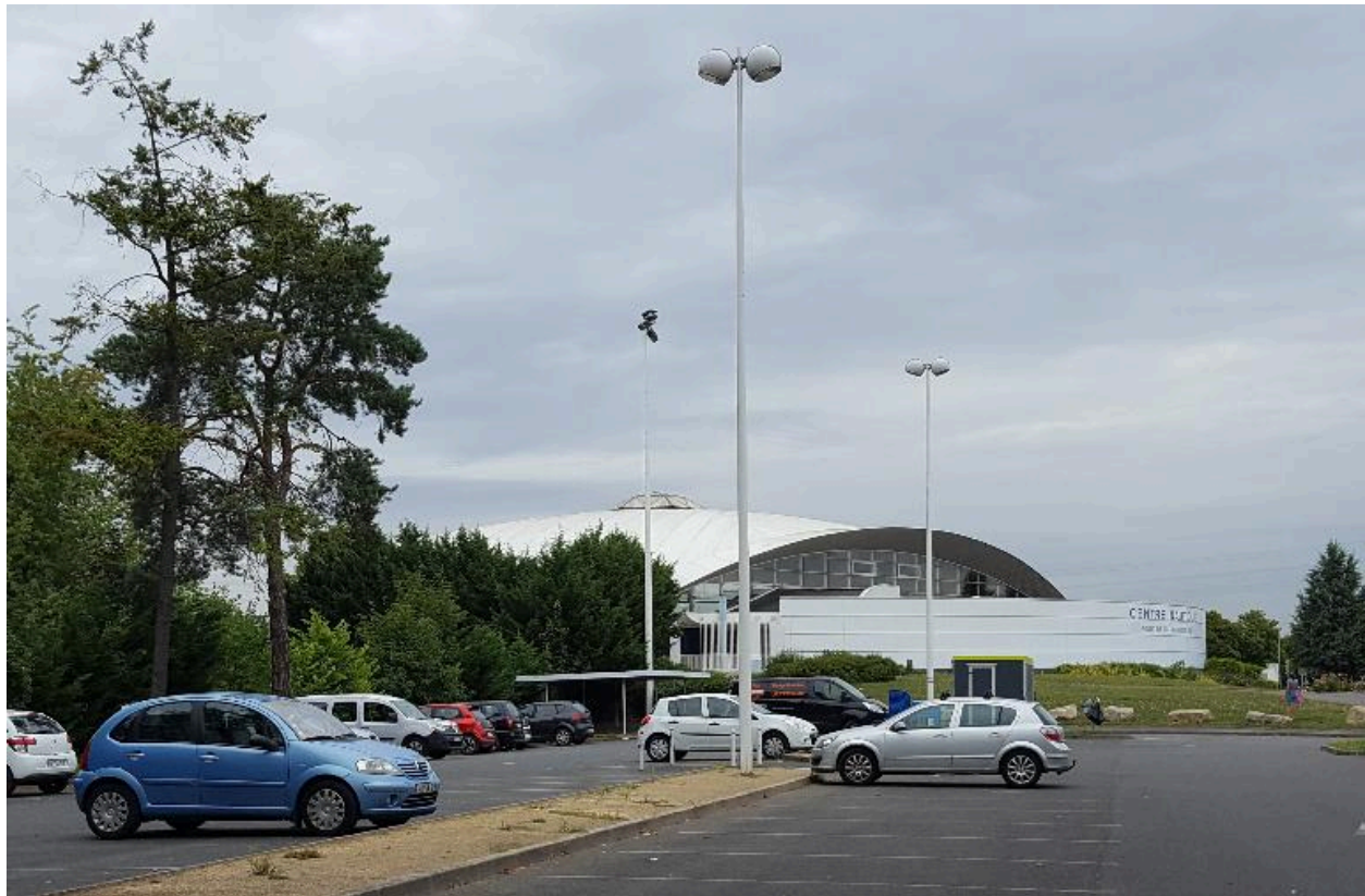
Vue de l'entrée du centre nautique depuis le parking