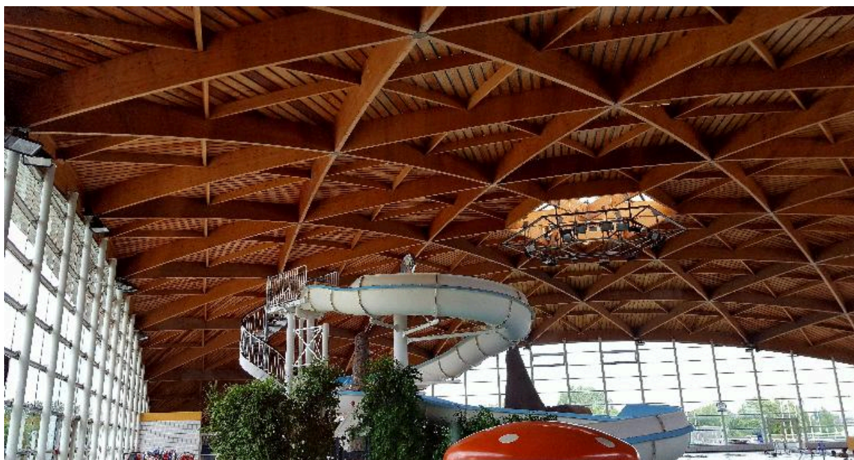
Vue de la voûte en bois lamellé collé.