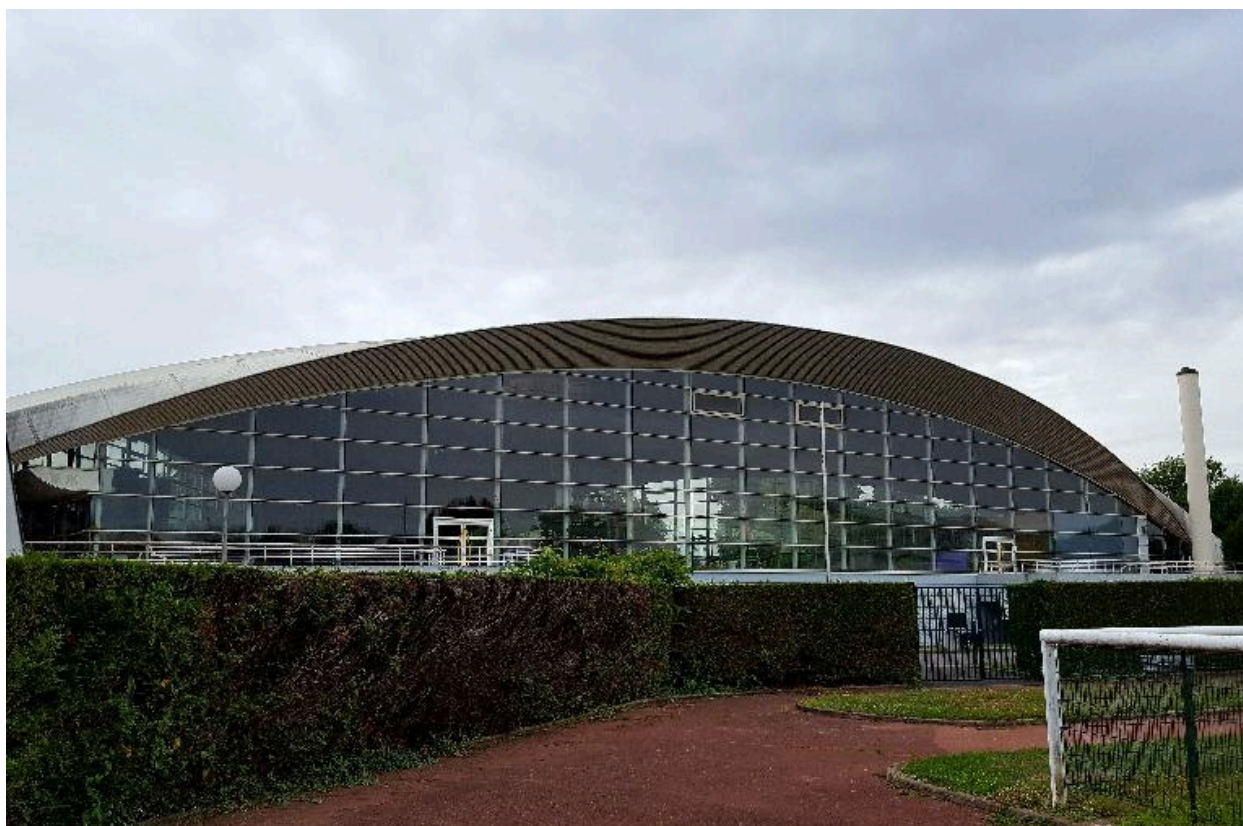
Vue de la façade est depuis le stade.