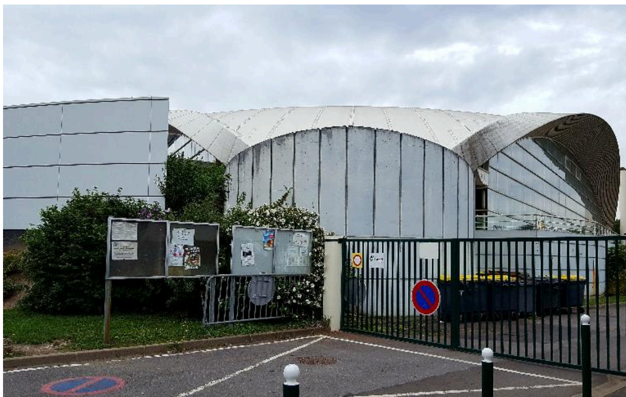
Vue d'une culée et de la façade est.