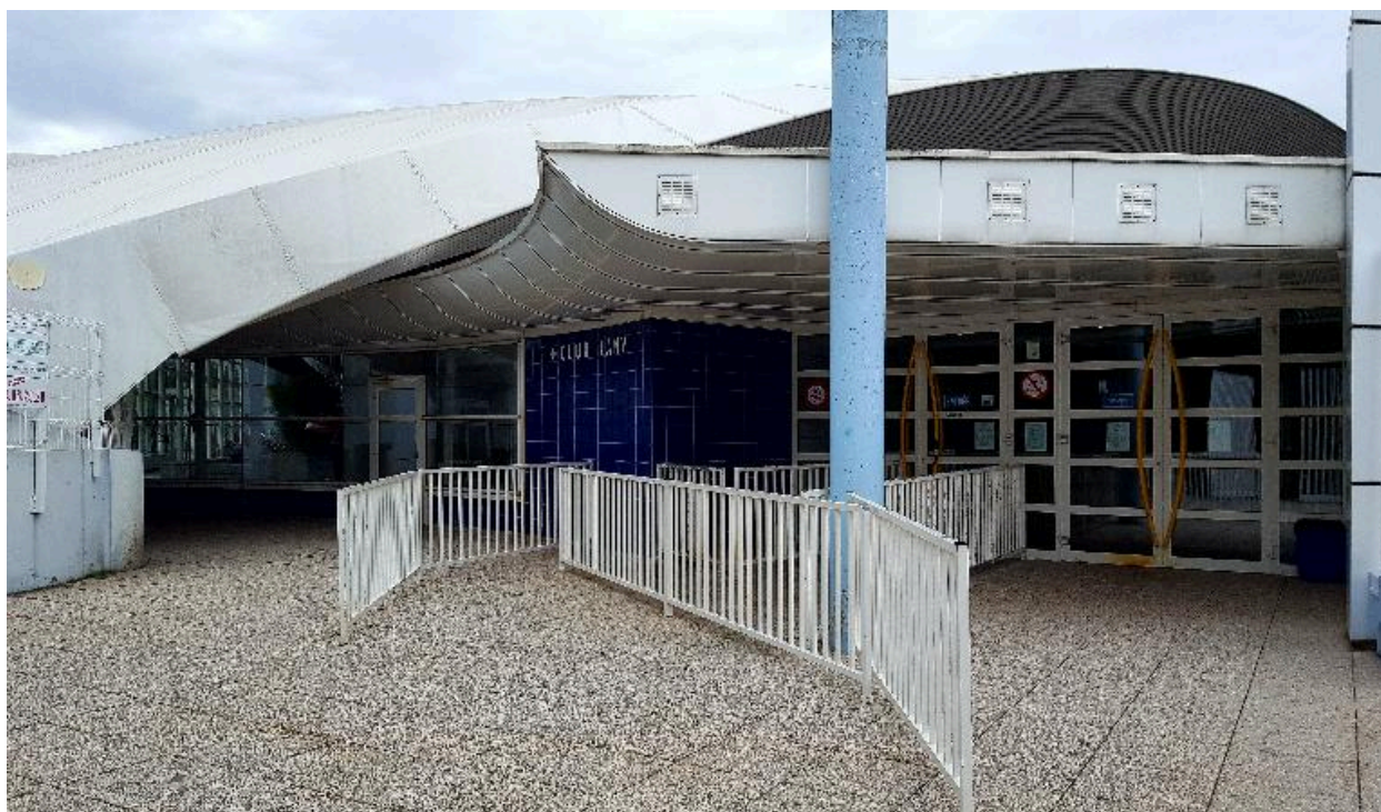
Vue de l'entrée de la piscine.