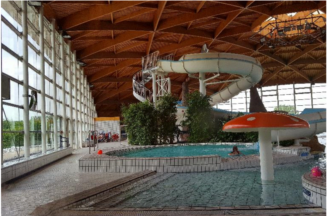
Vue du toboggan géant et d'une partie des bassins ludiques.