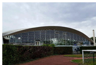
Vue de la façade est depuis le stade.