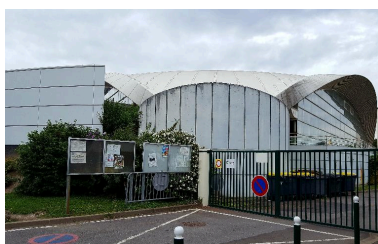
Vue d'une culée et de la façade est. IVR32_20176005063NUCA