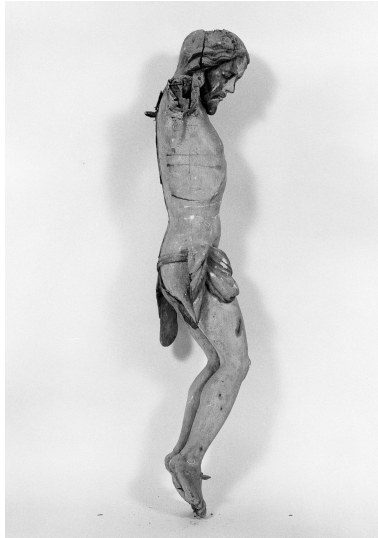
Dextre.