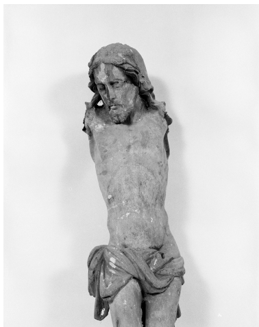
Tête, tronc. IVR31_19796200587X