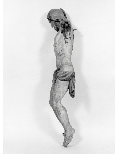
Senestre. IVR31_19796200583X