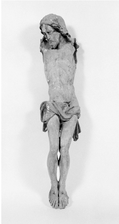
Vue de face. IVR31_19796200584X