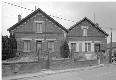
Elévation antérieure. IVR22_19856000970X

Plan de situation. Extrait du plan cadastral de 1982, section AC 56 et 288.