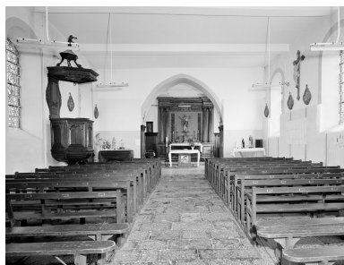
Vue intérieure, vers le chœur. IVR22_19930200525V