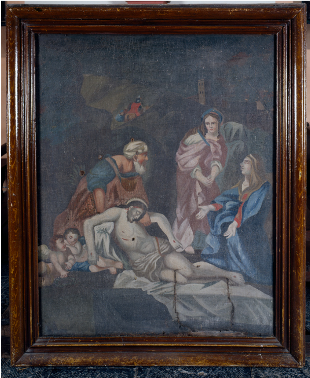
Tableau d'autel : Mise au tombeau.