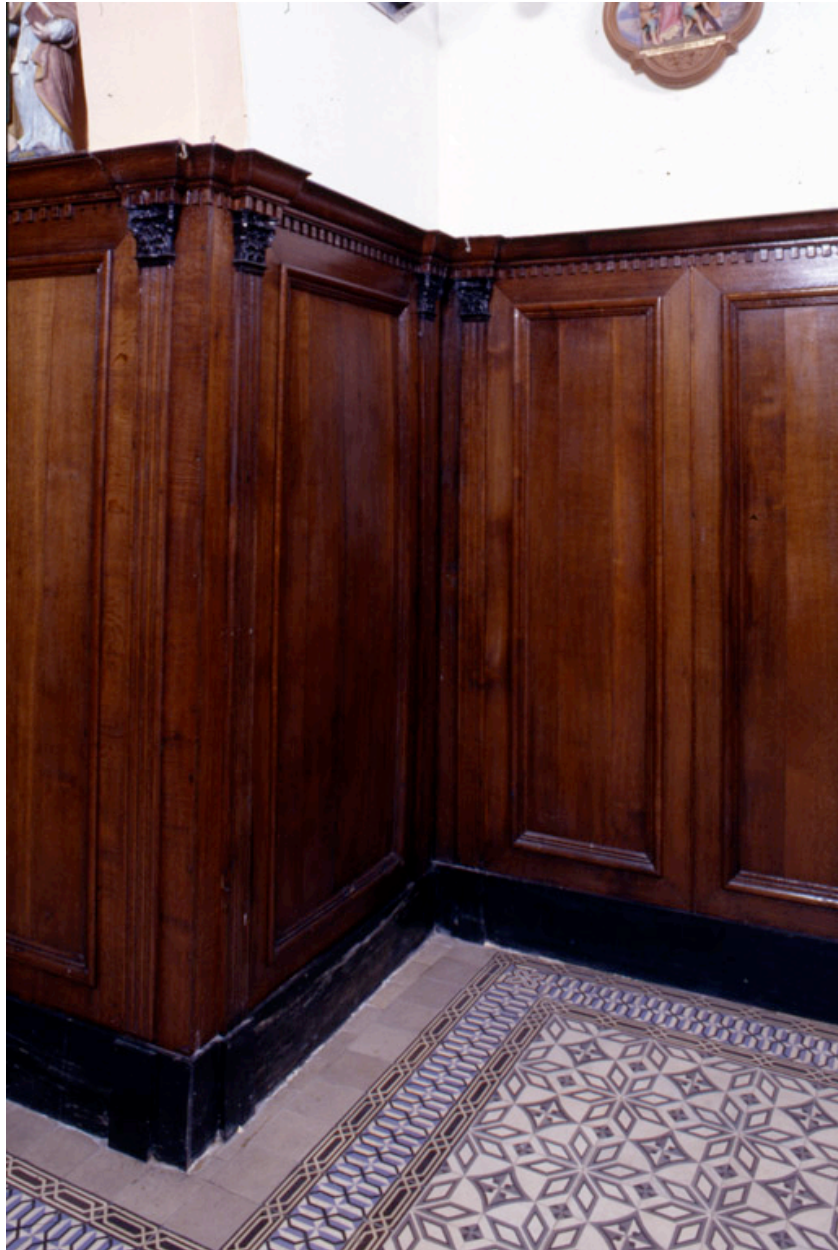
Vue partielle du lambris de demi-revêtement.