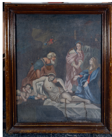
Tableau d'autel : Mise au tombeau.