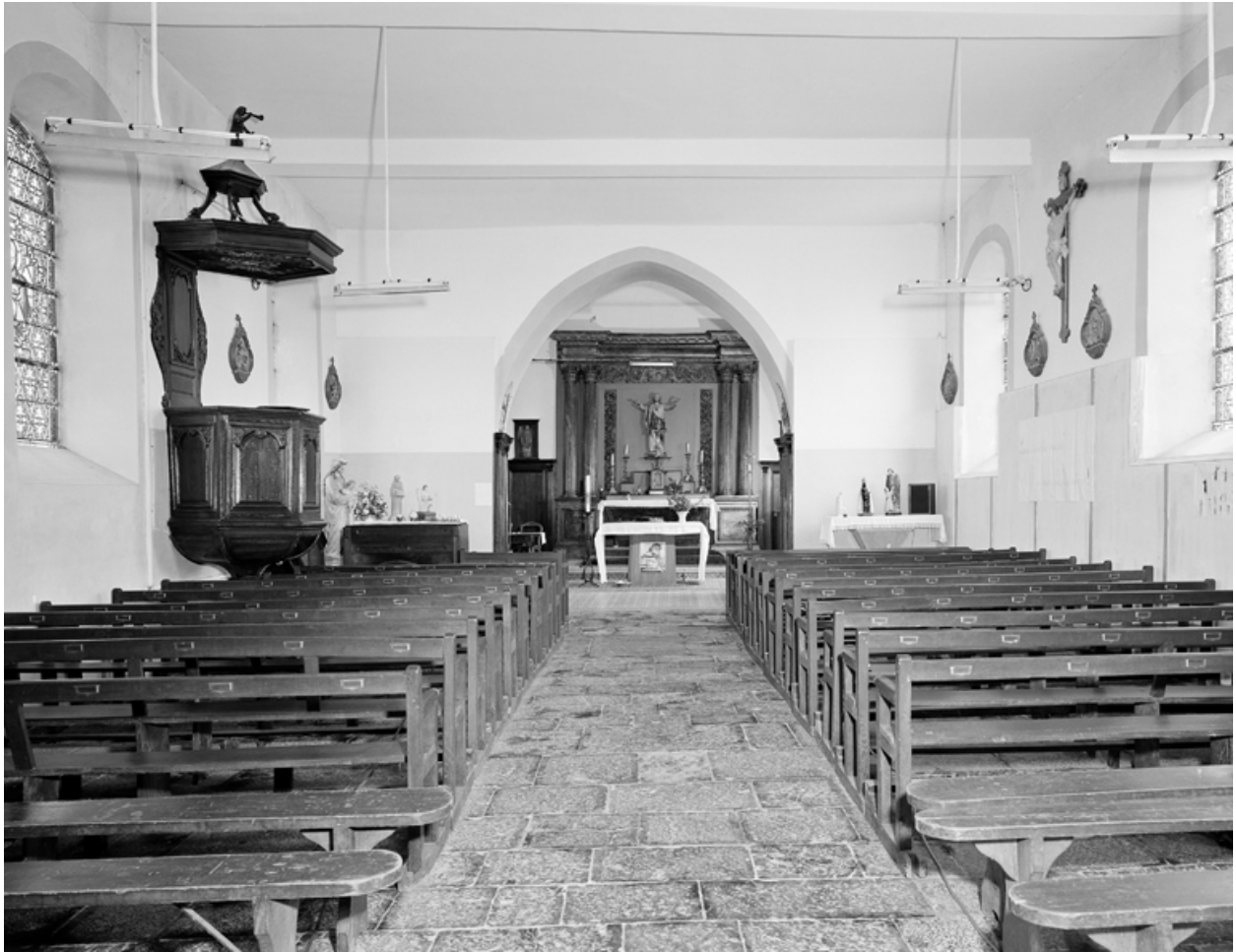
Vue intérieure, vers le chœur.