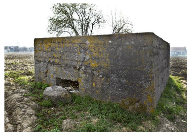
vue de trois-quarts vers le sud-est.