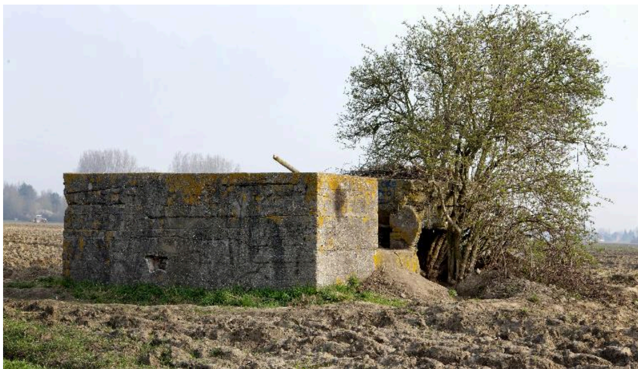
Vue de trois-quarts, vers le nord-est