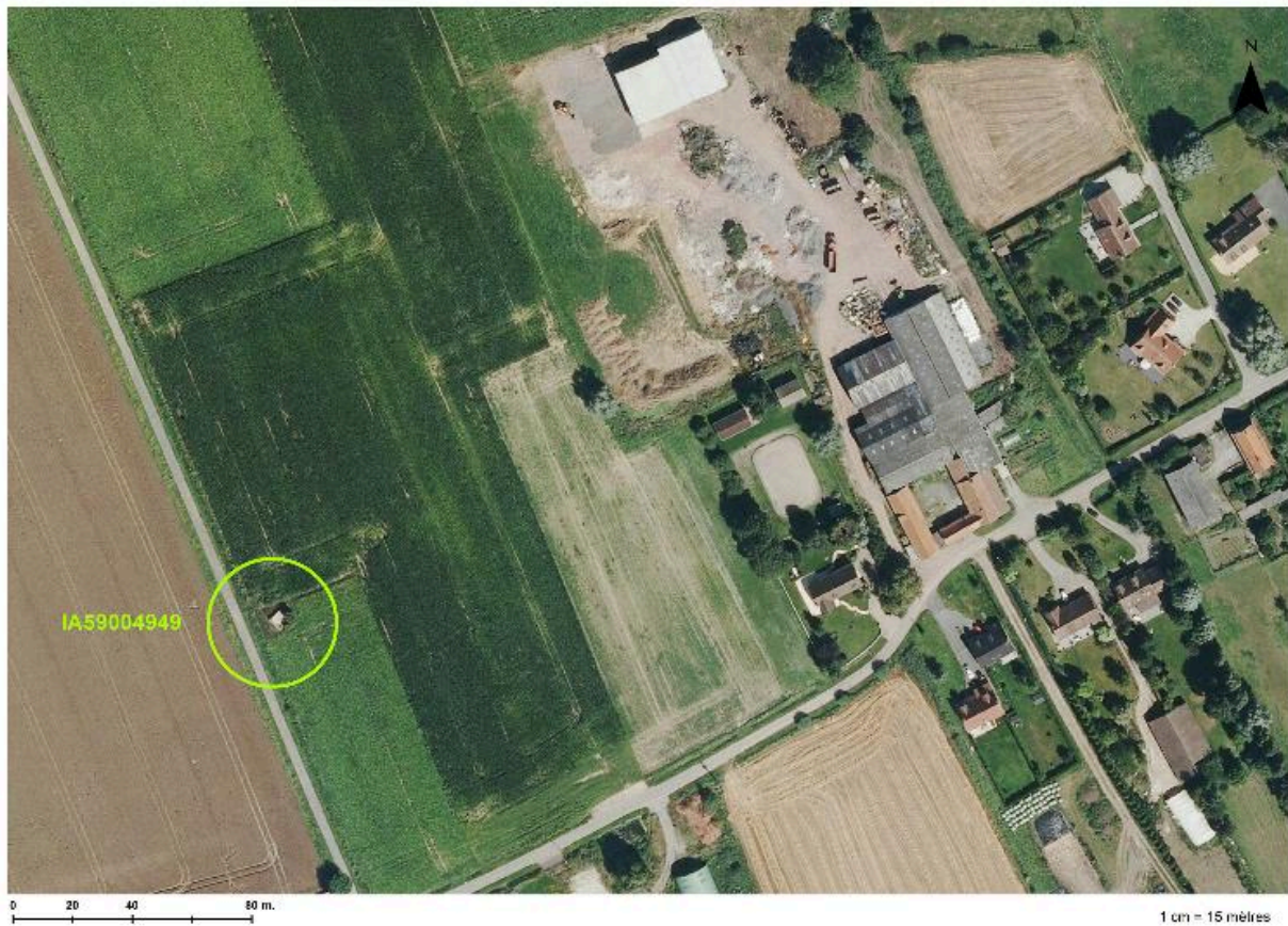
Situation de l'édifice sur une photographie aérienne de 2014