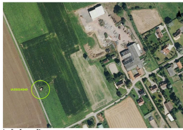
Situation de l'édifice sur une photographie aérienne de 2014 IVR32_20175900918NUCA