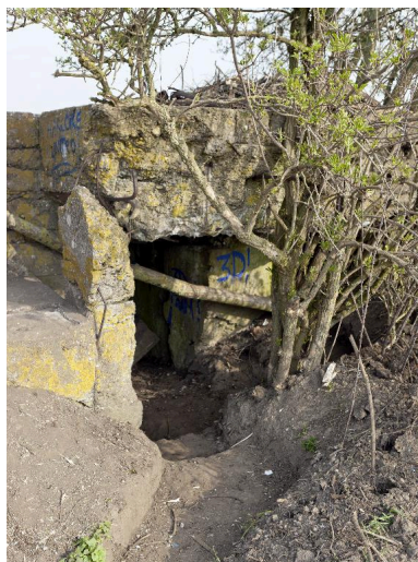
Elévation sud, accès à l'édifice