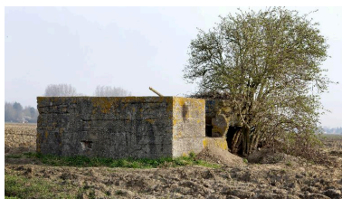
Vue de trois-quarts, vers le nord-est IVR31_20145905516NUCA