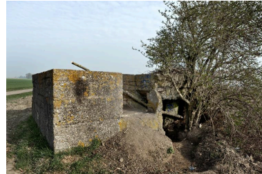
Elévation sud IVR31_20145905513NUCA