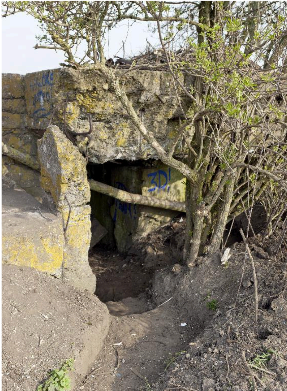
Elévation sud, accès à l'édifice