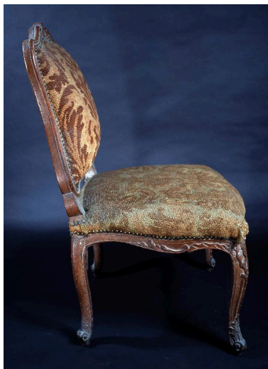
Vue de profil. IVR22_19956000457XA