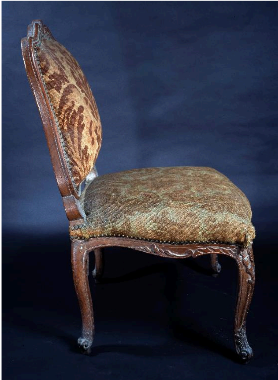
Vue de profil.