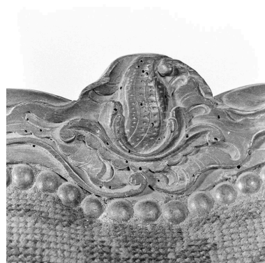
Vue de détail : motif au sommet du dossier. IVR22_19956000063X