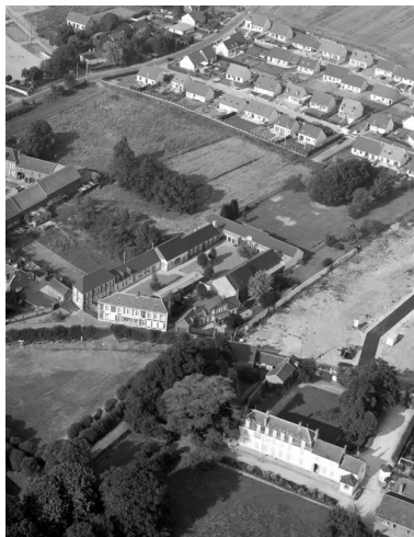
Vue aérienne du site avec le logement du contremaître et le logement patronal en 1994.