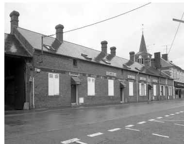
Les logements d'ouvriers, façades sur rue.