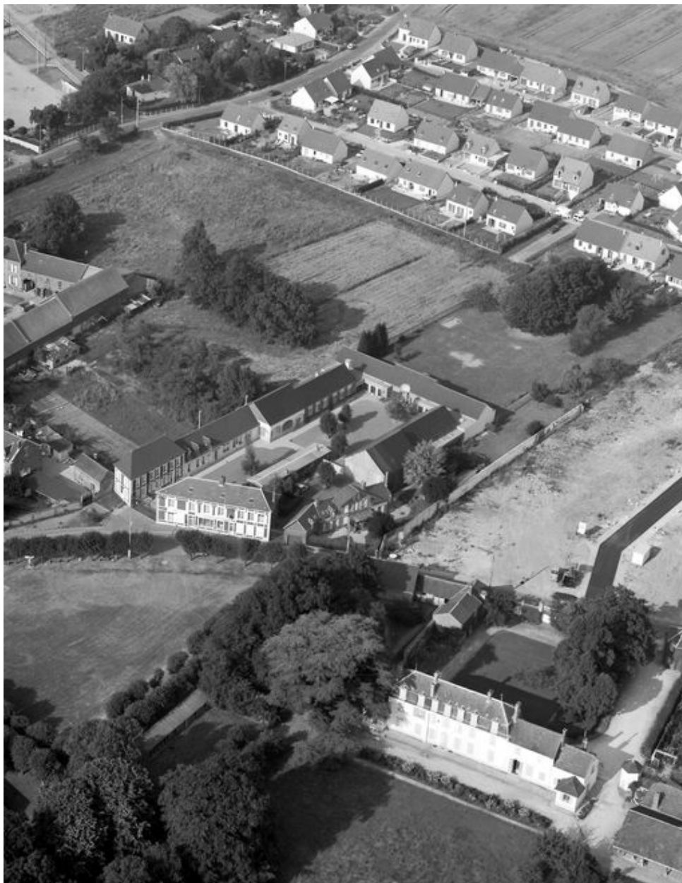
Vue aérienne du site avec le logement du contremaître et le logement patronal en 1994.