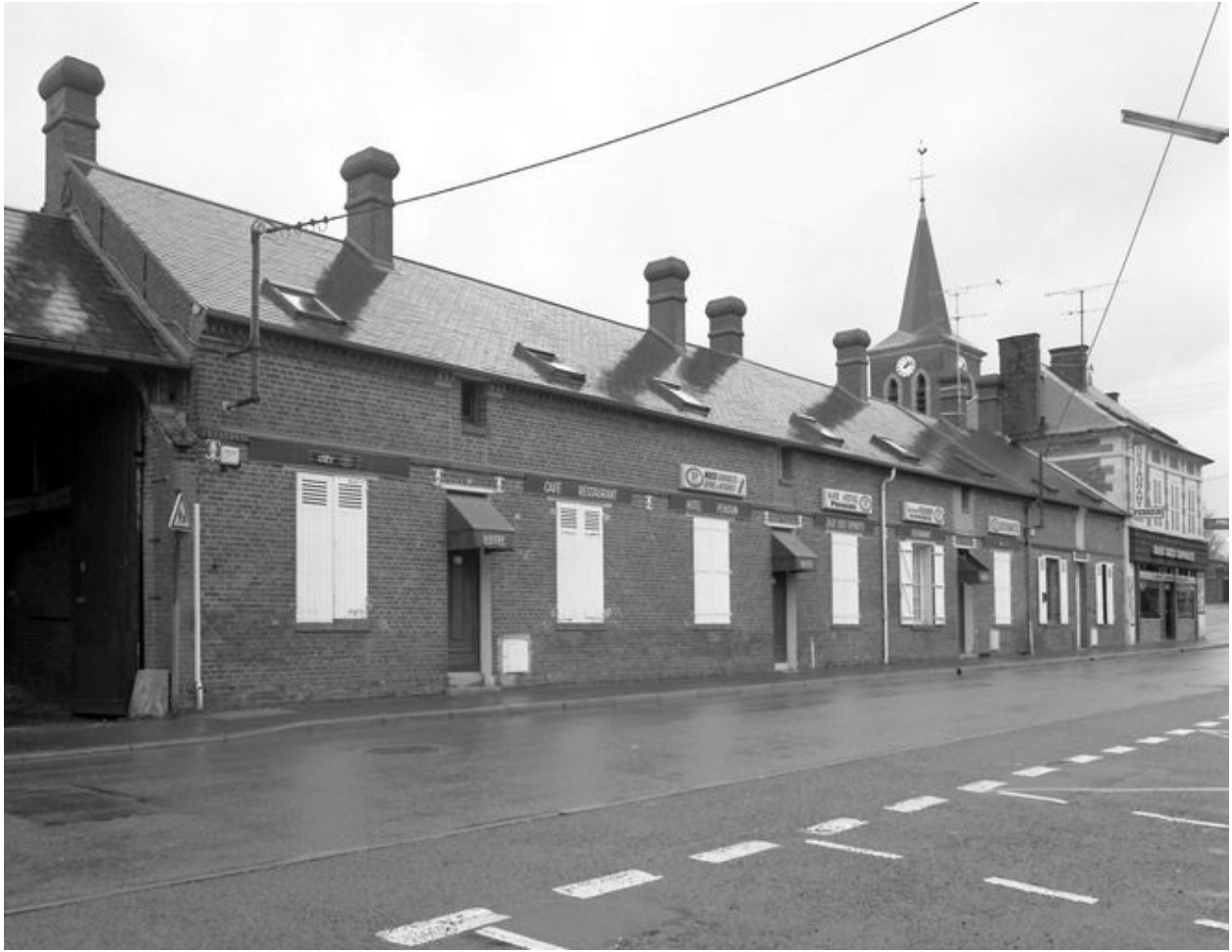
Les logements d'ouvriers, façades sur rue.