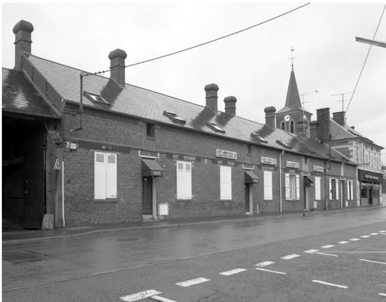
Les logements d'ouvriers, façades sur rue.