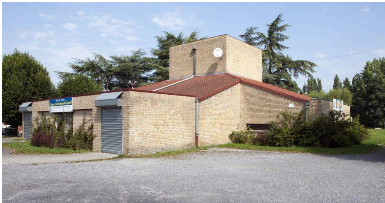
Élévation sud est.