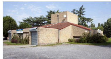
Élévation sud est. IVR31_20155900718NUCA