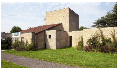
Élévation nord est.