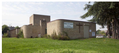
Élévation nord. IVR31_20155900716NUCA