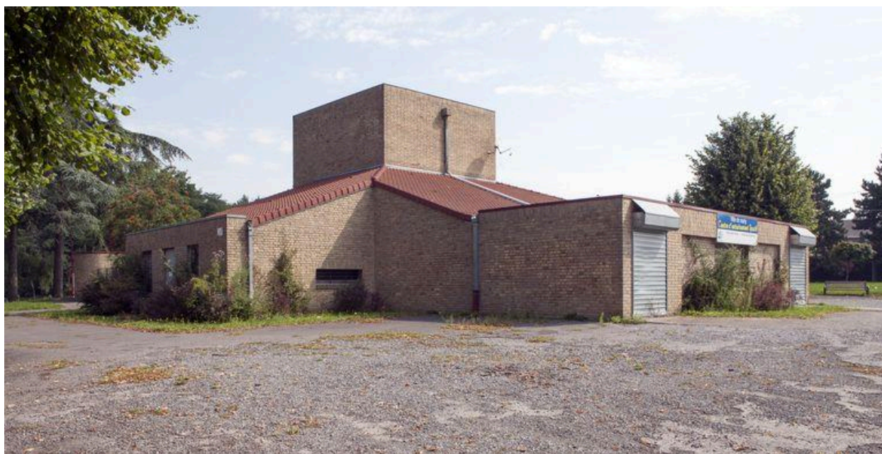
Élévation sud ouest.