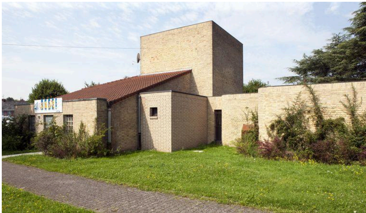
Élévation nord est.