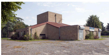
Élévation sud ouest.