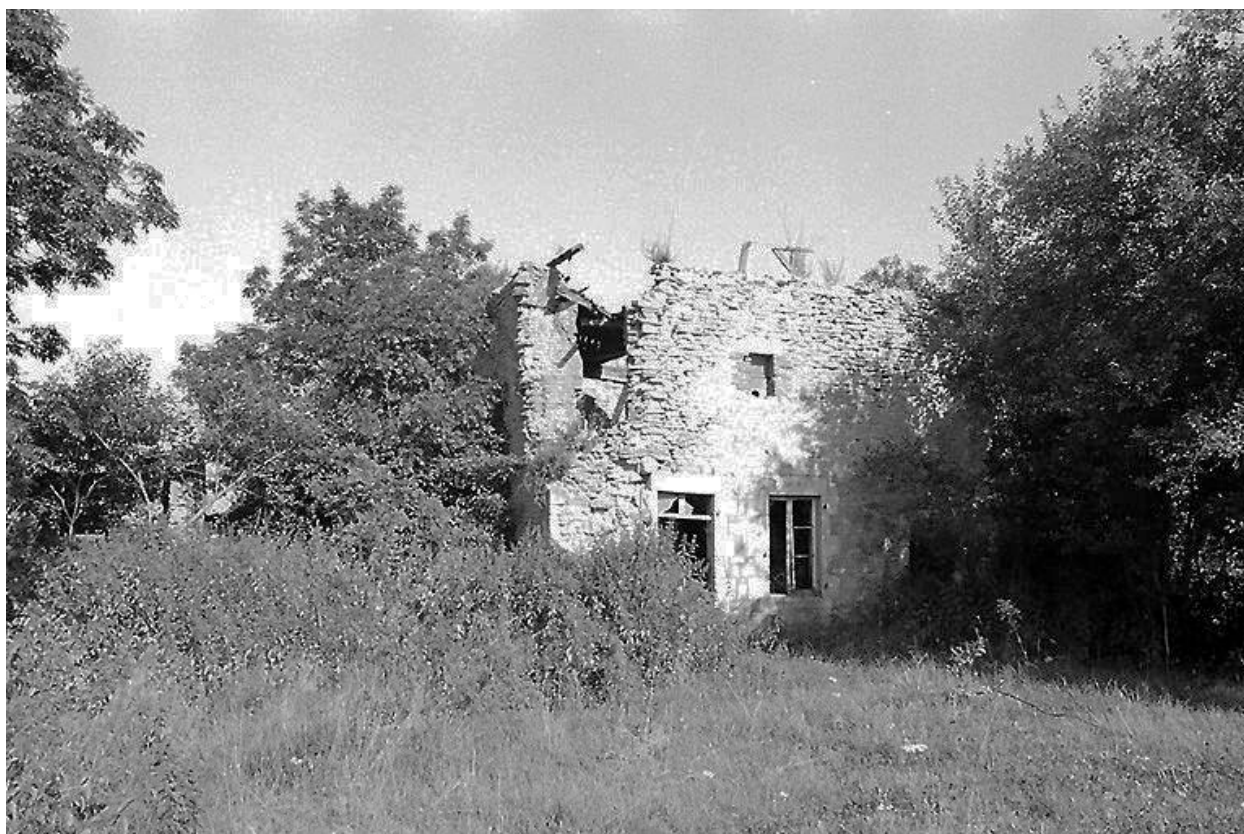
Vue du logis ruiné, avec sur la gauche, les vestiges de l'échauguette circulaire.