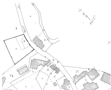
Plan de situation. Extrait du plan cadastral de 1986, section ZC. IVR22_20080290011NUCA