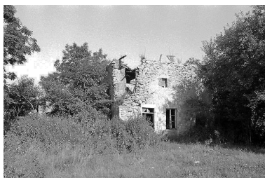
Vue du logis ruiné, avec sur la gauche, les vestiges de l'échauguette circulaire.