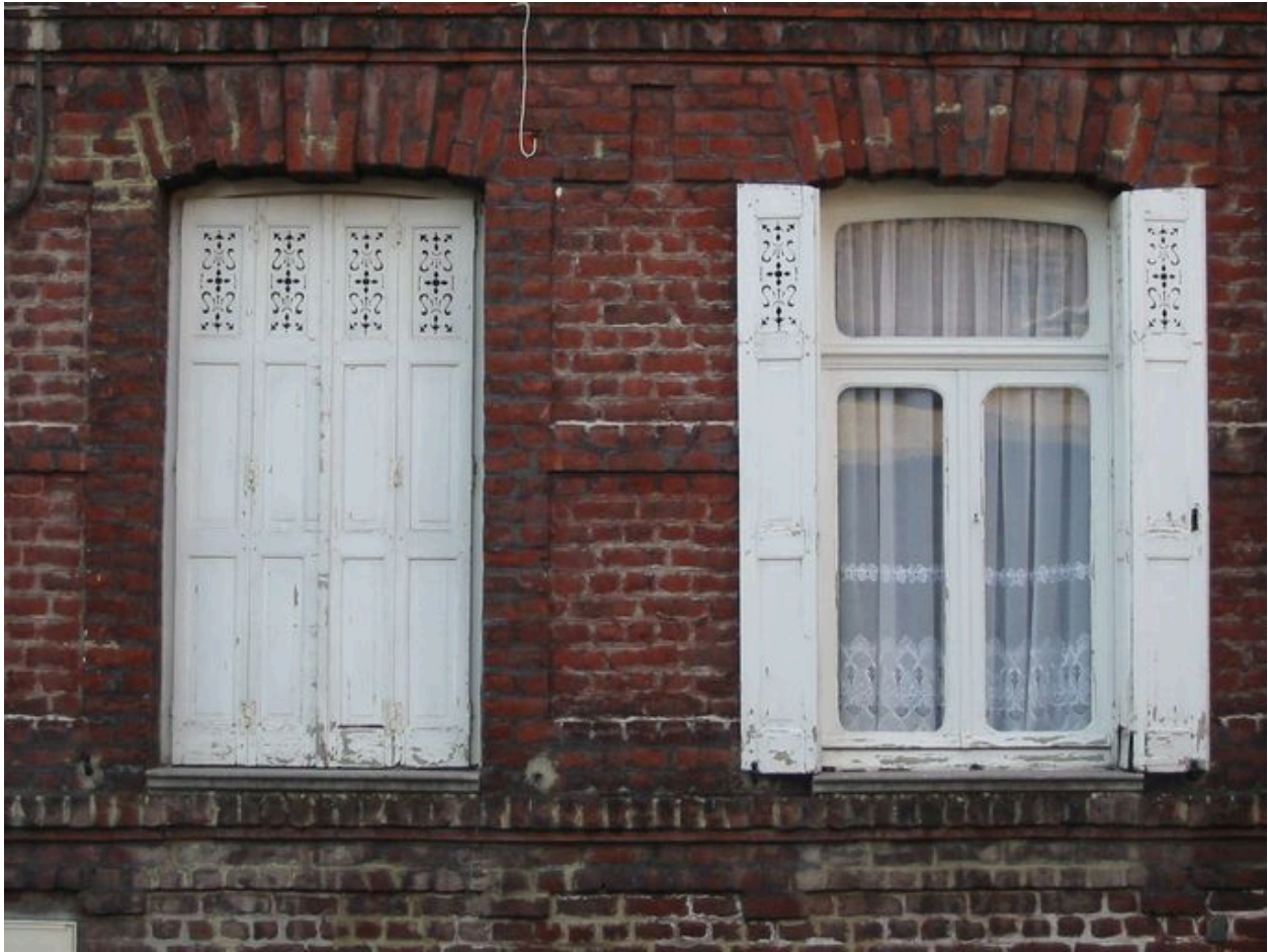
Rang nord-ouest : maison n° 31, détail, rez-de-chaussée, fenêtres garnies de volets en menuiserie ajourée.