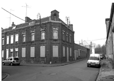
Rang nord-ouest, maison faisant l'angle avec la rue de la Bibliothèque.