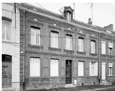
Rang nord-ouest : maison n° 31.