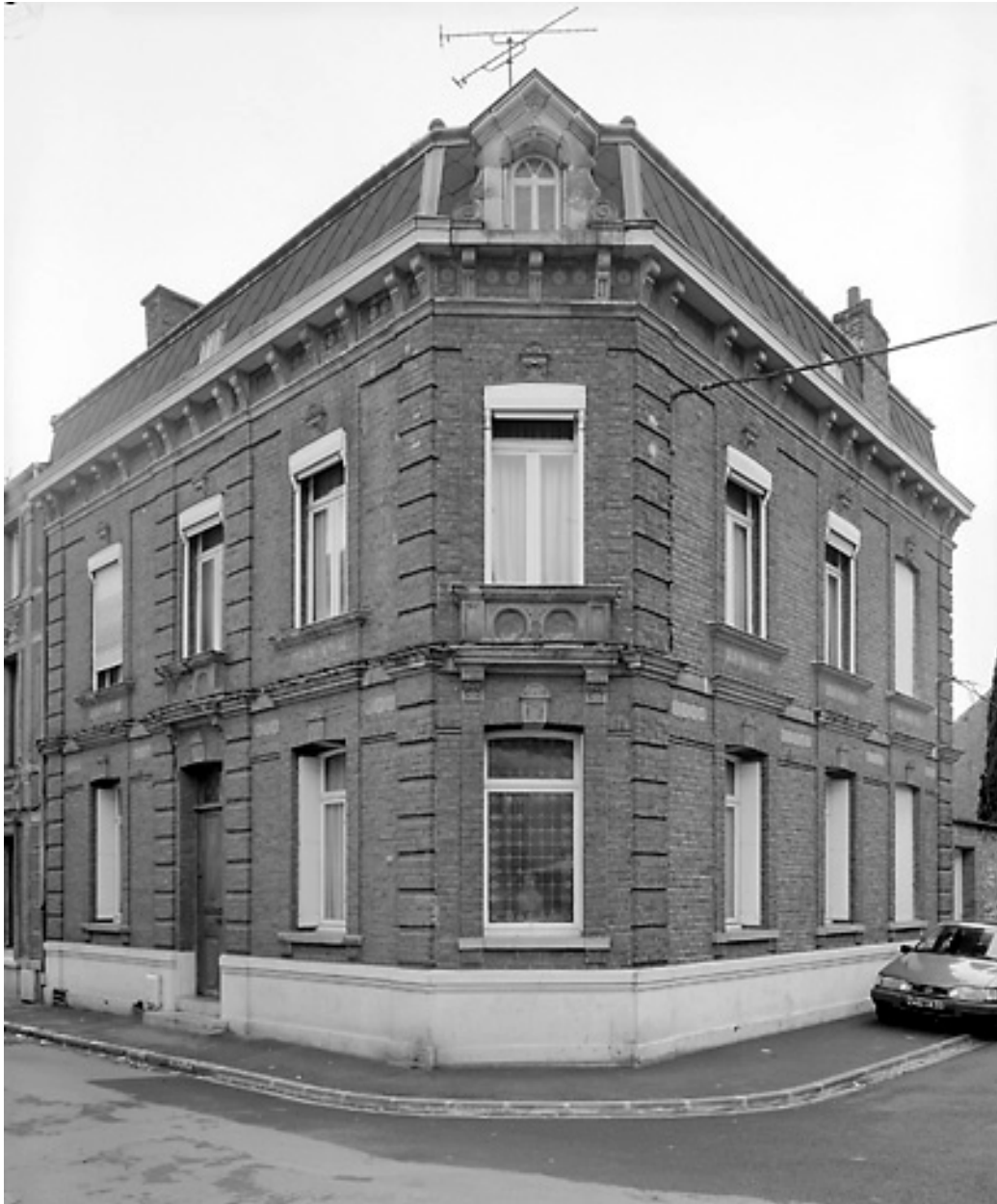
Rang sud-est, maison faisant l'angle avec la rue de la Bibliothèque.