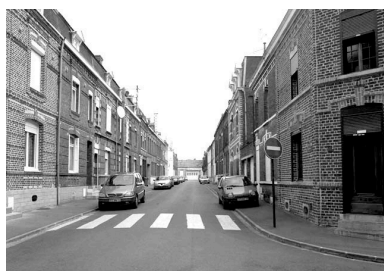
Vue générale de la rue Faidherbe vers la rue de la Bibliothèque.