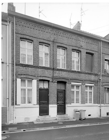
Rang sud-est : maisons n° 10 et 12.