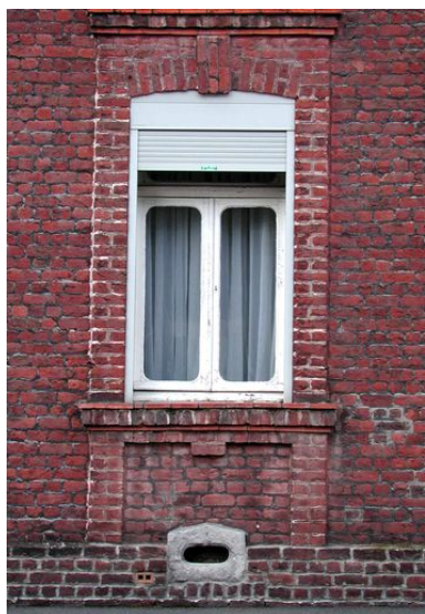
Rang nord-ouest : maison faisant l'angle avec la rue de la Bibliothèque,

IVR31_20065906307NUCA