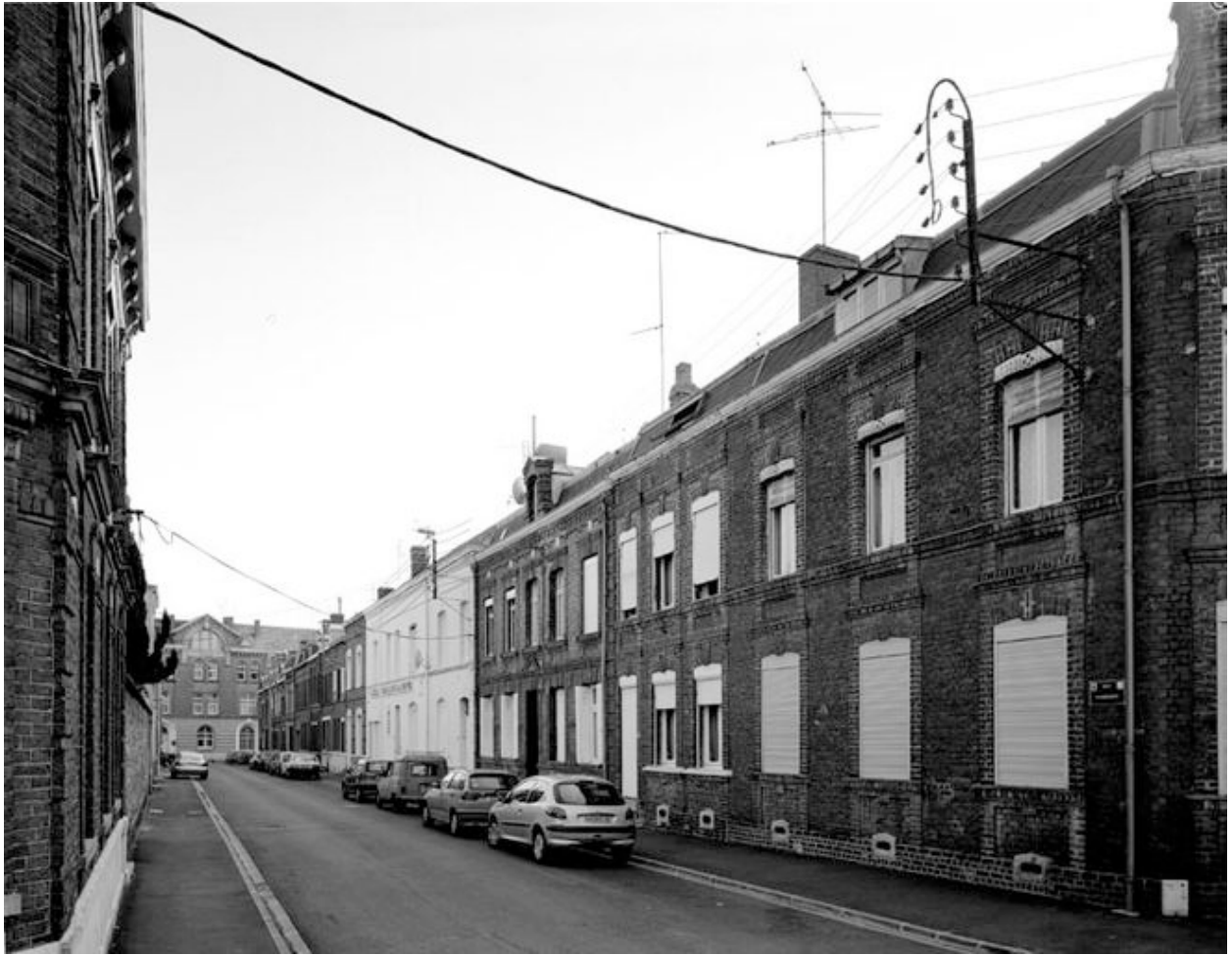
Vue générale de la rue Faidherbe, rang nord-ouest, vers la rue du Maréchal-de-Croy.