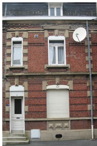
Rang nord-ouest : maison n° 7.

IVR31_20065906307NUCA