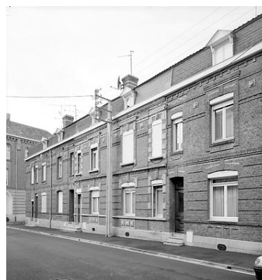
Rang nord-ouest, extrémité vers la rue du Maréchal-de-Croÿ : maisons n° 1 à 11.