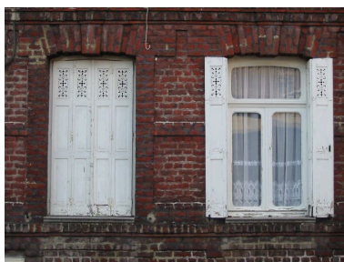
Rang nord-ouest : maison n° 31, détail, rez-de-chaussée, fenêtres garnies de volets en menuiserie ajourée.

Phot. François Bisman IVR31_20065906309NUCA