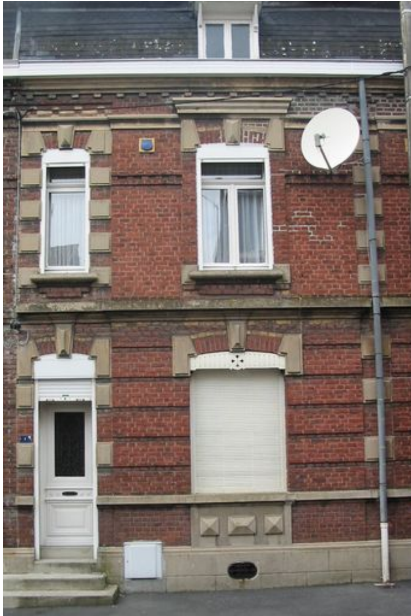
Rang nord-ouest : maison n° 7.