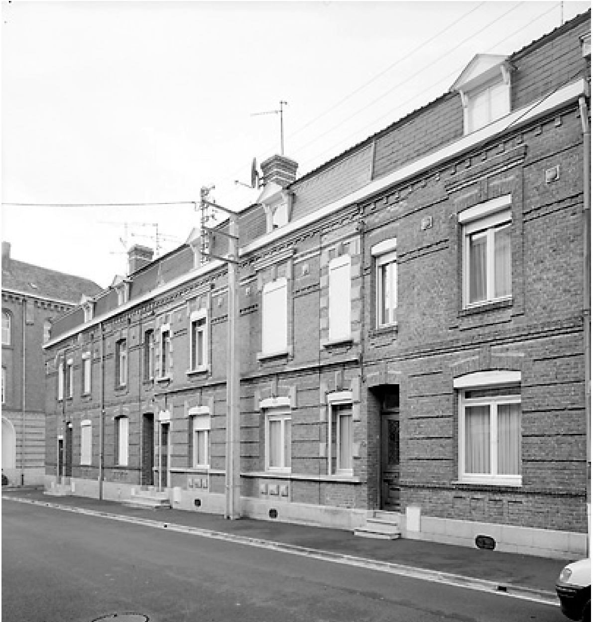
Rang nord-ouest, extrémité vers la rue du Maréchal-de-Croÿ : maisons n° 1 à 11.