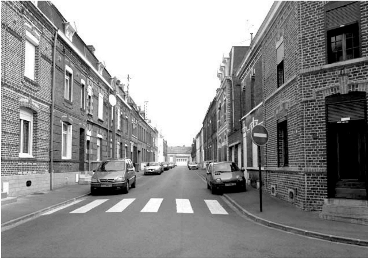
Vue générale de la rue Faidherbe vers la rue de la Bibliothèque.