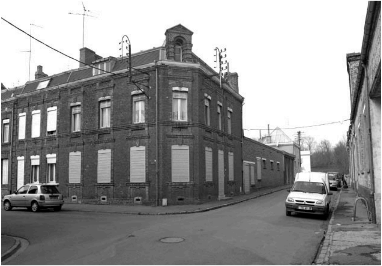
Rang nord-ouest, maison faisant l'angle avec la rue de la Bibliothèque.