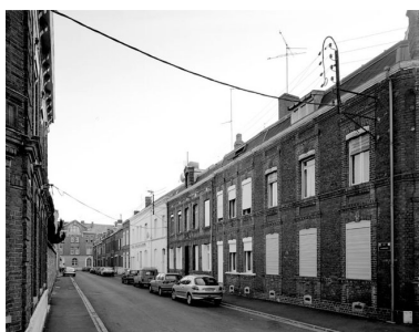
Vue générale de la rue Faidherbe, rang nord-ouest, vers la rue du Maréchal-de-Croÿ. IVR31_20025901281V