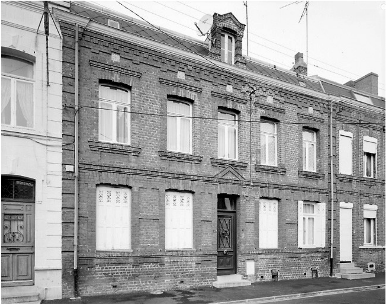
Rang nord-ouest : maison n° 31.