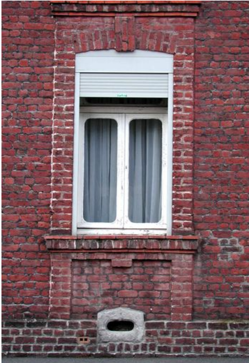
Rang nord-ouest : maison faisant l'angle avec la rue de la Bibliothèque, détail, rez-de-chaussée, fenêtre avec encadrement de reliefs de brique.