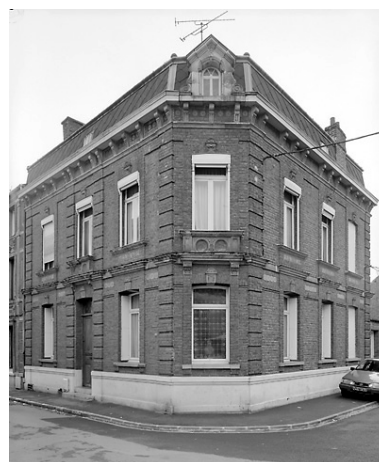
Rang sud-est, maison faisant l'angle avec la rue de la Bibliothèque.