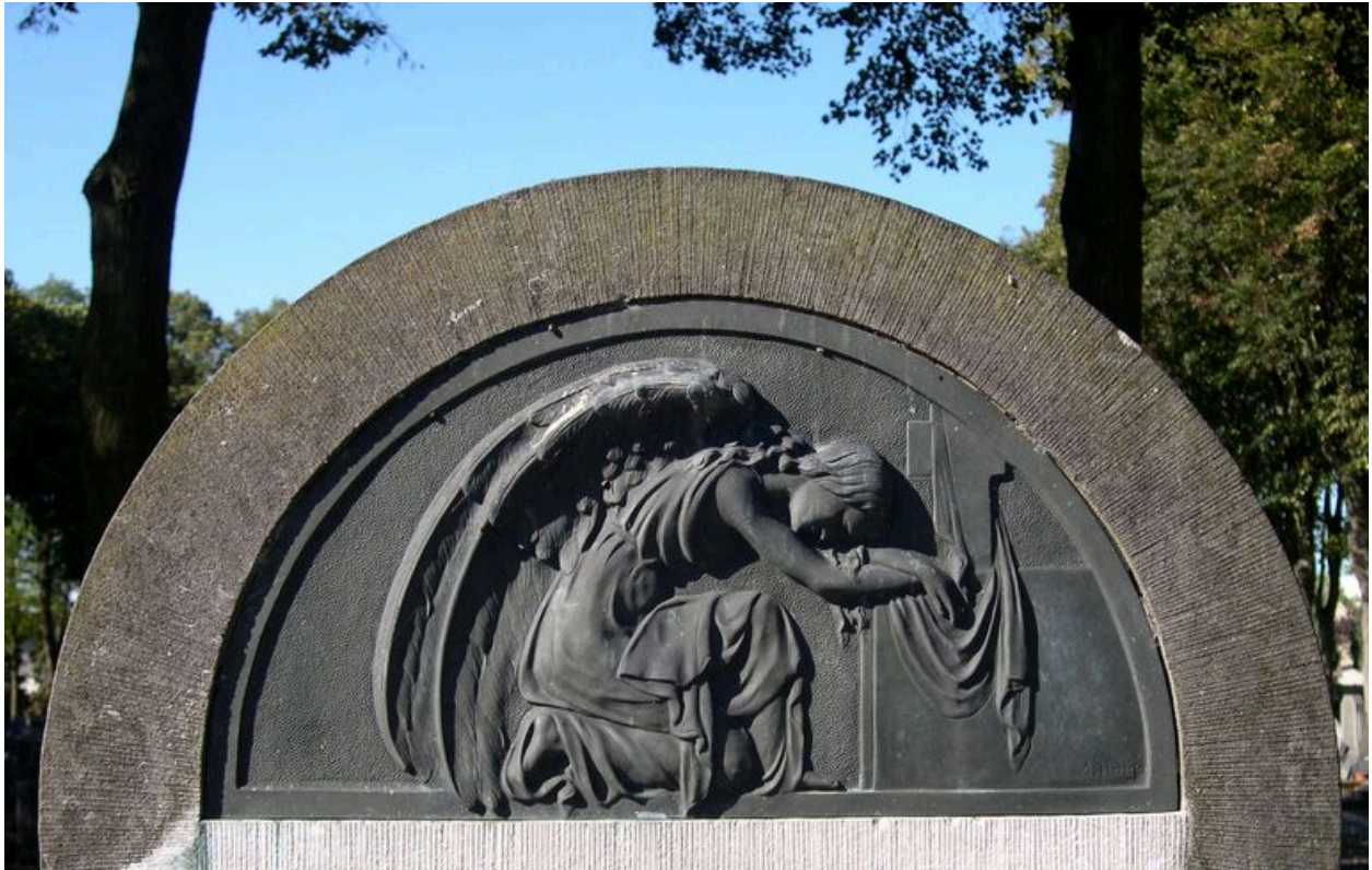
Vue de détail du décor de la stèle.