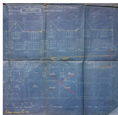
Plan et élévation (côté impair) par Charavel, Ernault et Melendès, 1922 (AC Saint-Quentin). Phot. Pillet Frédéric

Phot. Pillet Frédéric IVR22_20050206668NUCAB