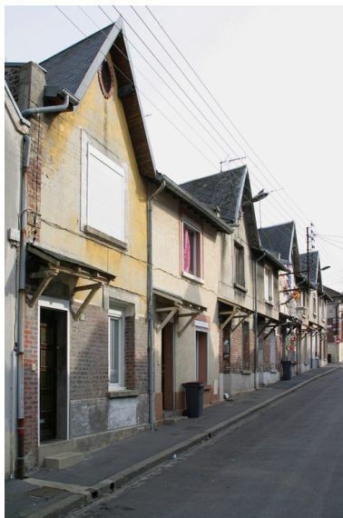
Les huit logements côté est. IVR22_20060205095NUCA