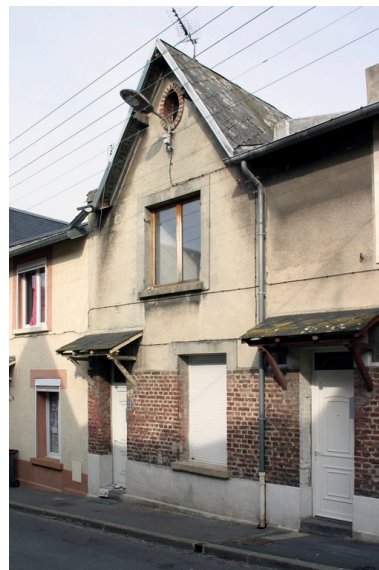
Façade antérieure d'un logement à lucarne. IVR22_20060205096NUCA