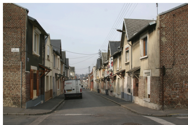
Vue d'ensemble. IVR22_20060205094NUCA