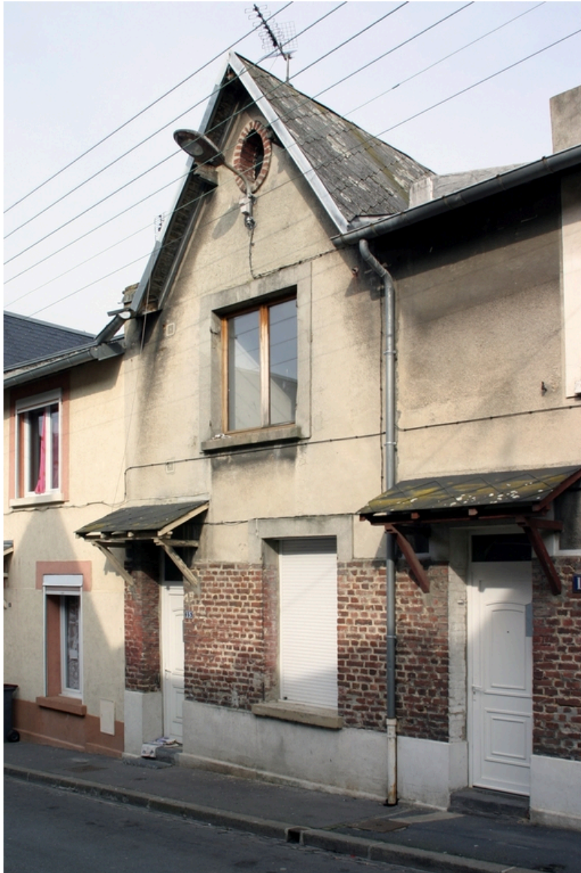
Façade antérieure d'un logement à lucarne.