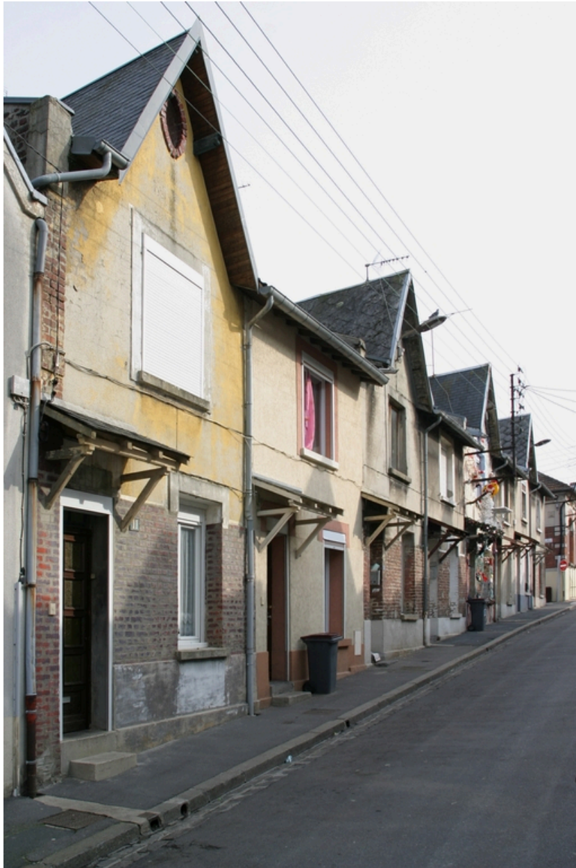
Les huit logements côté est.