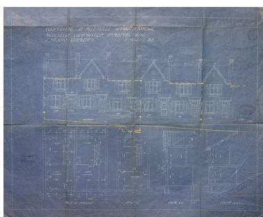
Plan et élévation (côté pair) par Charavel, Ernault et Melendès, 1922 (AC Saint-Quentin).

IVR22_20050206667NUCAB