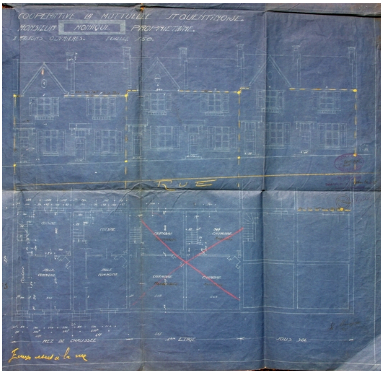
Plan et élévation (côté impair) par Charavel, Ernault et Melendès, 1922 (AC Saint-Quentin).