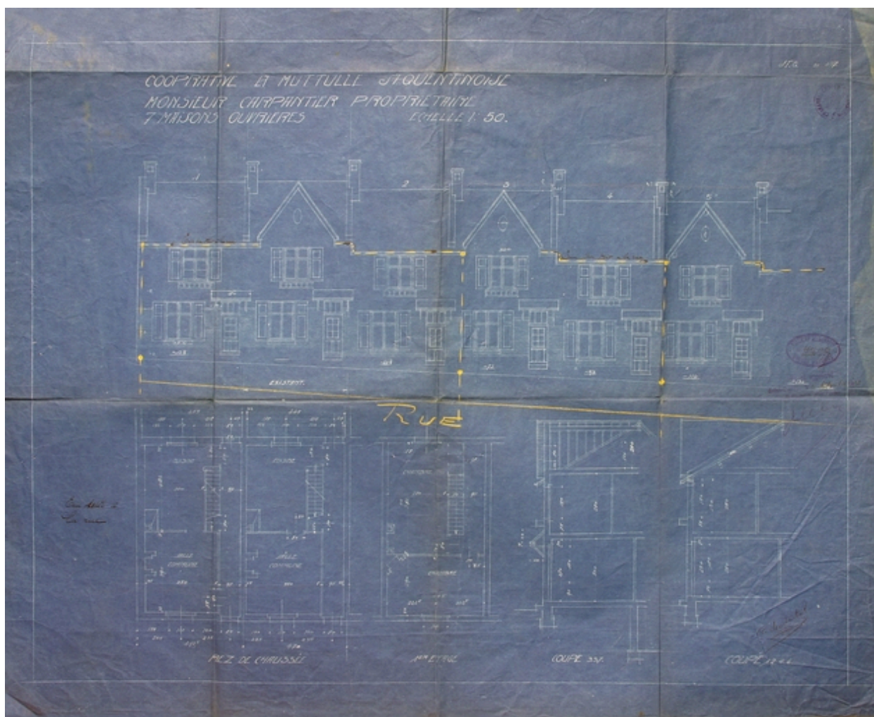
Plan et élévation (côté pair) par Charavel, Ernault et Melendès, 1922 (AC Saint-Quentin).