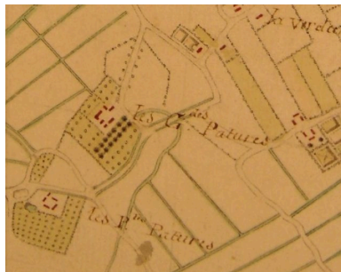
Plan de la ferme extrait d'une carte du 18e siècle.