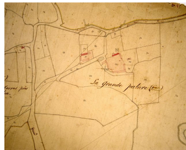
Extrait du cadastre napoléonien présentant le plan de la ferme en 1826.