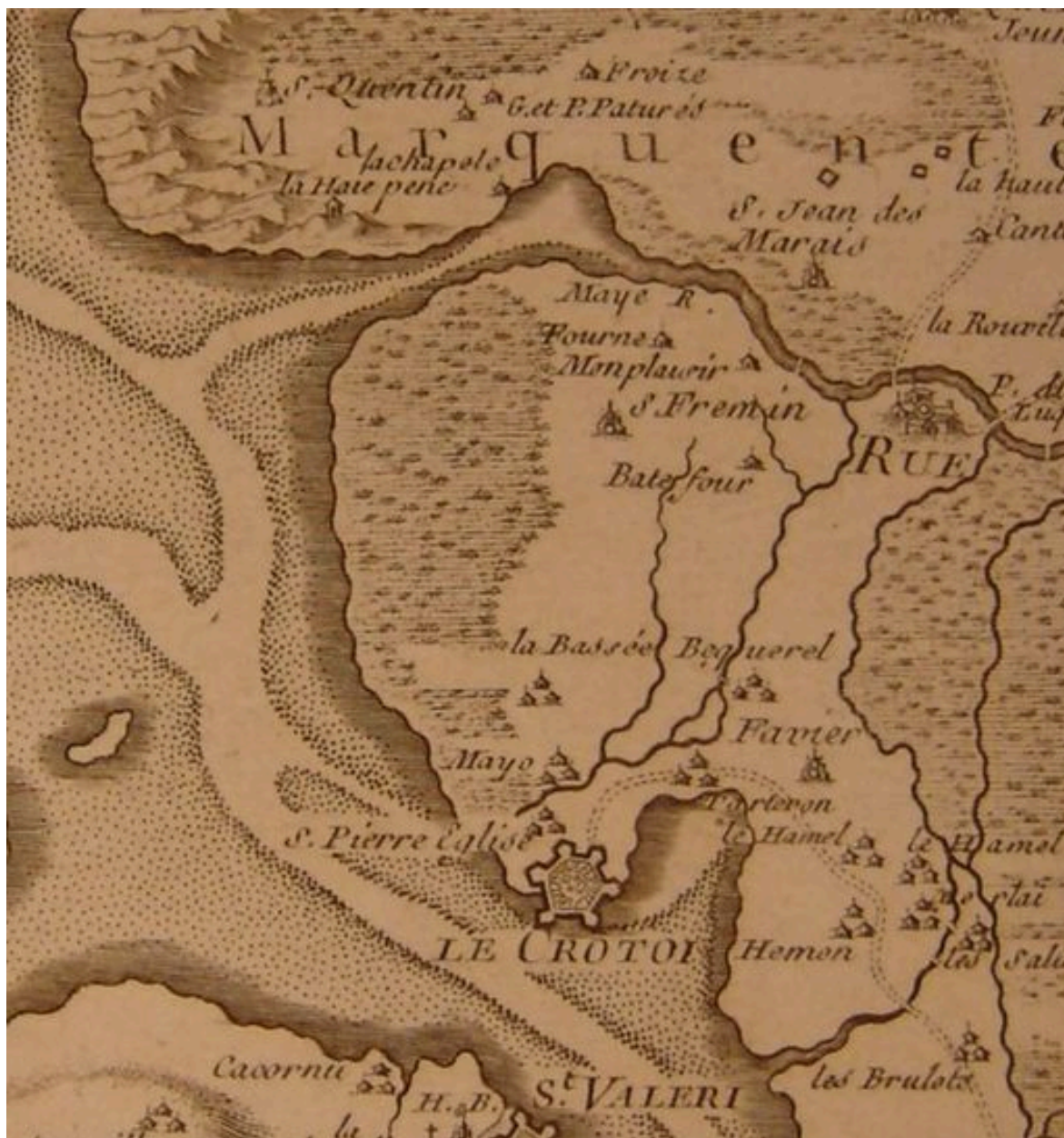
Carte de la baie de Somme en 1744 présentant le territoire.