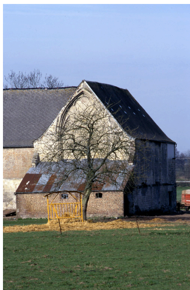
Eglise abbatiale, depuis l'est.