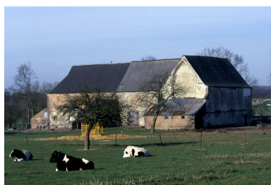
Vue générale, depuis le nord-est.