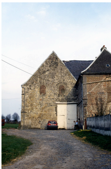
Vue de la façade de l'église abbatiale.