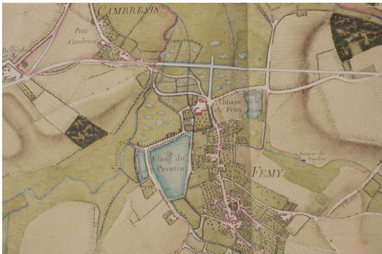
Plan de l'abbaye de Fémy et de ses alentours, Atlas Trudaine, [3e quart 18e siècle] (AN ; F14 8503).