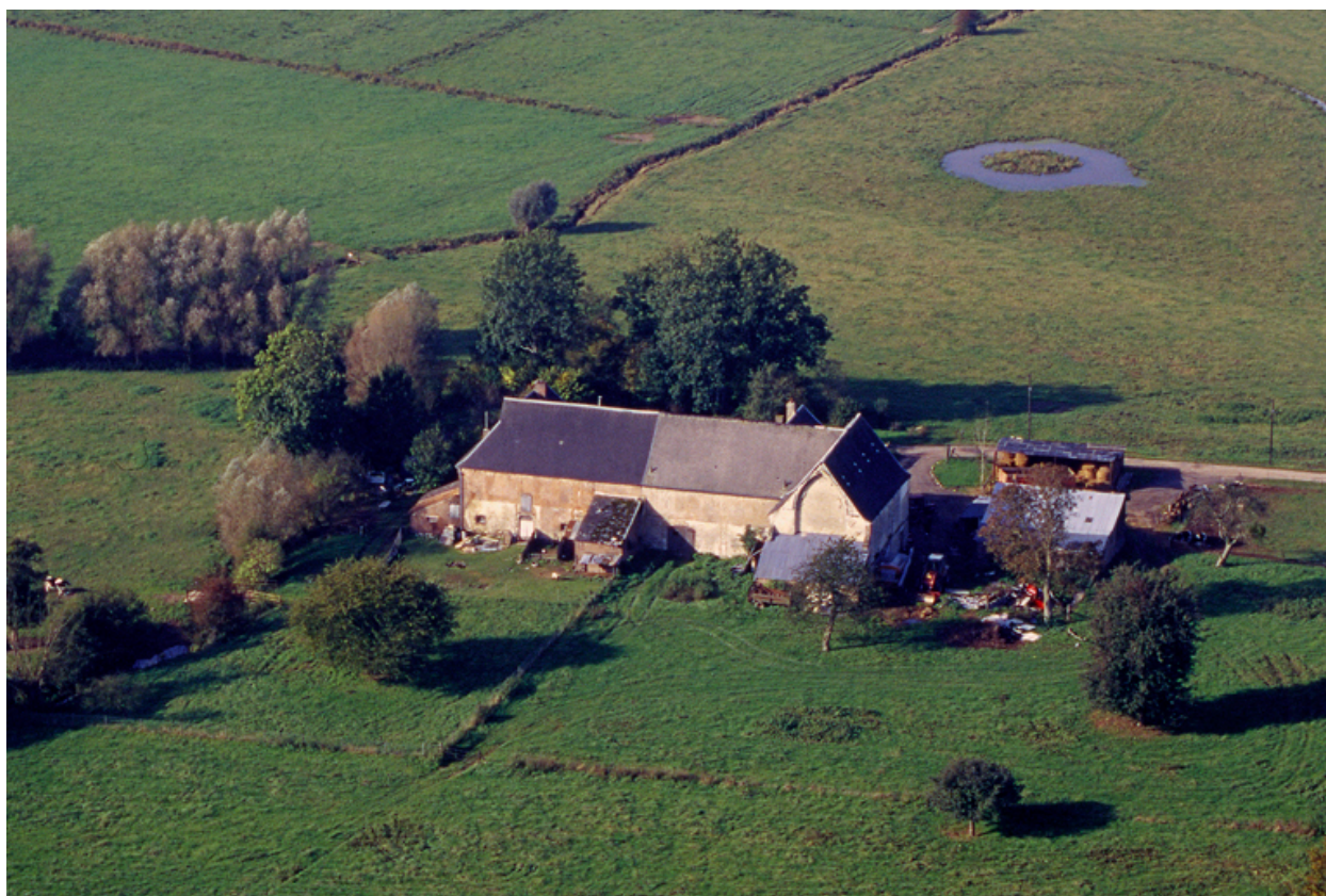
Vue aérienne nord-est des bâtiments subsistants de l'abbaye et du site.