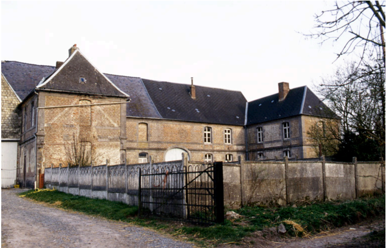
Vue de l'élévation ouest des bâtiments subsistants.