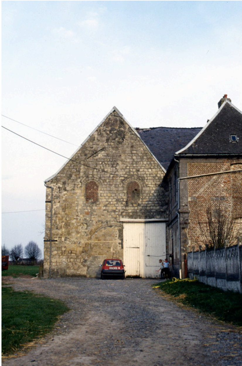
Vue de la façade de l'église abbatiale.