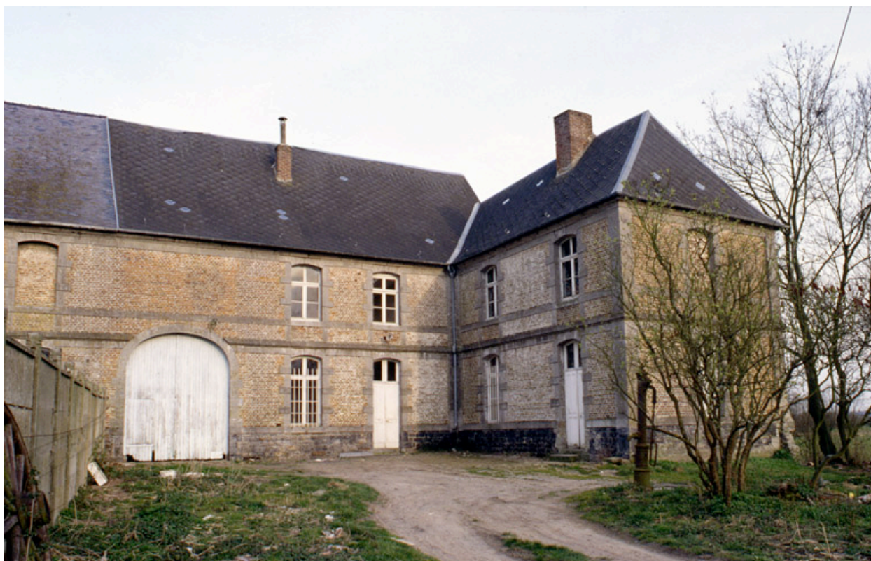
Vue partielle de l'élévation ouest des bâtiments subsistants.