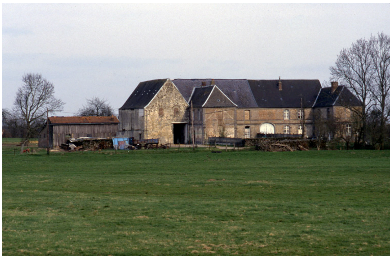
Vue générale, depuis l'ouest.