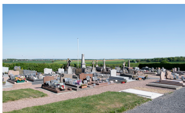
Vue générale depuis le nord-ouest.

IVR32_20256000557NUCA