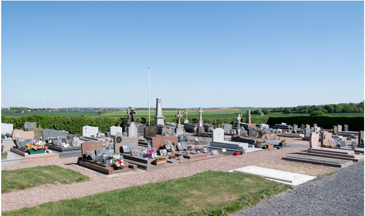
Vue générale depuis le nord-ouest.