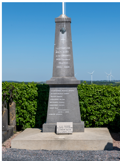
Monument aux soldats morts pendant la Première Guerre mondiale, par Boussard, vue depuis l'ouest.

Phot. Marc Kérignard IVR32_20256000275NUCA