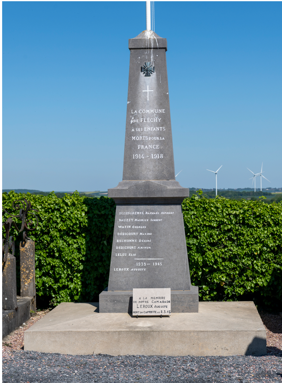
Monument aux soldat morts pendant la Première Guerre mondiale, par Boussard, vue depuis l'ouest.