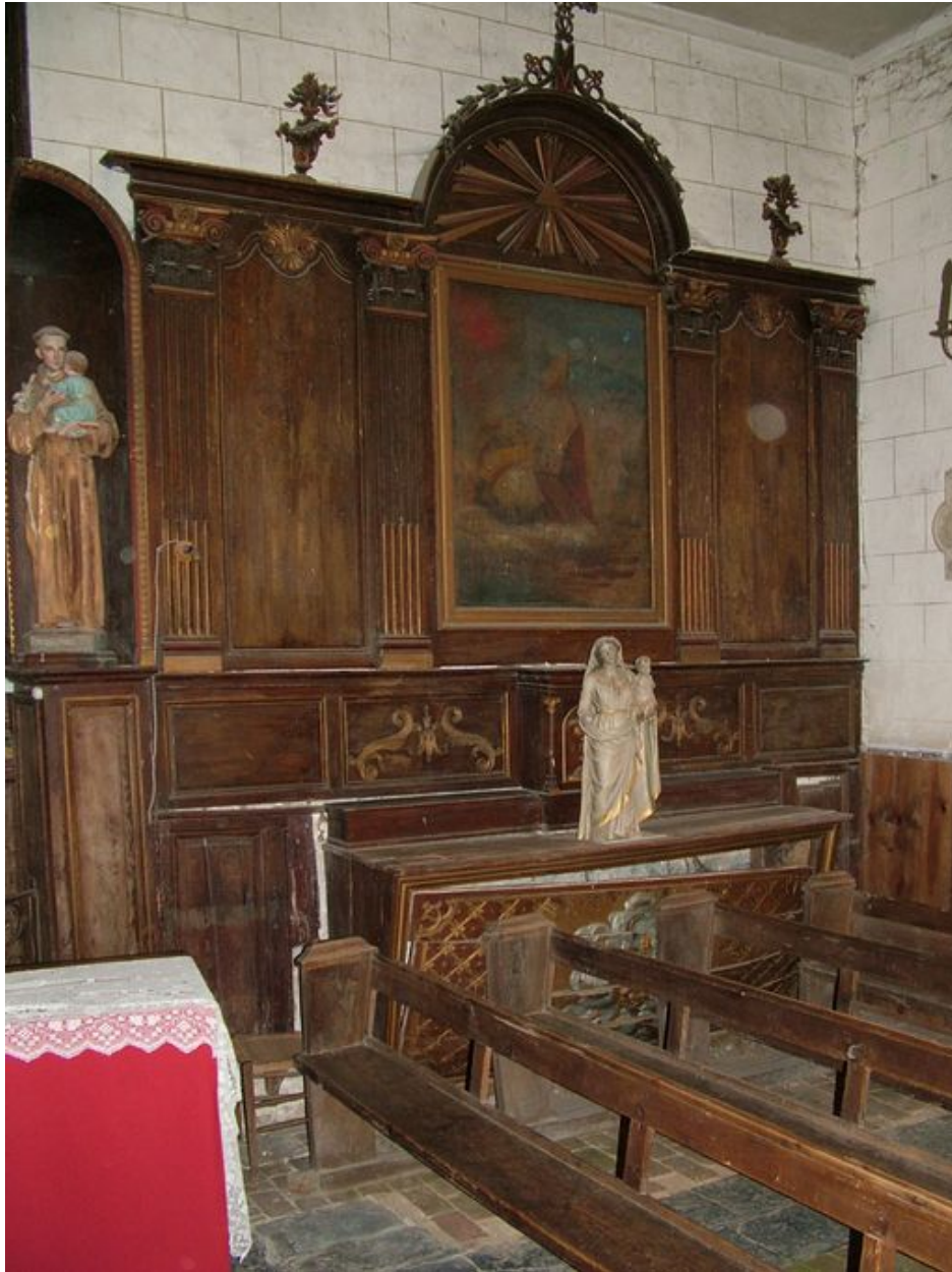
Bras sud du transept.