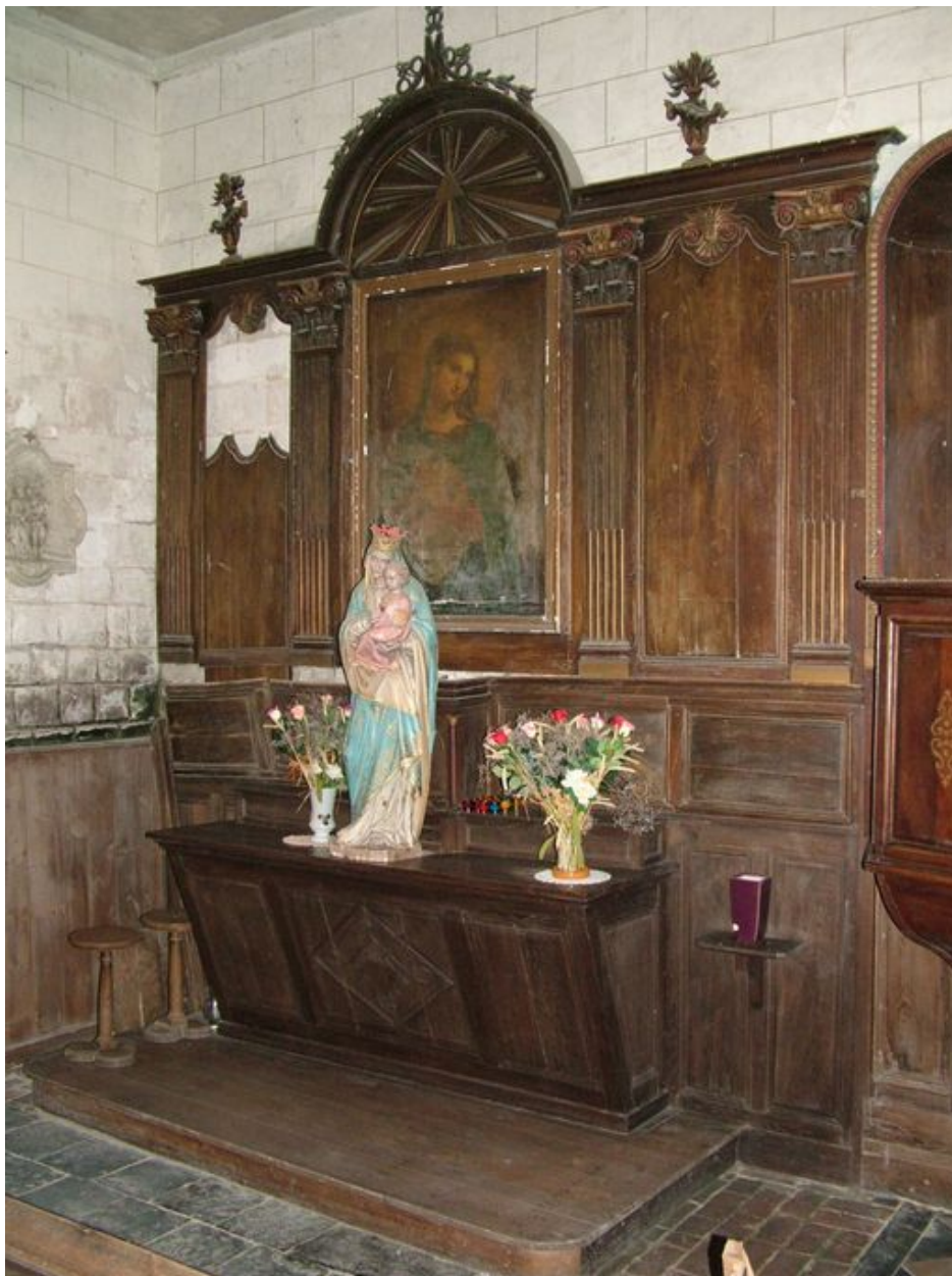
Bras nord du transept.