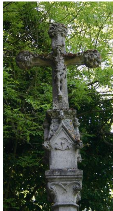
Vue de détail sur le décor sculpté représentant les instruments de la Passion : les trois clous gravés sur la face antérieure de la croix. IVR22_20088000825NUCA