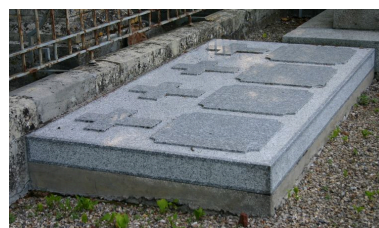
Dalle funéraire. IVR22_20088000677NUCA