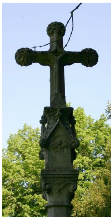
Vue de détail sur le décor sculpté représentant les instruments de la Passion : une corde, une tenaille et un marteau gravés sur la face postérieure de la croix.