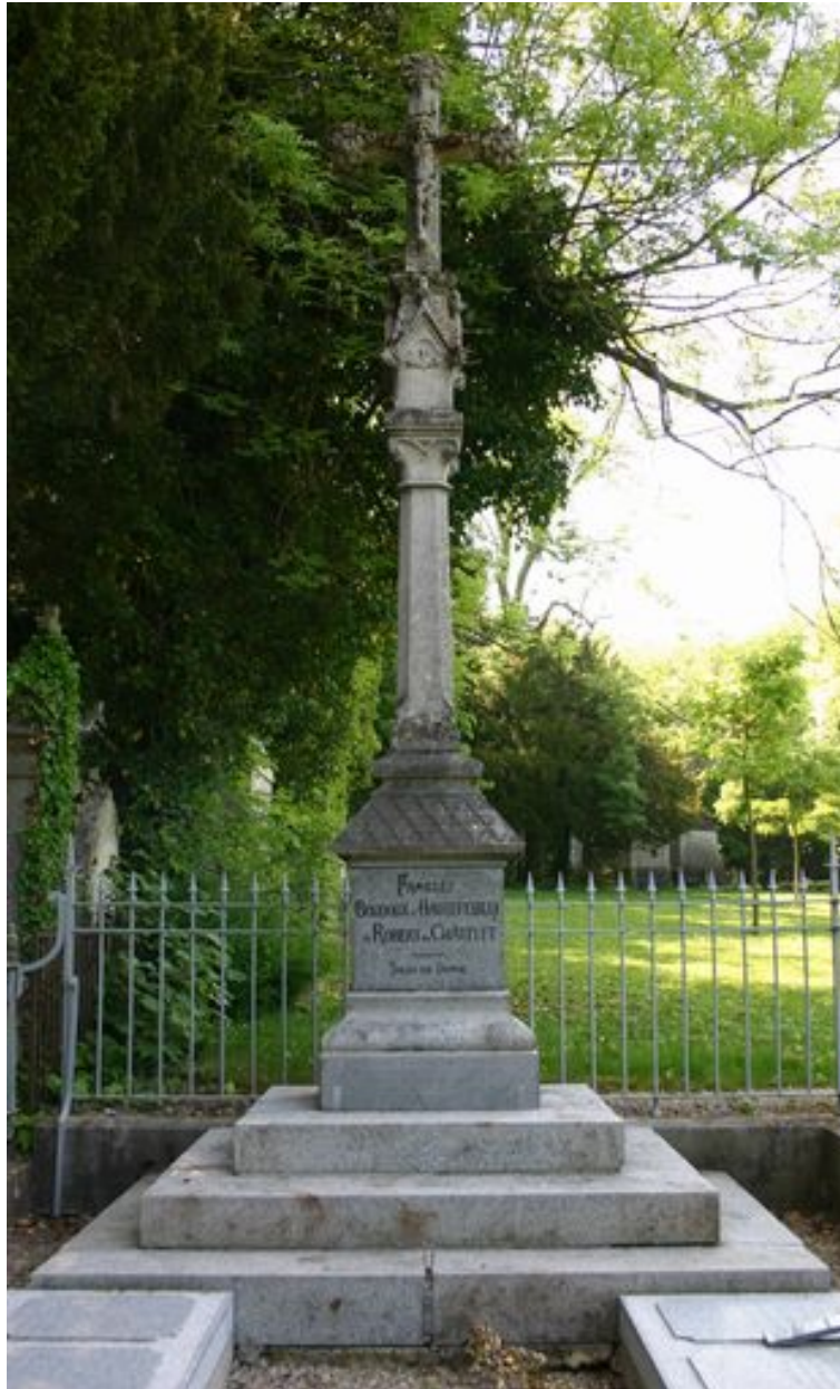
Tombeau-monument en forme de croix de calvaire.