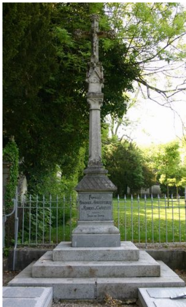
Tombeau-monument en forme de croix de calvaire. IVR22_20088000676NUCA