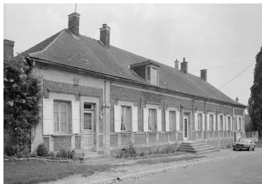
Vue générale. IVR22_19846001005X

Plan de situation. Extrait du plan cadastral de 1982, section B2 343. IVR22_20096000023NUCA